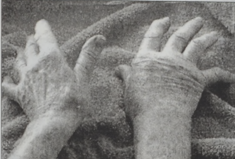
Արթրիթի հետեւանքները՝ ձեռքերու յատկապէս անհարմարեցնող ձեւով ձեւազոյնումը

Միջերկրա կանեան սննդականոն մը, հարուստ՝ ձիթաւիղով, ձուկով, հաւազգիններով, պտուղով եւ բանջարեղէնով, կրնայ թեթեւեցնել արթրիթի ախտանշանները, կ'ըսեն շուէտացի մասնագէտները: