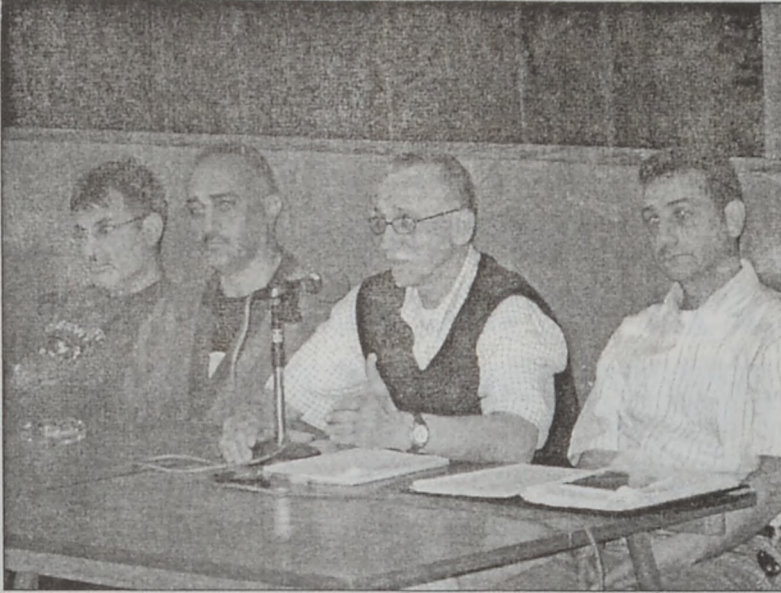
Ֆուտբոլի պատասխանատուները եւ մարպիչը՝ Ելոյթի պահուց

Մասնաւորաբար շեշտը դրուեցաւ խումբին օժանդակելու նւթապէս, իրաքանչիւր համակիր իր կարելիութեան սահմաններուն մէջ: Այդ գծով ֆուտբոլի յանձնախումբը ըսաւ, որ խումբին անունով ԱՖԵՏԻ մօտ յատուկ հաշի մը բացուած է,