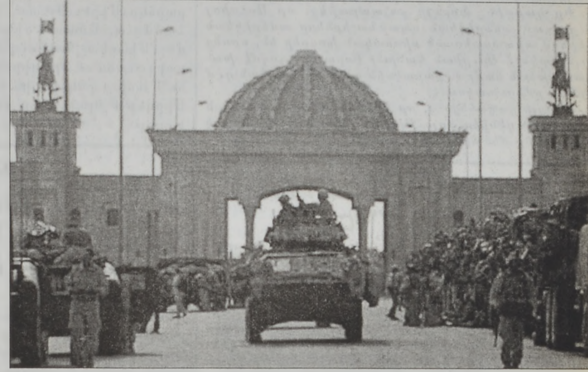
Ամերիկեան բանակը՝ Թիքրիթի կեդրոնը

Մինչ այդ, Պաղատաի մէջ ամերիկեան ուժերը ճնշումի կ'ենթարկուին երաշխաւորելու համար քաղաքի բնակիչներուն ապահովութիւնը: Երէկ առաջին անգամ ըլլալով իրաքեան ոստիկանութիւնը եւ ամերիկեան ուժերու միասնաբար շրջեցան թաղերուն մէջ՝ արգիլելու համար օրինապահ ցուցիչները, կողոպուտը եւ վայրագ արարքները: Պաղատաի բնակիչները կը պահանջեն, որ կարգ ու կանոնը վերահաստատուի քաղաքին մէջ, որ թալանի ենթարկուած էր անցնող քանի մը օրերուն: