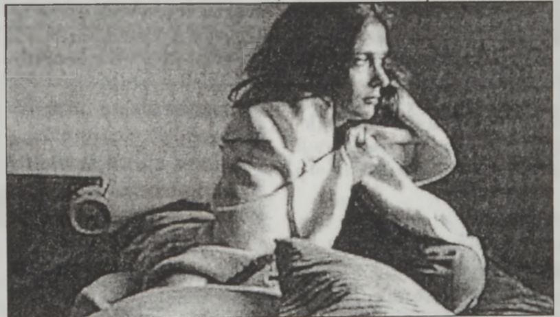
Չափազանց քիչ կամ շատ քնանալը կրնայ սրտի հիւանդութիւն պատճառել, ըստ հետազոտութեան մը արդիւնքներուն

Մասնագէտները տարակարծիք են այն հարցին շուրջ, թէ որքան քունի կարիք ունի անձ մը՝ առողջ մնալու համար: Այն գաղափարը, թէ կարելի է անձ մը ինքզինք մարդիկ գիշերը միայն քանի մը ժամ քնանալու համար, բանավէճի հարց է: