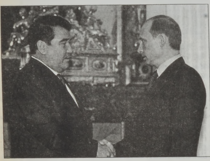
Նիպոլով եւ Փուլին

ՄՈՍԿՈՒԱ, 10 (ԱՅՓ).- Ռուսիոյ նախագահ Վլադիմիր Փուլին Հինգշաբթի օր Թուրքիոյ նախագահին հետ կազմեց 25 տարուան պայմանագրութիւն մը կնքած է: