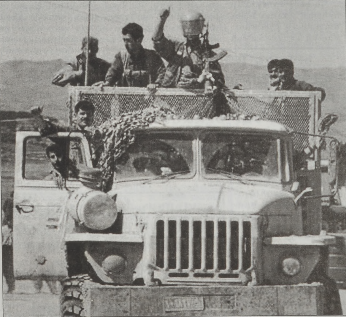
Քիրտ զինեալներ՝ Զերքուցի մէջ

եւս պայթումներու ճայնէն արթնցան: Շէնքերու մէջ, կամուրջներու եւ ինքնաշարժներու տակ պահուրտած փնտալներ յարձակում-