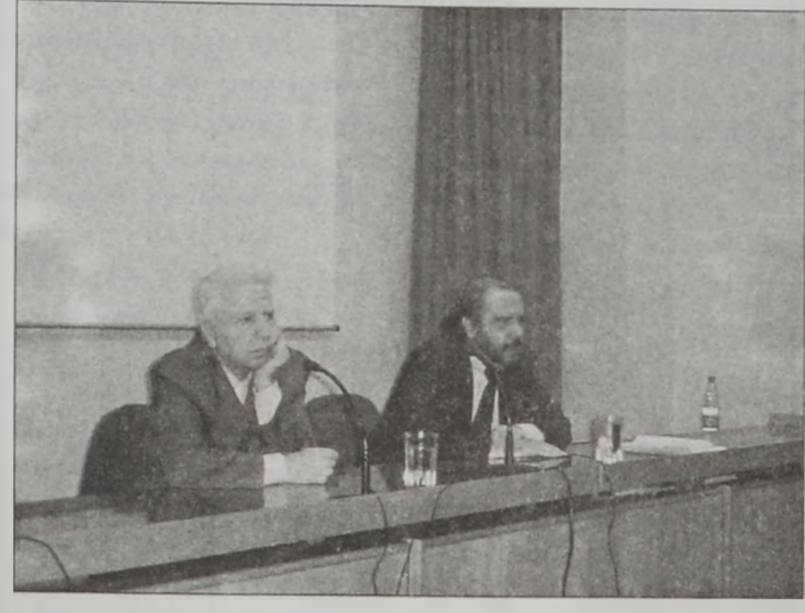
Դասախօսները՝ իրենց ելոյթի պահուն

Արցախեան պահանջատիրութեան 15ամեակին առիթով, երէկ, Մէն Ժոյէֆ համալսարանի Հայ Ուսանողներու Միութեան կազմակերպութեամբ տեղի ունեցաւ դասախօսական երեկոյ, «Ժողովուրդներու ինքնորոշման իրաւունքն ու սահմաններու ամբողջականութեան սկզբունքներու միջոց» թեմայով: