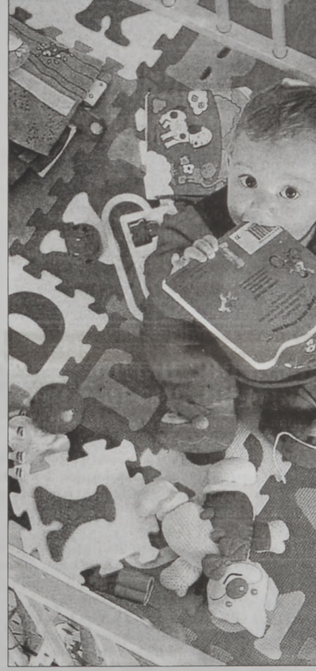
ՈՉ ՊԱՏԻՑ, ՈՉ ԼՔՈՒՄ

Ուշադիր ըլլանք, փարքը կրնայ մեկուսացնել երեխան, ինչ որ սխալ է, պէտք է յաճախ խօսիլ անոր հետ, երգել անոր համար, որպէսզի կապը չխզուի: Ձայնասփիւռն ու պատկերապիւրը երբեք չեն փոխարիներ մօր մը քաղցր ձայնը: Եթէ երեխան երկար ատեն բանտարկուած մնայ, անոր մտային եւ ֆիզիքական յառաջդիմութիւնը կը սանձուի, քանի որ երեխան կարիք ունի զինք շրջապատող միջավայր «հետախուզելու» եւ տարբեր մարզերը հետ «յարաբերելու»: Ուրեմն երեխան կէս կամ երեք բառերով ժամէն աւելի փարքին մէջ պահելու ճիշդ չէ: Կարելի է զայն փարքին մէջ դնել օրական 3 - 4 անգամ, բայց ոչ՝ երկար ժամեր: