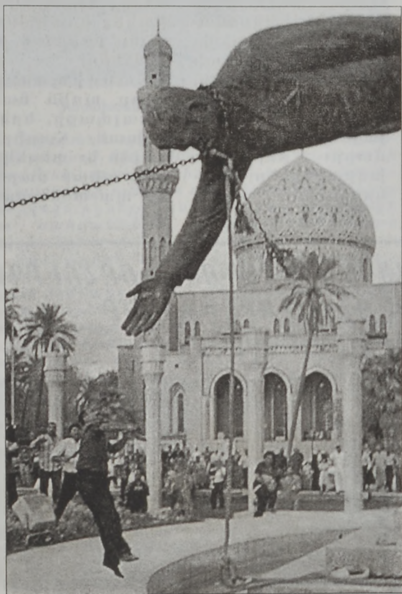
Սատտամ Հիւսէյնի արձանը վար կ'առնուի կեդրոնական Պաղտատի մէջ

Բրիտանիոյ վարչապետ Թոնի Պլէր երէկ յայտարարեց, որ Սատտամը տապալելու պատերազմը տակաւին չէ աւարտած: Պլէր, որ կը խօսէր խորհրդարանին մէջ, ըսաւ, որ տակաւին չափազանց դժուար է հաստատել թէ Սատտամի վարչակարգը տապալած է, երբ յայտնի չէ, որ ինչ