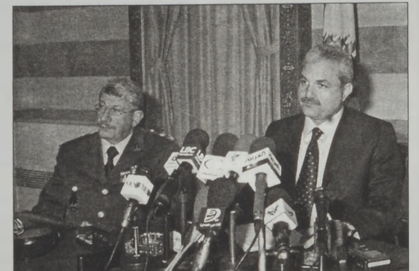
Նախարար Մըր՝ մամլոյ ասուլիսի պահուն

ձեռքարկուածները բոլորն ալ լիբանանցիներ են եւ կը բնակին Պէյրութ եւ Գամաւկու: Ան աւելցուց, որ աւելի ուշ պիտի հրապարակուին այլ հաղորդագրութիւններ, որոնց մէջ պիտի նշուին ձեռքարկուածներուն անունները, ինչպէս նաեւ այլ նման-