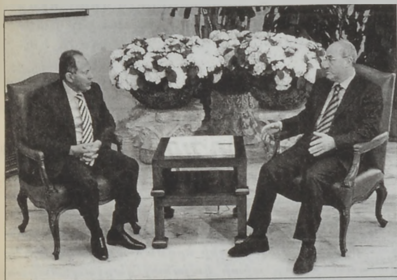
Լահուտ եւ Արիտի

Նախագահ ԿՕՐ. Էմիլ Լահուտ երկր Պապա- տայի մէջ ընդունեց արտաքին գործոց եւ ար- տերկրի լիբանանցիներու հարցերու նախարար Մահմուտ Համուտը, որուն հետ քննարկեց Իրա- քի դէմ ամերիկեացիներու կողմէն արտադրու- ինչպէս նաեւ անոր նկատմամբ շրջան ընդ- տարբեր կեցումներն ու հակադէմոստրացի- աները: