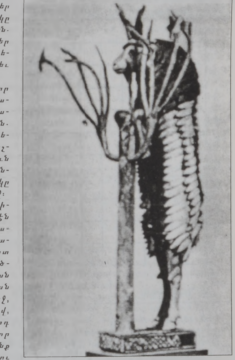
Այծի քանդակ Ուրի թագաւորական դամբարանին մէջ

Մարեր, սկիւթացիք, քաղդէացիք, եգիպտացիք եւ հայեր դաշնակցած քալեցին Նինուէի վրայ: Աշուր ինկաւ 614ին: Նինուէ պաշարուեցաւ 612ին եւ երեք ամսուան կռիւներէ ետք երբ զօրաւոր հեղեղներու ու ողողմաներու պատճառով մայրաքաղաքին պարիսպները փուլ եկան, անոնք թշնամիները խուժեցին ներս եւ գրաւեցին, հրդեհեցին ու հիմնայնապէս կործանեցին գայն. վերջին թագաւորը Սինառիշխուն իր պալատի բոցերուն մէջ նետեց ինքզինք: Ասորեստանեան ուժերու մնա-