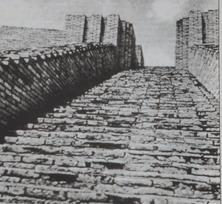
Բաբելոնի զիկուրաթը (բրգաձու աստիճանաւոր տաճար. Միջագետքի գլխաւոր քաղաքներէն իւրաքանչիւրը իր զիկուրաթը ունէր. զիկուրաթի տաճարը քաղաքի գլխաւոր Աստուծոյ բնակատեղին էր)

Թագաւորական պալատը, որ կը կոչուէր «պալատ առանց մրցակիցի», ամենի բարձրութեամբ եւ գեղեցիկ, գունազեղ սալաքարերով զարդարուած պատերով, հսկայ արձաններով, քանդակներով եւ ութսուն մեծ սենեակներով հոյակերտ եւ ամբարձու կառոյց մըն էր: Տասնութը ջրանցքներ բարձրունքներէն ջուր կը մատակարարէին քաղաքին: Հուշակաւոր էր մատենադարանը, ուր մօտաւորապէս երեսուն հազար սեպագիր կաւէ սալիկներ պահպանուած էին: Ամբողջ մայրաքաղաքը պարսկապետներով, աշտարակներով եւ տասնհինգ վիթխարի դարպասներով պաշտպանուած էր: