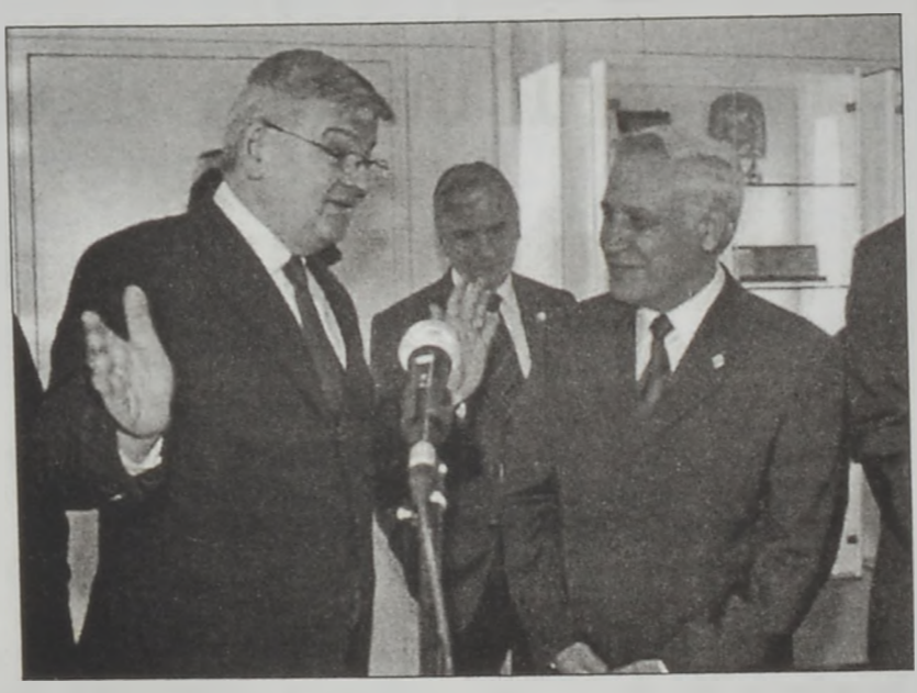
Ֆիշըր եւ Բացալ

Միացեալ Նահանգներ եւ Բրիտանիա յանձնառու կը մնան Միջին Արեւելքի խաղաղութեան համար միջազգային ուղեգիծի մը գործադրութեան, յայտնած է Մ. Նահանգներու նախագահ Ճորճ Պուշ երէկ Պեյֆասթի մէջ, Բրիտանիոյ վարչապետ Թոնի Պլեյրի հետ մամուլ ասուլիսի մը ընթացքին: Ան յայտնած է, թէ Միջին Արեւելքի մէջ խաղաղութիւնը պիտի պահանջէ, որ «պատմութեան եւ կրօնքի խոր տարակարծութիւններ յաղթահարուին»: