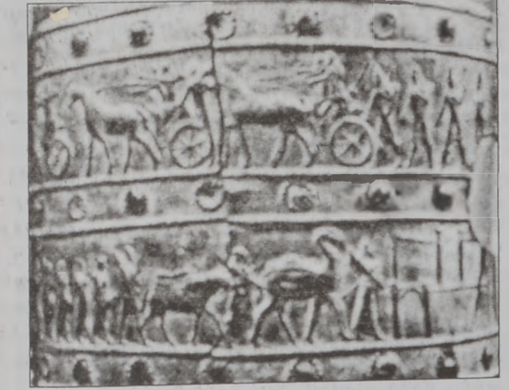
Ասորեստանի Սաղմանասար Գ. թագաւորին արշաւանքը դէպի Ասորիք

թիւնը ծաղկեցաւ հարաւային Միջագետքի մէջ, ուր կազմաւորուեցան քաղաք-պետութիւններ՝ Ուր, Ուրուկ, Քիւշ, Լակաշ, Լարսա, Նիփուր եւ այլն: Սումերներ ստեղծեցին պատկերազիրը եւ հետագային՝ սեպագիրը, որ տարածուեցաւ տարբեր երկրներ, նաեւ՝ Ուրարտու: Անոնք հարուստ բանահիւսութիւն, գրականութիւն ու մշակոյթ մշակեցին, հիմնեցին դիցարաններ, կազմեցին աստուածութիւններ, հաստատեցին բնութեան ուժերու՝ երկինքի, երկրի ու ջրերի պաշտամունքը, զարգացուցին գիտութիւնները, յատկապէս՝ թուարարութիւնը, աստղագիտութիւնը, բժշկութիւնը, ճարտարագիտութիւնը, կերպարուեստը եւ քաղաքաշինութիւնը: Սումերական քաղաքակրթութիւնը Ն. Ք.