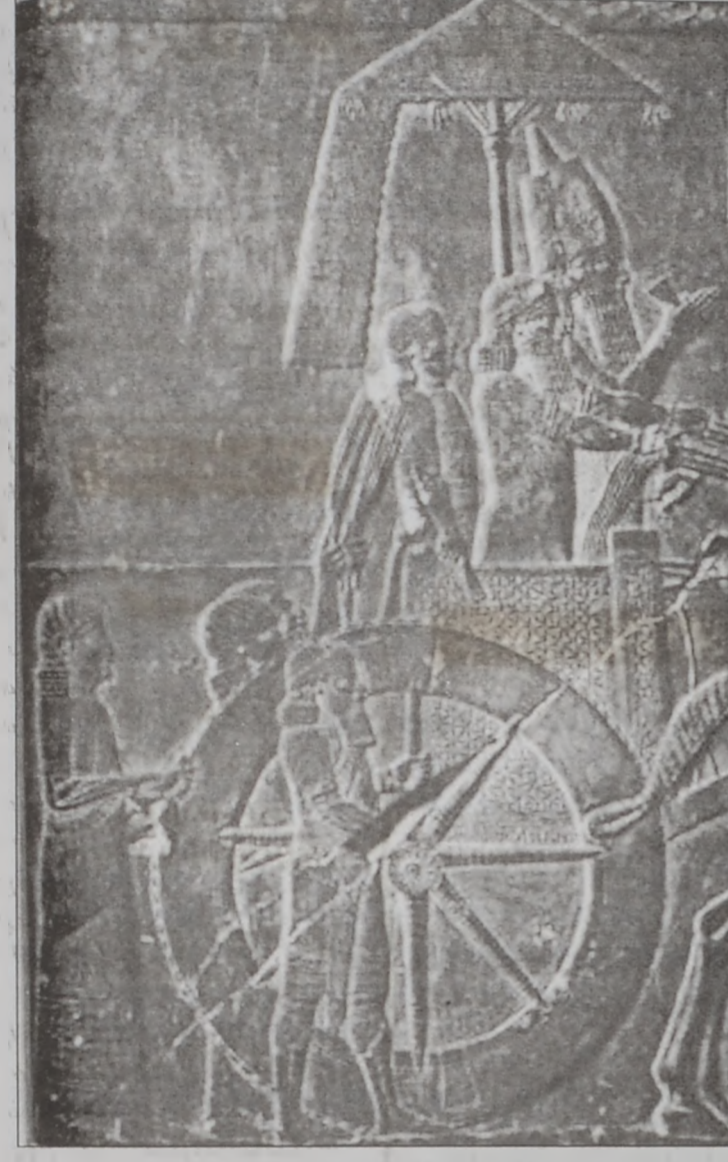
Ասորեստանի թագաւորը ձիակառքով տեղափոխութեան ընթացքին

Հին քաղաքակրթութեան օրրաններէն է եւ անոր պատմութեան արմատները կ'երկարին մօտաւորապէս եօթը հազար տարի առաջ: Արդարեւ, Ն. Ք. հինգ հազարամեակ առաջ լեռնաբնակ ցեղ մը՝ սումերները (կամ շումեր), որոնք որսորդներ էին, դաշտերը իջնելով հակալիւս հաստատեցին Եփրատի եւ Տիգրիսի գետային ուղիներուն վրայ, ջրանցքներ կառուցեցին եւ ոռոգովի երկրագործութիւնը զարգացուցին՝ մշակելով ցորեն, գարի, բանջարեղէններ եւ արմաւ: Անոնք հետզհետէ արեւի տակ չորացած ցեղով բնակարաններ եւ իրարմէ անջատ բնակավայրեր կառուցեցին. այսպէսով այնուհետեւ ժողովուրդներ, հաւաքականութիւններ իրենց բնակավայրին անոնով ճանջուցեցան, ինչպէս հետագային բարեկեցիք՝ Բաբելոնի անունով, ասորեստանցիք՝ Աշուրի անունով եւ այլն: Սումերներ գտան նաեւ բուրդ մանելու եւ կերպաս հիւսելու կերպը: