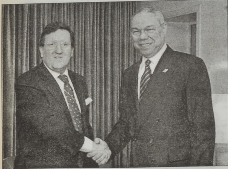
Ռոպրթըն և Փաուրլ

Երոպական Միությունը Իրաքի վերաշինութեան գործընթացին պիտի մասնակցի՝ եթէ այդ գործընթացը լիարժեք կ'ըլլայ ՄԱԿի որոշումով մը, յայտարարեց Յունաստանի արտաքին գործոց նախարար ձորձ Փափաստրէն: