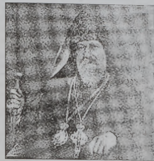
Նաչի արք. Աղապահեան

Առաջին Աշխարհամարտին, Կիլիկիոյ հայութեան հետ Աղապահները տարագրուեցան ղէպի արարական անպատներ, ուր անոնցմէլ շատեր զոհուեցան. պատերազմի կրեցքը նաեւ ստանձնեց, 1919ին անոնք վերադարձան իրենց բնակավայրերը: Անտոլուի մէջ ծայր առած քեմալական շարժումը 1920ի առաջին ամիսներուն սկսաւ սպառնալ Կիլիկիոյ հայութեան: Այդ օրերուն Սամուէլ Աղապահներ (ծնած 1894ին, Վահ-