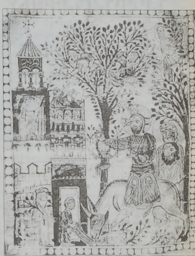
Գործ ոգուն ու աւանդներին հաւատարիմ մնացին:

Անիի գաղթականութիւնն ու նրանց սերունդներն ուր էլ որ գնացին, իրենց հետ տարան գեղակերտ Անիի յուշը եւ ամէնուր իրենց ծննդավայրի ստեղծա-