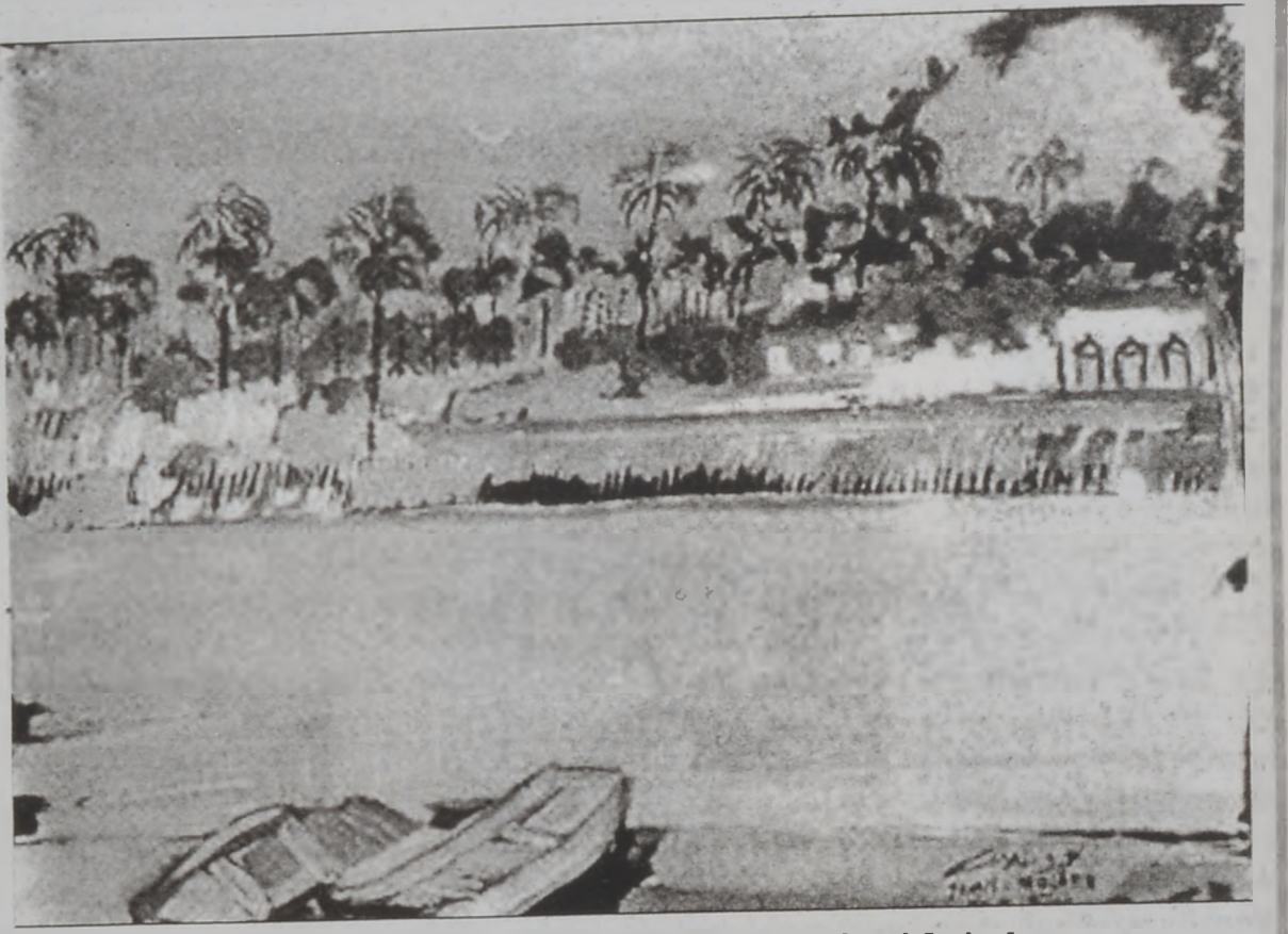
Յուցարկութեան դրուած գեղանկարներն օրինակ մը

Մինչեւ 26 Մարտ «Այ Մատինա» թատերասրահին մէջ տեղի ունեցող իրաքեան մշակութային շարժումն ծիրան ներս կը ցուցադրուի լիբանանցի արուեստագէտ ժեմիլ Մալախի գործերուն մէջ հաւաքածու, որ կ'ընդգրկի կուրաշով աշխատանքն ու տասնհինգ գեղանկարներ: Յուցահանդէսը կը կրէ «Մուշէհէտէթ մըն իրաք» խորագիրը: