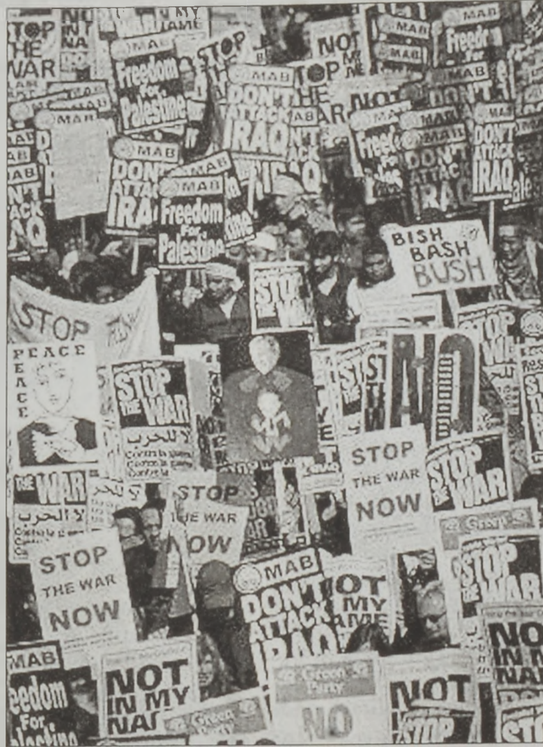
Լոնտոնի աճապարհաց ցոյցէն տեսարան մը

Տարբեր քաղաքներու մէջ, ինչպէս՝ Լահոր, Փաքիստան, 100,000 ցուցարարներ, ձաքարթայի մէջ՝ 1,500, Պարսելունայի