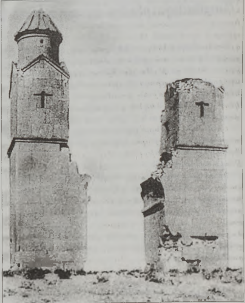
ցու նուիրական սրբութիւններն ամփոփող սրբավայր:

1001 թուականին, Քրիստոսի ծննդեան 1000ամեակին, հայոց մայրաքաղաքում աւարտուում է թագաւորաշէն երկու հսկայ եկեղեցիներ՝ Մայր տաճարի եւ Գագկաշէն Ս. Գրիգորի կառուցումը: Այդ նոյն ժամանակ Սարգիս Սեւանցիի կաթողիկոսը Անիում կառուցում է Ս. Զորիսի մեծանշան կոյսերին նուիրուած եկեղեցի եւ մեծ շուքով վաղաքապատի վկայարաններից այստեղ փոխադրում սուրբ կոյսերի մասունքների մի մասը: Այս դէպքը ցոյց է տալիս, որ կաթողիկոսն Անին ուզում էր տեսնել ոչ միայն որպէս եկեղեցական վարչական կենտրոն, այլեւ հայոց եկեղեց-