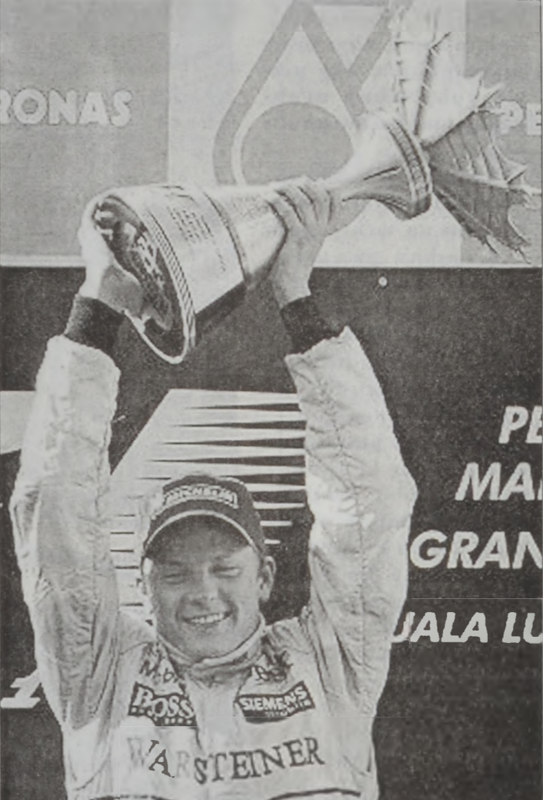
Քիմի Ռայքոնըն՝ իր շահած առաջին բաժակով

Ֆորմուլա 1ի 2003ի աշխարհի ախոյեանութեան 2րդ հանգրուանի կրան փրին, որ տեղի ունեցաւ երէկ՝ Սըփանկի մէջ (Մալայզիա), դարձաւ վերջ գտաւ Մաքլարընի տիրապետութեամբ, երբ խումբին երկրորդ վարորդը՝ Քիմի Ռայքոնըն այս անգամ ինք եղաւ տար կէտը գրաւողը, այսպիսով իր կազմին ապահովելով եղանակի 26րդ կէտը: Նշենք, թէ եղանակի առաջին կրան փրին տիրացած էր Մաքլարընի բրիտանացի վարորդ Տէյվիտ Քուլթարտ: Ռայքոնըն իր սպարէպին ընթացքին առաջին անգամ ըլլալով էր, որ կրան փրի մը կը շահէր: