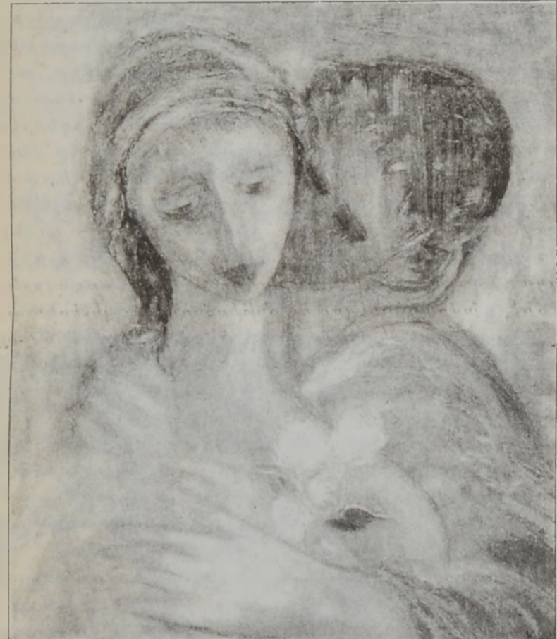
տած «կին»երը քնքուչ են պած են տիրող կացուարտաբնապէս ու թեան ու մերուած՝ շրջա-

Անիի բառացիորէն ողորուած էր եկեղեցիներով, որոնց բազմաթիւ վերասլաց, խաչազարդ գմբէթները ժամանակակիցների վրայ շլացուցիչ տպաւորութիւն են թողել: Եկեղեցիներ, մատուցներ եւ անգամ վանական համալիրներ կային նաեւ Անիի ձորերի քարաշէններում, ինչպէս եւ քաղաքային պարսպից դուրս գտնուող ընդարձակ արուարձաններում: Անիի կեանքում առանձնապատուկ տեղ է գրաւել Հոռոմոսի վանքը: Բաւական է նշել, որ մահից յետոյ այստեղ են հողին յանձնուել Բագարատունի թագաւորները՝ սկսած Աշոտ Ողորմածից մինչեւ Յովհաննէս Սմբատ: