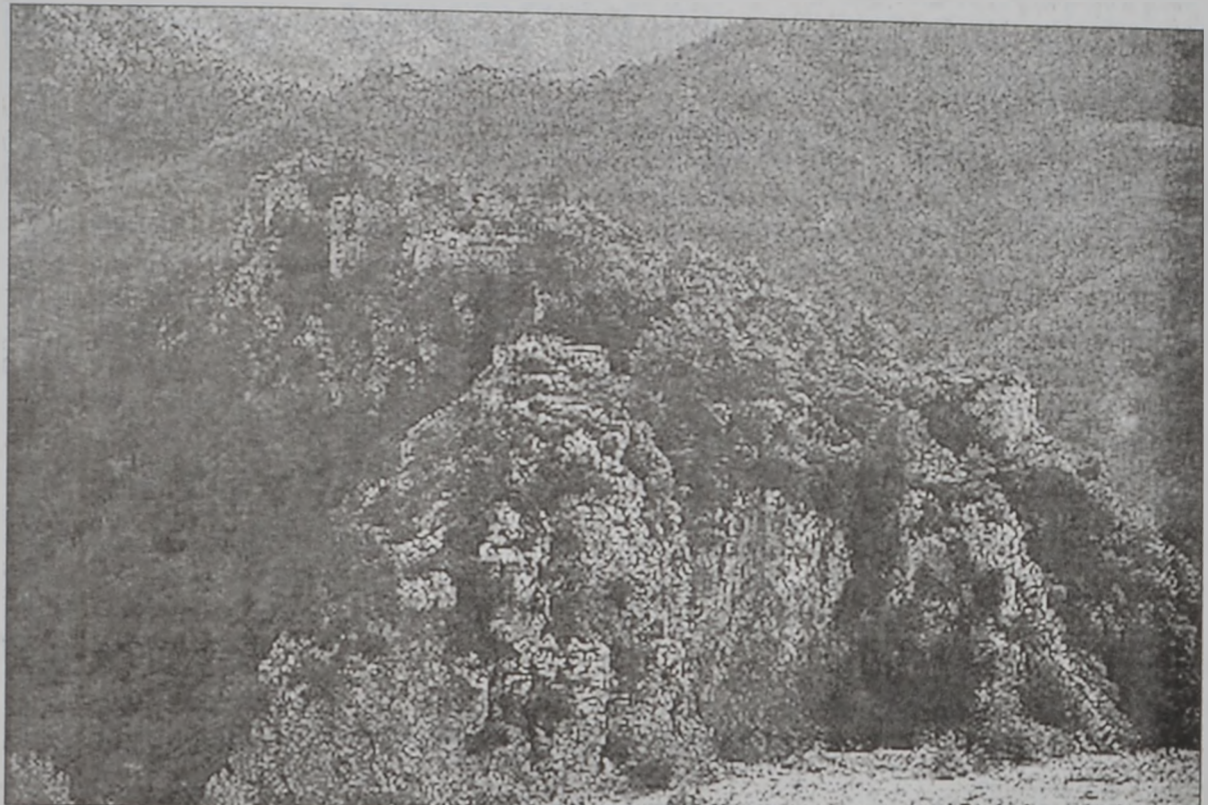
Սալրամա բերդին աւերակները լեռնային Կիլիկիոյ մէջ, գեղեցիկ բնութեան ծոցին