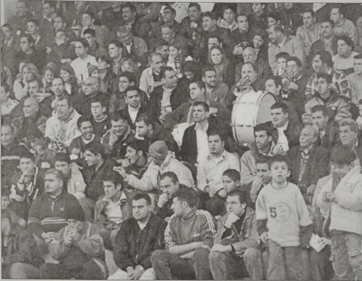
Հ.Մ.Ը.Մ.ի համակիրները, որոնք շեփորախումբի ընկերակցութեամբ կը քաջալերեն Հ.Մ.Ը.Մ.ի տղաքը

Հ.Մ.Ը.Մ.ի յաջորդ մրցակիցը պիտի ըլլայ Իծթիմահի (19րդ հանգրուան). մրցումը տեղի պիտի ունենայ յառաջիկայ Կիրակի, 16 Մարտին, Պուրա Համուտի Քաղաքապետարանի դաշտին