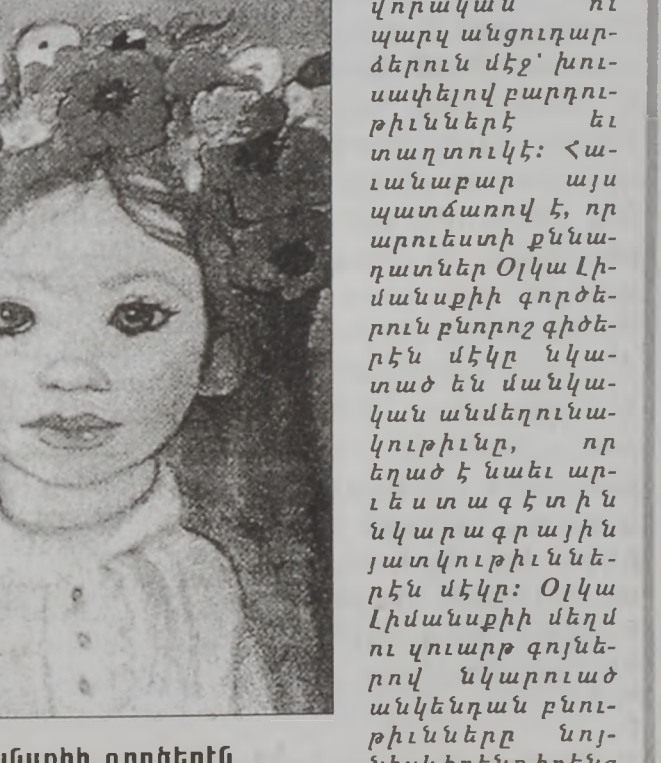
Օլկա Լիմանսքիի գործերն

Ռուս գեղանար- կարիչ Օլկա Լի- մանսպի ի ծննդեան 100ամե- ակին առիթով Պէրյուրի Մե- թիկեան համա- յարանի «Իսամ Ֆարես» սրահին մէջ 7 Մարտէն սկսեալ տեղի կ'ունենայ յոթե- նական ցուցա- ցանկէս մը: Հա- մալսարանին կողմէ կազմա- կերպուած այս ցուցացանիցը կը նպատակադրէ մեծարժէ 1922ին ի վեր Լիբանան հաստատուած արուեստագի- տուհին, որուն գեղանկարները իրենց ամբողջու- րեան մէջ կը յատ- կանշուին վաղ գոյներու պտղաբո- թեան ու կենսախնդ- րեանը: