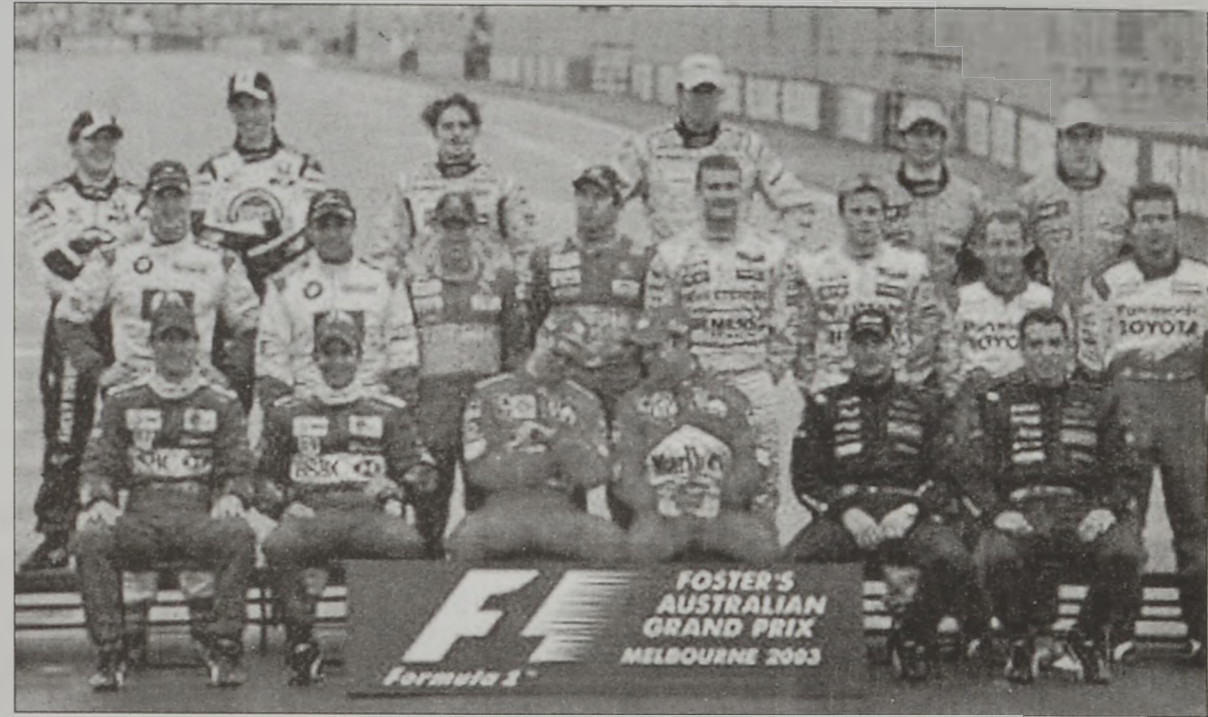
2003ի «Ֆորմուլա 1»ի վարորդները՝ յատուկ խմբակարգի մը ընթացքին

նարի 1 ժամ 34' 51" 5.- Եաննէ Թրուլի (Իտալիա) Ռընօ 1 ժամ 35' 20" 6.- Հայնց - Հերրլտ Ֆրենցըն (Գերմանիա) Սաուպըր 1 ժամ 35' 26" 7.- Ֆետնանտո Ալոնյօ (Սպանիա) Ռընօ 1 ժամ 35' 27" 8.- Ռալֆ Շումպլըր (Գերմանիա) Ուիլիըմ 1 ժամ 35' 27"