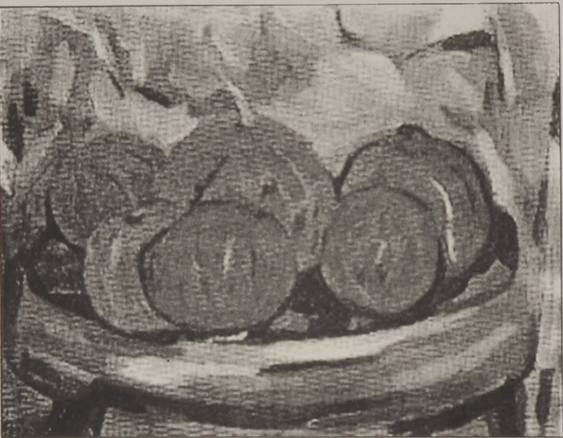
Լիւսի Թիւթիւնձեանի գործերն