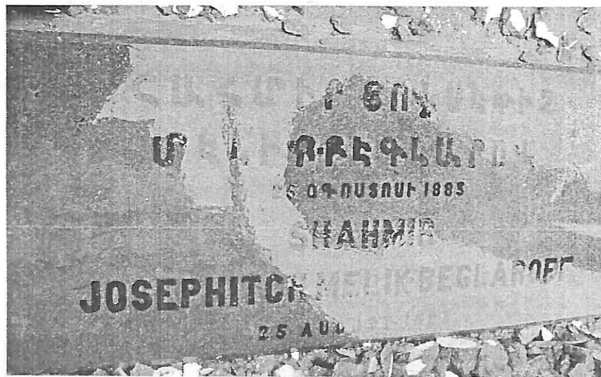
Ակ. 5 Ծահմիր Մելիք-Բեգլարեանցնի տապանաքարը