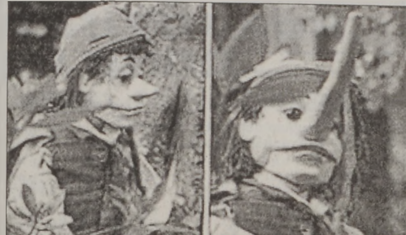
Մարդիկ սխալ նշաններ կը փնտռեն, երբ կ'ուզեն ստախոսութիւնը նկատել: (Նկարը՝ Պի. Պի. Սի.)

«Ուղեղային մատնահետքերու» թեքումը կը գործէ ուղեղին մէջ ելեկտրական գործունէութեան չափազանց արագ փոփոխութիւններ չափելով եւ ուսումնասիրելով, երբ անիկա կը հակադարձէ բանի՛ մը, գործ