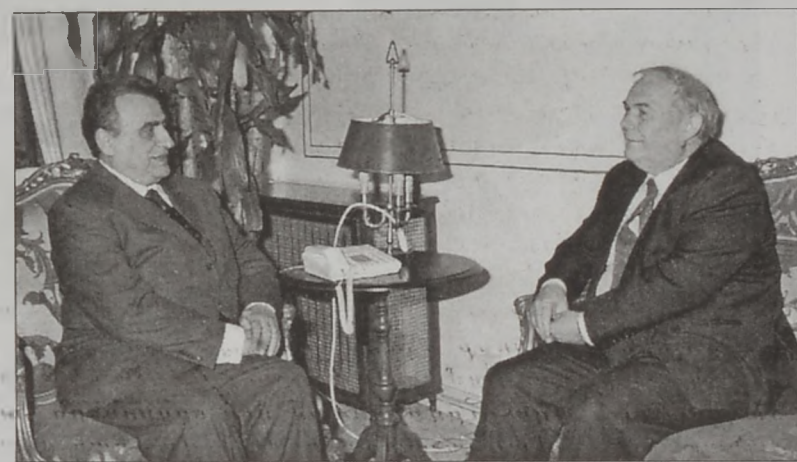
Համմուտ եւ Քիւնըն

Արտաքին գործոց եւ արտերկրի իրաւանցիներու հարցերու նախարար Մահմուտ Համմուտ երկհ հեռաձայնային հաղորդակցութիւն մը ունեցաւ սուրիացի իր պաշտօնակիցին՝ Ֆարուք Շարէհի հետ: Արաբական Լիկայի ընդհանուր քարտուղար Ամր Մուսայի հետ: