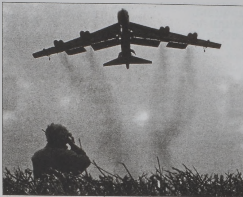
Ամերիկեան օդուժի «Պի. 52» օդանաւը կը հասնի Ծոցի շրջան

որ Իրաքը «ազատագրողները» ջերմ ընդունելութեան պիտի չարժանանան, եթէ անմիջապէս անդհովն ու այլ օժանդակութիւն չտրամադրեն իրաքի ժողովուրդին: