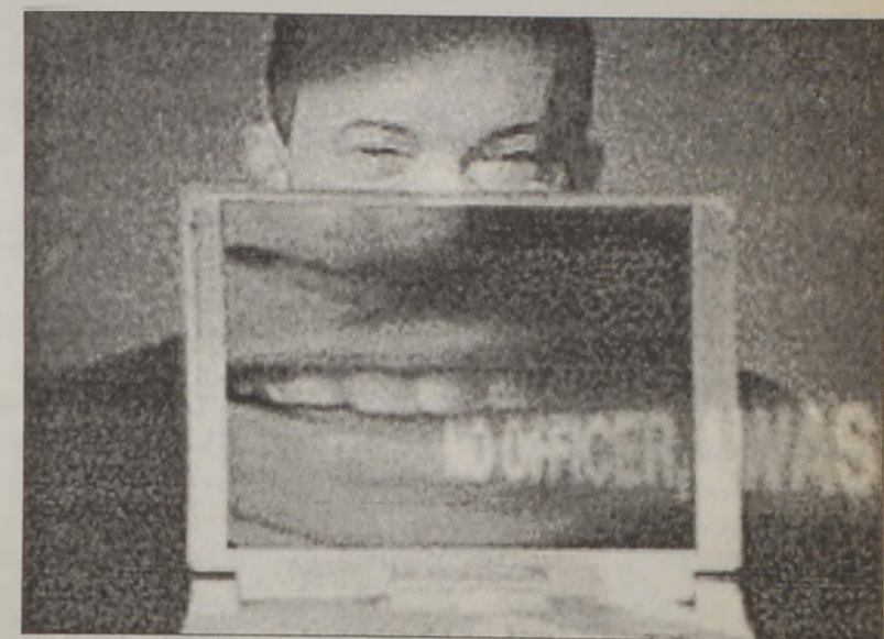
Մարդկային ձայնի մէջ չնչին, գրեթէ չնշմարտող փոփոխութիւններ արդեօ՞ք ստախոսութեան ցուցանիշ են:

Մ. Նահանգներու մէջ օրէնքներու կիրարկումին հսկող գործակալութիւններ հետզհետէ աւելի կ'օգտագործեն արհեստագիտութիւն մը, որ կը չափէ «ձայնի սթրէս»ը, այսինքն՝ մարդկային ձայնին մէջ շատ փոքր փոփոխութիւններ, որոնք ենթադրաբար կ'արձանագրուին, երբ անձ մը կը ստէ: