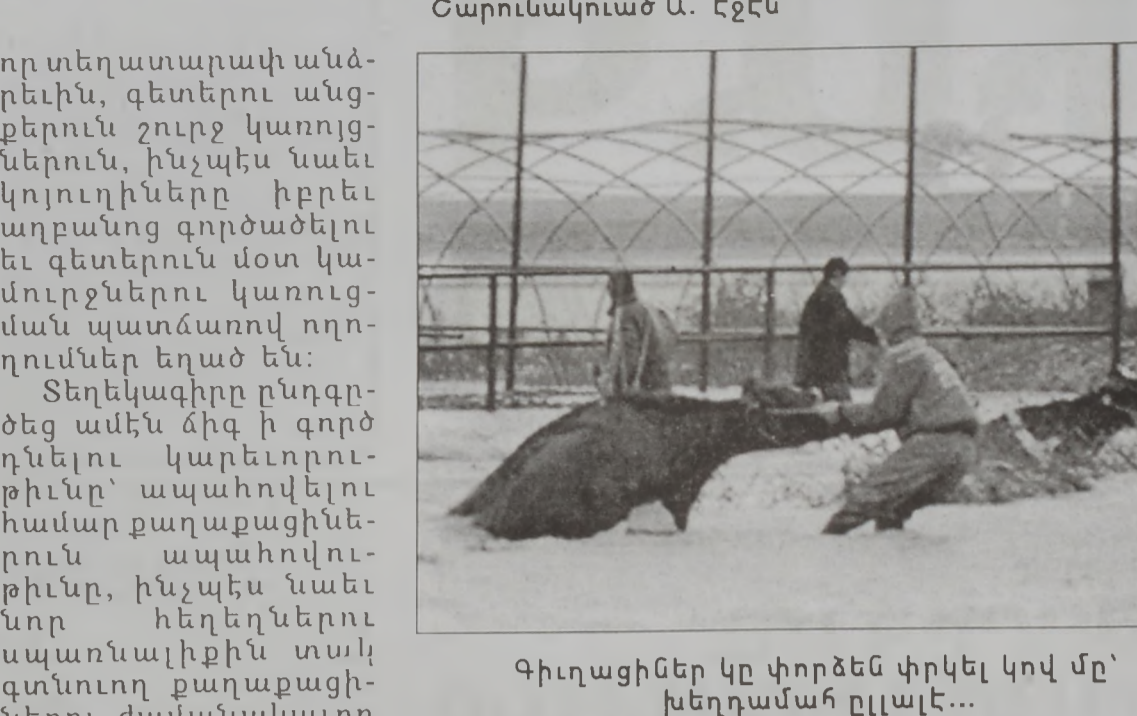
Գիւղացիներ կը փորձեն փրկել կով մը՝ խեղդամահ ըլլալէ...