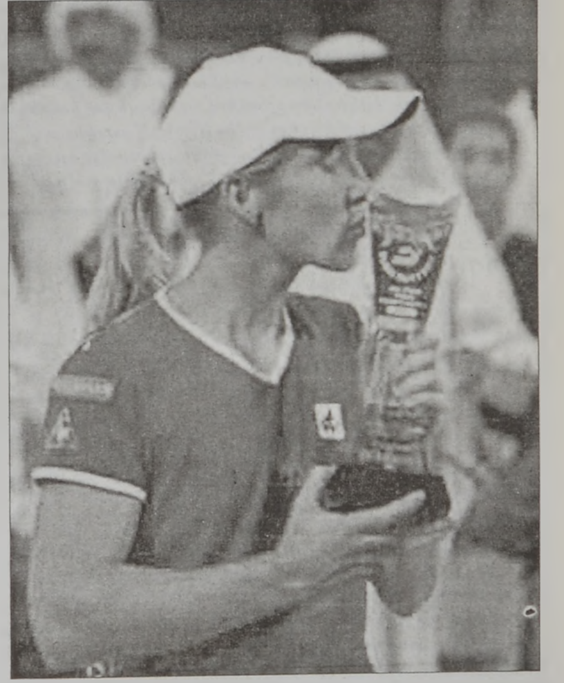
ՀԵՆԻՆ՝ իր շահած տիտղոսով

Տուայի մէջ տեղի ունեցող նոյնանուն մրցաշարին աւարտական մրցումին, թիւ 1 դասուած (մրցաշարին գծով) պելճիքացի Ճասթին Հենին - Հարտէն տիրացաւ տիտղոսին, երբ 4-6, 7-6 եւ 7-5 արդիւնքով պարտութեան մատնեց 4րդ դասուած ամերիկացի իր մրցակիցը՝ Մոնիքա Սէլէշը: