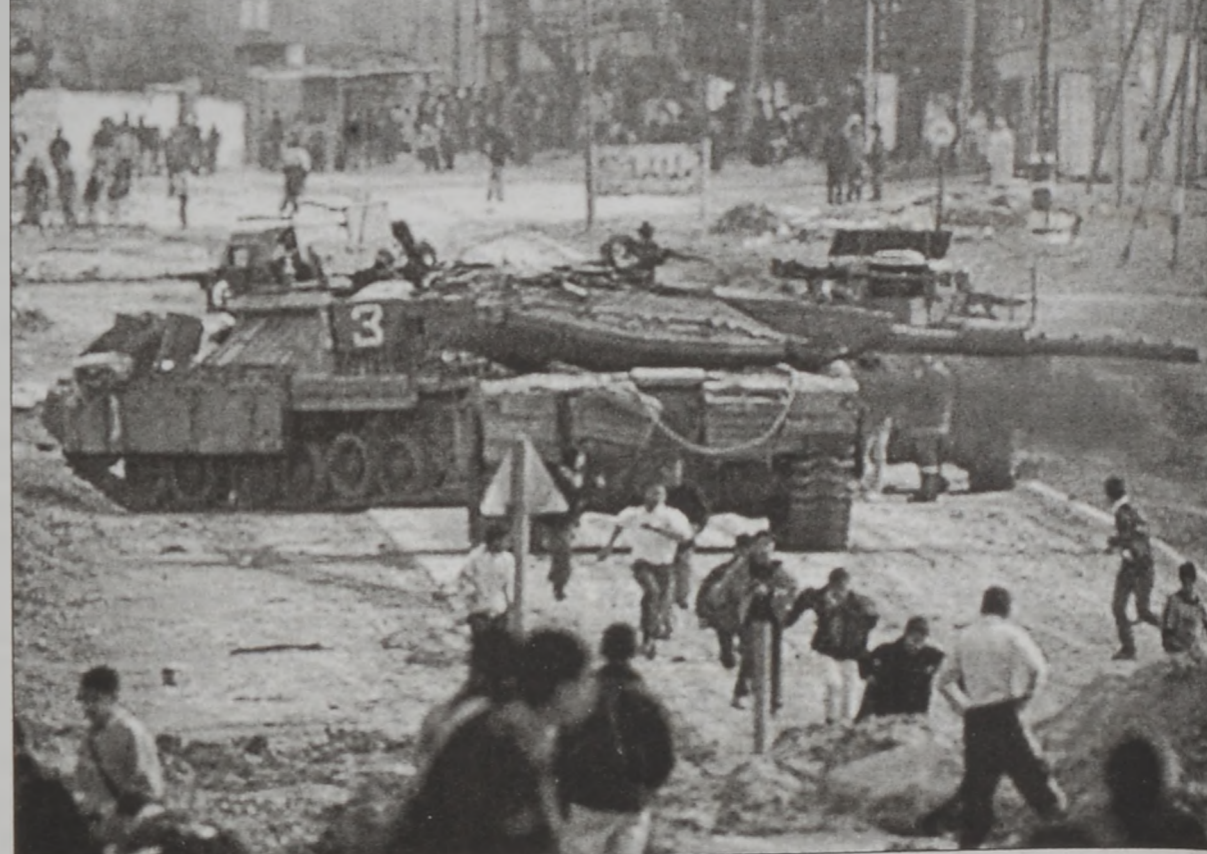
Պաղեստինցիներ խոյս կու տան իսրայէլացի զինուորացիներու կրակոցներէն

որ կը նկատուի բանբերը պաղեստինեան հողերուն վրայ ապրող հրեաներուն: Կուսակցութեան ղեկավար Էֆի Էրամ ըսաւ, որ Լիքուտ համաձայնեցաւ, որ հրեական բնակեցման վայրերը պիտի ընդարձակուին՝ ըստ բնակչութեան բնական աճին: Էրամ աւելցոց, որ իր կուսակցութիւնը յօժարեցաւ մասնակցիլ կառավարութեան, որովհետեւ յիշեալ կառավարութեան ապագայի ծրագիրներուն մէջ որեւէ նշում չկայ պաղեստինեան պետութեան, ոչ ալ՝ խաղաղութեան քառակուսի տուալաւ, որ Այզաւի կրօնական կուսակցութեան վերապահուած է իրաւունքը ամէն միջոցներով դէմ դնելու պաղեստինեան պետութեան մը ստեղծումի առաջարկող ծրագիրներուն: