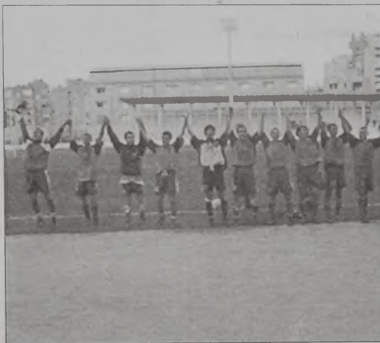
Հ.Մ.Ը.Մ.ի մարզիկները, որոնք մրցումէն ետք կ'ողջունեն իրենց համակիրները

Մրցումին երկու կողմին ալ սքանչելի էին: Հ.Մ.Ը.Մ. կողի քա-