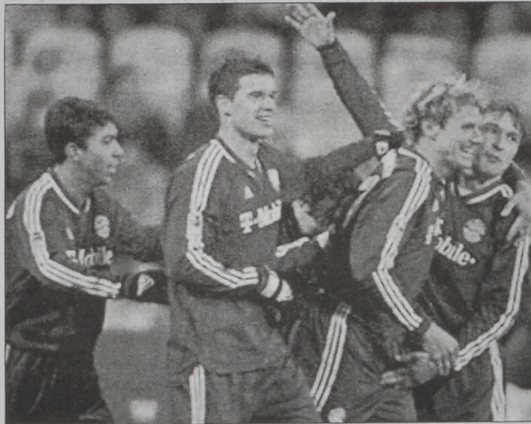
Պայերնի մարզիկները կը տօնեն իրենց յաղթանակը

ին մէկը եղաւ ինչպէս միշտ, Միւնիխ քաղաքի տերափին՝ 1860 Միւնիխի եւ Պայերն Միւնիխի միջեւ: Պարագլուխի դիր-