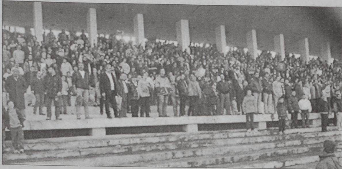
Հ.Մ.Ը.Մ.ի համակիրներէն մաս մը

Յարդ անպարտելի միակ խումբը՝ Հ.Մ.Ը.Մ., որ իր արձանագրած այս յաղթանակէն ետք 35ի բարձրացուց այս եղանակին իր կէտերուն ընդհանուր հաշիւը, երէկւան մրցումին սկիզբէն մինչեւ աւարտը պայքարեցաւ մրցակից խումբին՝ եւ ... ցեղին դէմ՝ նկատուեանայով, որ դաշտին վիճակը այնքան ալ քաջալերական չէր: Մրցումին 25րդ