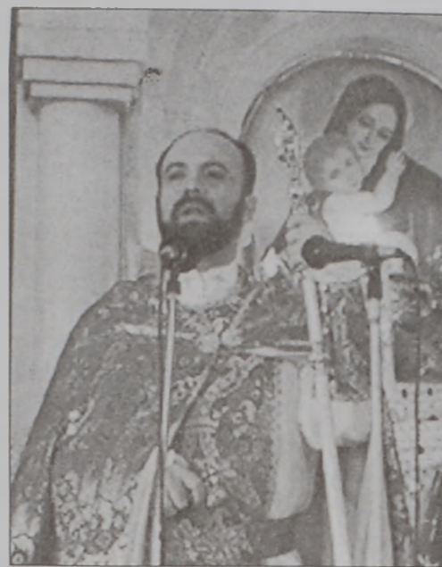
Սրբազան հայրը իր քարոզից պահուն

Գ ե ղ ա մ սրբազան առաւօտեան ժամը 9:00ին դիմաւորուեցաւ