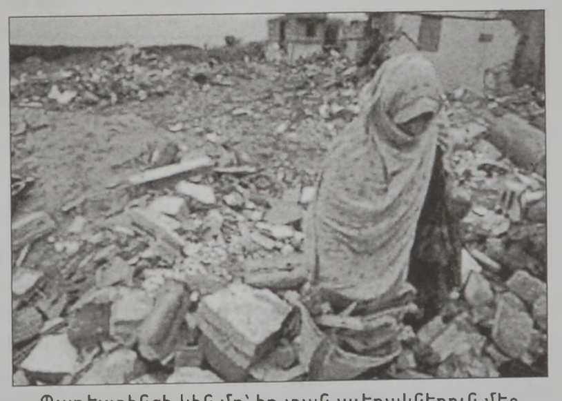
Պաղեստինցի կին մը՝ իր տան ավերակներուն մէջ էր, որ պաղեստինեան շրջաններուն շրջափակումը կու՛մը հաստատ պիտի մնայ անորոշ ժամանակուան մը համար, իբրեւ հակադարձութիւն պաղեստինեան շարժակումներուն, որոնք թափ ստացած են վերջերս: Կաշար.ը՝ էջ 9

Իսրայէլ որոշեց անորոշ ժամանակուան համար փակ պահել պաղեստինեան շրջանները, իբրեւ հակադարձութիւն պաղեստինեան գործողութեան մը, որուն թիրաք դարձած էր իսրայէլեան հրատայ մը: Միեւնոյն ատեն սակայն, իսրայէլ արտօնութիւն տուաւ պաղեստինեան պատուիրակութեան մը Լոնտոն մեկնելու, ուր բանակցութիւններ պիտի ունենայ իսրայէլեան պատուիրակութեան մը հետ: Իսրայէլեան բանակին մէկ բանբերը Շաբաթ երեկոյեան յայտարարած էր, որ պաղեստինեան շրջաններուն շրջափակումը կու՛մը հաստատ պիտի մնայ անորոշ ժամանակուան մը համար, իբրեւ