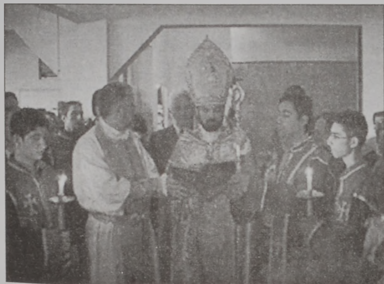
Մատաղի օրհնութիւն (Լուսանկարները՝ Սթիտիօ ԱՇՆԱԿԻ)

Հ.Մ.Ը.Մ. Պուրճ Համուտ մասնաճիւղի սկստներուն եւ Հ.Մ.Ը.Մ.ի շեփորահունքին կողմէ, որ հնչեցուց Հայաստանի եւ Լիբանանի քայլերգները: «Արագած» սկստներին մէջ տեղի ունեցած ընդունելութիւնը սրբազան հայրը ուղղուեցաւ եկեղեցի, որուն մուտքին կատարուեցաւ ոչխարի պէտում: