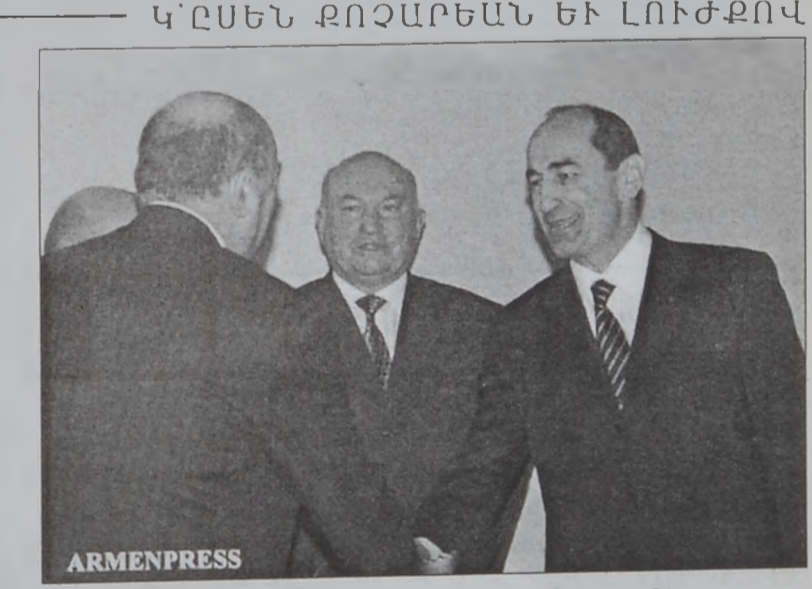
Նախագահ Ռ. Քոչարեան կ'ընդունի Մոսկուայի քաղաքապետը ռուսական կողմը պատրաստ է այդ փորձառութիւնը բաժնել Հայկական կողմին հետ: Քոչարեան եւ Լուժնովի յատկապէս անդրադարձան Երեւանի եւ Մոսկուայի միջեւ առեւտրային կապերի հարցին: Էջ 9

Հայաստանի նախագահ Ռոպէրթ Քոչարեան երէկ ընդունեց պաշտօնական այցելութեամբ մը Հայաստան գտնուող Մոսկուայի քաղաքապետ Եւրի Լուժնովի գլխավորած պատուիրակութիւնը: Ողջունելով ռուսական պատուիրակութիւնը՝ նախագահ Քոչարեան շեշտեց Հայ եւ ռուսական երկկողմանի յարաբերութիւններուն զարգացման մէջ երկու մայրաքաղաքներուն համագործակցութիւնը: Նշելով, որ քաղաքային տնտեսութեան կառավարման մէջ Մոսկուա մեծ փորձառութիւն ունի՝ Լուժնովի ըսաւ, որ