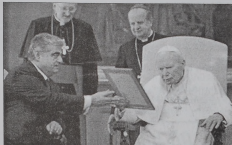
Վարչապետ Հարիրի պապից կը յարգանքներ արտայայտէր:

Վարչապետ Ռաֆիք Հարիրի երէկ Վատիկանի մէջ ընդունուեցաւ Յովհաննէս - Պօղոս Բ. պապին կողմէ: Հանդիպումին Վատիկանի բարձրաստիճան պաշտօնատարներու ներկայութեան վարչապետ Հարիրի եւ Յովհաննէս Պօղոս Բ. պապ քննարկեցին Միջին Արեւելքի զարգացումները, յատկապէս պաղեստինեան տագնապը եւ Իրաքի հարցը: Քննարկումի առարկայ դարձան նաեւ Լիբանան - Վատիկան երկկողմանի յարաբերութիւնները: Վարչապետ Հարիրի եւ պապը ունեցան ընդհանրական հանդիպում մը, որ տեւեց 20 վայրկեան: