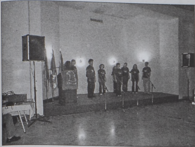
«Աղբալեան» պատահեկան միութեան խումբ մը պատահեցեր կ'ասմունքներ

Կազմակերպութեամբ Հ. Յ. Լեւոնի «Հայաստան» մասնաճիւղին, Ուրբաթ, 31 Յունուար երեկոյեան ժամը 8:00ին, «Աղբալեան» ակումբին մէջ տեղի ունեցաւ Արցախեան պայքարի 15ամեակին նուիրուած ձեռնարկ մը: