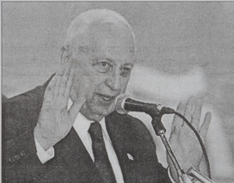
Շարոն ամէն գնով պիտի փորձէ Իսրայէլի քաղաքական բոլոր հոսանքները մեղսակից դարձնել իր ոճիրներուն դեմ: Այսինքն, իր օգնութեամբ, Շարոնը կը փորձէ անհրաժեշտ դարձնել իր օգնութեան ծրարը: Էջ 2

Իսրայէլի վարչապետ Արիէլ Շարոն երէկ բանակցութիւններու սկսաւ կեդրոնի աջ ոչ կրօնական Շիւնուի Կուսակցութեան հետ՝ վայն համոզելու որպէսզի մաս կազմէ կառավարութեան: