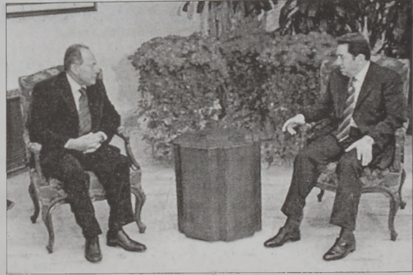
Զօր. Լահուտ կ'ընդունի երեսփոխան Լարպը

Նախագահ Լահուտ վերահաստատեց, որ ներկայ Հանգրուանը պայթուցիկ է եւ իւրաքանչիւր անհատ պէտք է զգուշանայ: Ան աւելցուց, որ արքայ ժողովուրդները պէտք է կոչ ուղղեն համարաբար կանգնուած լինելու միասնականութեան, որովհետեւ անոնք անհրաժեշտութիւն են, շրջանին ժողովուրդները կը փրկեն խոտորանի գարգացումներէ եւ իրաքը կը գործընդհանրէ իր դէմ ուղղուած պատերազմը: