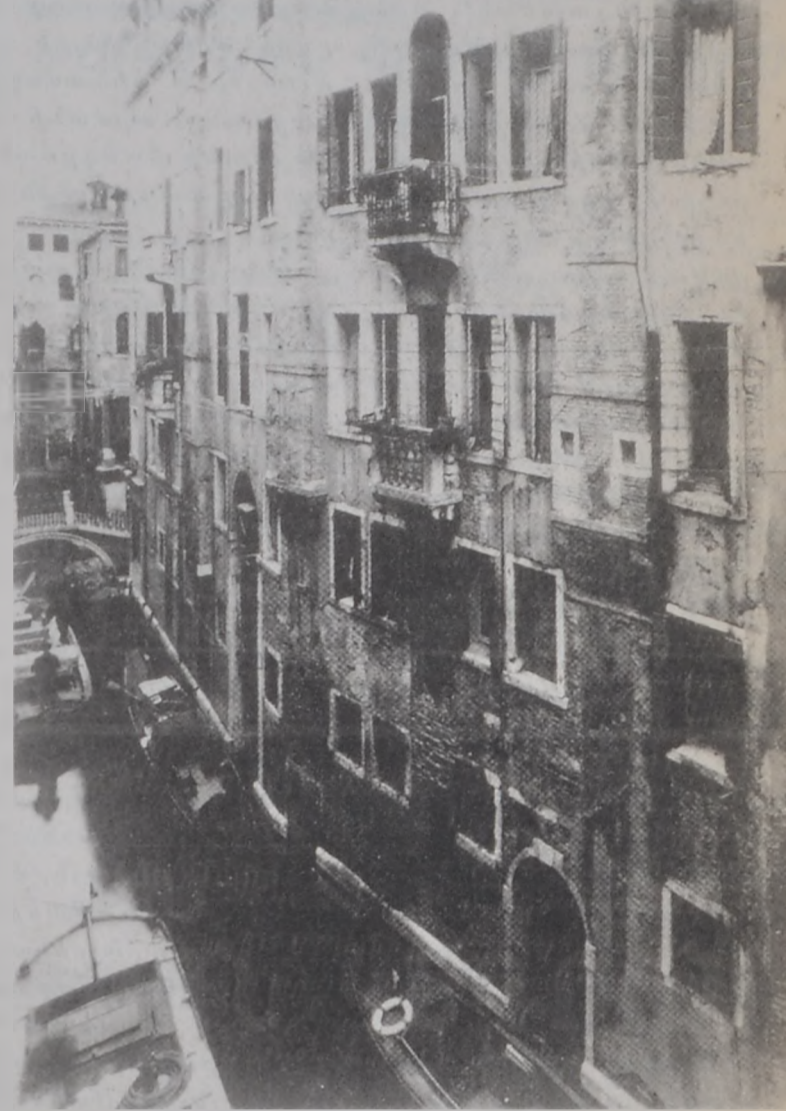
Վենետիկ. Ֆերալի քրանցը եւ Հայոց Տունը

Սպանիա, Ֆրանսա, գերմանական իշխանութիւններ, պապը, հունգարներ սաւուռացիք եւ Ֆերրարա 1508ին մեծ պատերազմի ձեռնարկեցին Վենետիկի դէմ, որ ծանր պարտութիւն կրեց Ակնատելլոյ ճակատամարտին: Պատերազմական վիճակին բերումով Արեւելքի եւ Արեւմուտքի ճամբաները անապահով դարձան, եւ Վենետիկ, Արեւելքի շուկաները կորսնցուցած ըլլալով եւ Արեւմուտքի մէջ ալ նոր հողեր նուաճելու հնարաւորութենէն զրկուած ըլլալով, տնտեսական նեղ կացութեան մատուցեցաւ: Այնուհետեւ Վենետիկ իր ամրոցը ուժը կեդրոնացուց թուրքերուն դէպի Արեւմուտք յառաջխաղացքը կասեցնելու համար: