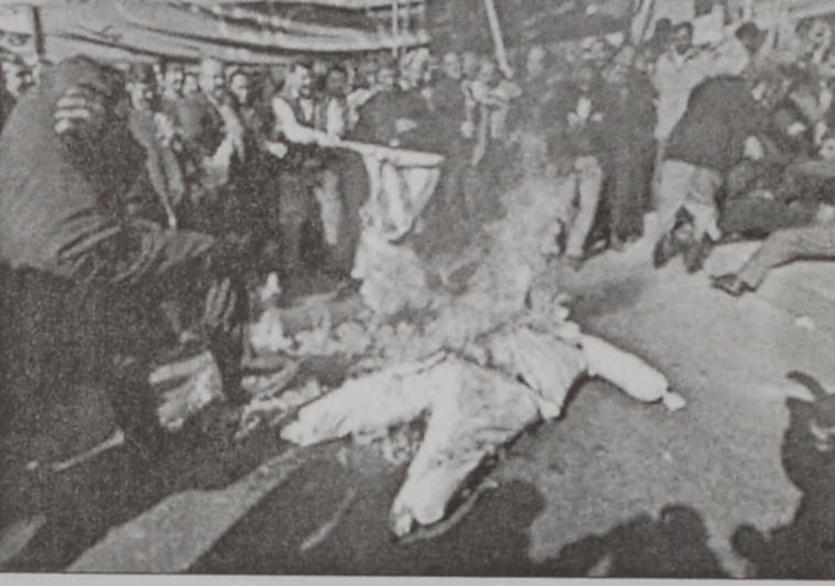
Իրաքցիներ կ'այրեն Պուշի խրտուիլակը

ՄԱԿԻ ՎԵՆԵՐՈՒ ԳԼԽԱՐՔ ԲՆՆԻՅ ՀԱՆՍ ՊԻՔՍ Երէկ Ապահովութեան Խորհուրդին յայտնեց, որ Իրաք մերժած է ապապիւնուելու միջապային ընտանիքին պահանջը: Ան նաեւ ըսաւ, որ Պաղտատ չէ ներկայացուցած բաւական ապացուցներ, որոնք կը փաստեն, որ Իրաք փճացուցած է իր հաւաքական քանդումի վեներուն պահեստները: