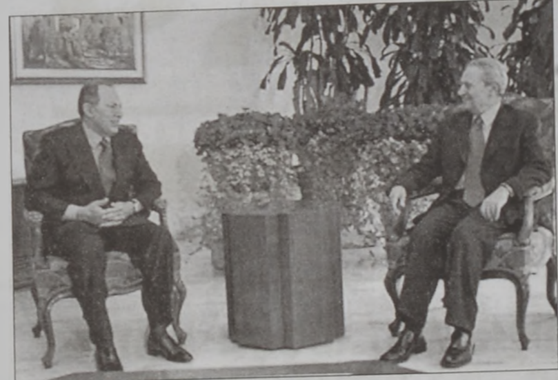
Շարիհ այցելեց գոր. Լահուտի

Նախագահ Կոր. Էմիլ Լահուտ երէկ Պապատայի մէջ ընդունեց Սուրիոյ արտաքին գործոց նախարար Ֆարուք Շարիհը, որ նախագահ Լահուտի փոխանցեց Սուրիոյ նախագահ Պաշշար Ասատէն բանաւոր պատգամ մը՝ Իրաքի հարցին արձանագրած վերջին պարագումներուն շուրջ: