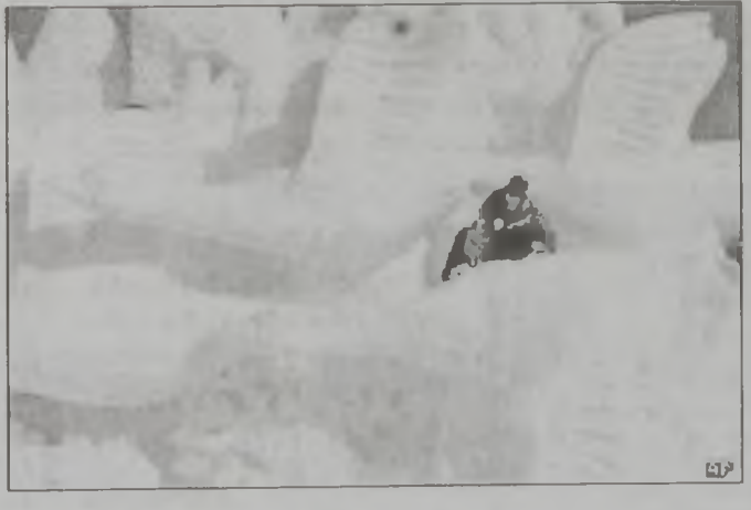
...Ոմանք ստիպուեցան սողալ իրենց հսկայական գլուխ գործոցներուն վրայ, մինչ ուրիշներ գրեթէ անշարժ կանգնած՝ բծախնդրորէն մանրամասնութիւններ քանդակեցին: