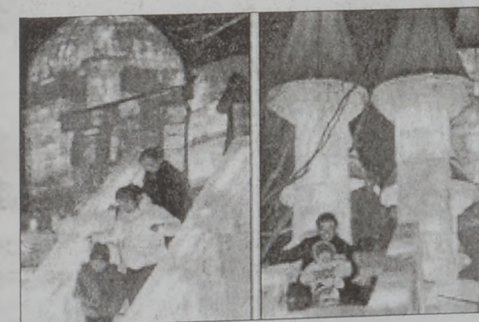
Զբօսաշրջիկներ եւ տեղացիներ շրջեցան սառոյց գիւղաւանին մէջ՝ Սառոյց Կանթրի Փառատօնին զարմանահարազ բանդակները տեսնելու համար: