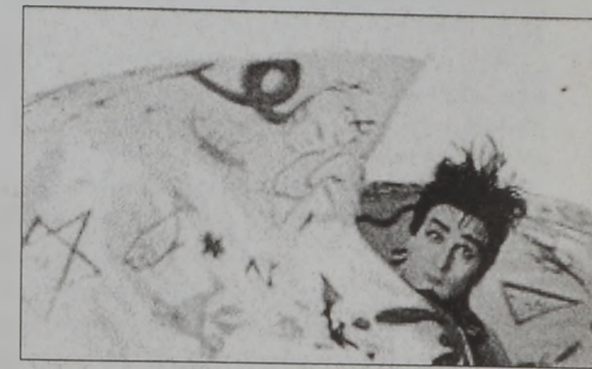
Թեւ արդիական, սակայն Ս. Ծնունդի ոգիով հարուստ...

ԱՆԳԼՈՅ ՊԱԼԵԻ ԱԶԳԱՅԻՆ ԽՈՒՄԸ ԽՆԴՐԱՅԱՐՈՅ ՆՈՐ ԲԵՍԱՂՈՒԹԵԱՄ ԵՐ ԿԸ ՆԵՐԿԱՅԱՑԵ ԶԱՅՈՎՍԵԻ ԸՈՉԱԿԱՒՈՐ «ՆԱԹԵՐԵԸ» ՊԱԼԵՆ, ՍԱԿԱՅՆ «ՊԻ. ՊԻ. ՍԻ.» Ի ԸՍՄԱԶԱՅՆ, ԱՆՈՐ ՈՒՄ ԿԸ ՄԱՅ ԱՆԱԳԱՐՏ