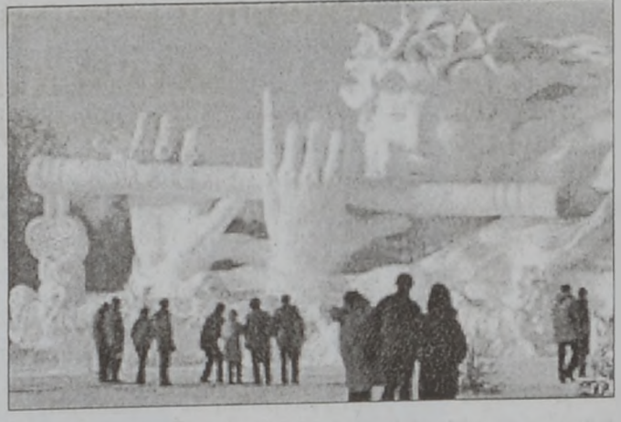
Այս տարի շուրջ 30 հազար խորամարդ մեթր սառոյց գործածուած է փառատօնին ընթացքին: