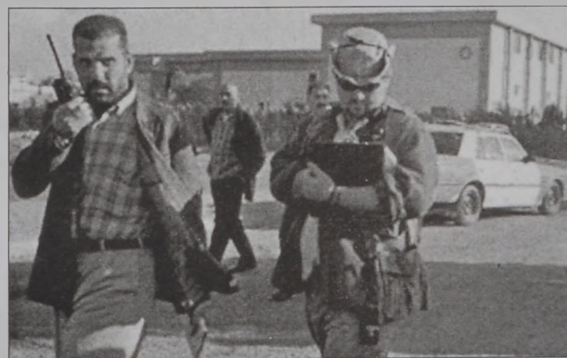
Իրաքի ոստիկան մը կ'ընկերակցի զէնքի քննիչներէն մէկուն

Պաղատա երէկ խիստ ոճով քննադատեց ՄԱԿի Ապահովութեան Խոր- հուրդն ու Միացեալ Նա- հանգները: Ապահովու- թեան Խորհուրդը քննա- դատուեցաւ թիւ 1454 բա- նաձեւին համար, որ կ'ըն- դարձակէ դէպի Իրաք արտածուելիք նիւթե- րուն ցանկը: «Պապիլ» օրաթերթը կը գրէր, որ Ապահովութեան Խոր- հուրդին որդեգրած բա- նաձեւը ընդունելի չէ, որովհետեւ այս հանգը- րանին, ՄԱԿէն կ'ակըն- կալուէր աշխատանք տա- նիլ ջնջելու համար բոլոր