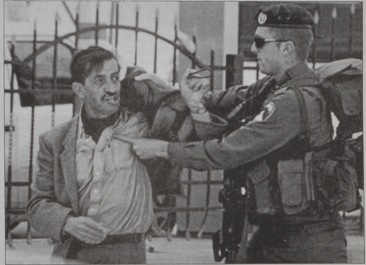
Պաղեստինցի մը եւ իսրայէլացի զինուորի մը միջեւ բռնցքամարտ՝ Արեւելեան Երուսաղէմի մէջ

Պաղեստինեան շրջաններուն Նոր Տարին բացուեցաւ բա- խումներով եւ արիւ- նայի միջադէպերով, որոնք նոր պոհեր ու վիրաւորներ պատճա- նեցին: