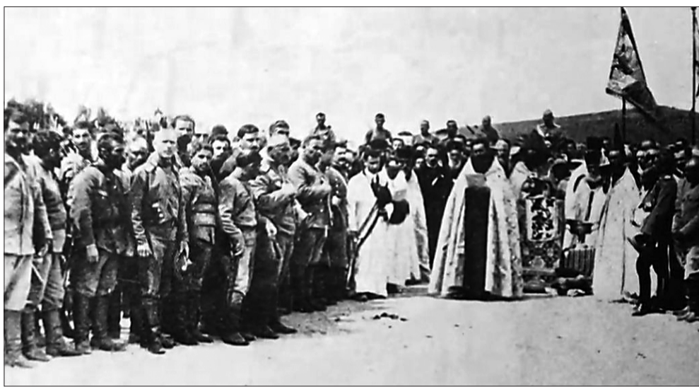
Հայոց զորքերի օրհնումը Սարդարապատի ճակատամարտից առաջ. 1918 թ.

Սարդարապատը միայն ռազմական հաղթանակ չէ, այն գոյաբանական ապստամբություն է և աստվածաշնչյան այն հրաշքի