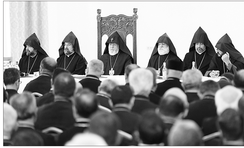
Հայտնեց ՀՀ իշխանությունների կողմից իրականացվող հակաեկեղեցական արշավի, անհիմն մեղադրանքներով եկեղեցականաց դեմ հավաքանքների, եկեղեցու ինքնավարությունը խաթարող միջամտությունների առնչությամբ: ➔ էջ 3

կարևոր ուղեցույցները, որոնք առավել արդյունավորեցին եկեղեցականների հոգևոր ծառայությունը: Այնուհետև եկեղեցականներին իր հայրական օրհնությունն ու պատգամը բերեց Ամենայն Հայոց Կաթողիկոսը՝ ավանդական դարձած քահանայից ժողովները պատեհ առիթ նկատելով Մայր Աթոռ Սուրբ Էջմիածնի խորհրդով գորանալու, աղթական մթնոլորտում միասնաբար խորհրդածելու Սուրբ Եկեղեցու հոգևոր առաքելության արդյունավորման շուրջ, այլև քննարկելու հոգևոր սպասավորության ճանապարհին տեղ գտնող խնդիրները, ինչպես և ժողովրդի ու հայրենիքի առջև ծառայած մարտահրավերների դիմագրավման ուղիները: Ապա անդրադառնալով աշխարհում տեղ գտած ցնցումներին ու հատկապես տարածաշրջանում պատերազմական գործողություններին, որոնք իրենց ուղղակի և անուղղակի ներգործությունն ունեցան մաս ազգային և հայրենակալ կյանքի վրա, Նորին Սրբությունը խոր մտահոգությամբ