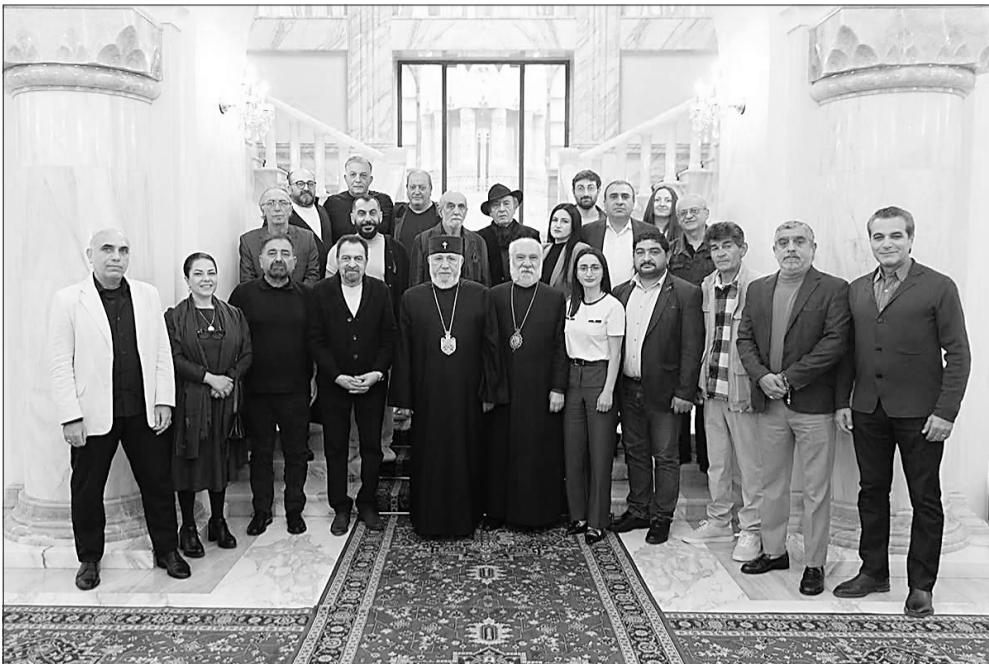
Մայիսի 16-ին Մշակույթի մի խումբ գործիչների

Ն. Ս. Օ. Տ. Տ. Գարեգին Երկրորդ Ծայրագույն Պատրիարք և Ամենայն Հայոց Կաթողիկոսն ընդունեց մշակույթի մի խումբ գործիչների, որոնք այցելել էին Մայր Աթոռ Սուրբ Էջմիածին՝ իրենց զորակցությունը, որդիական սերն ու հավատարմությունը հայտնելու Սուրբ Եկեղեցուն և Ամենայն Հայոց Հայրապետին: