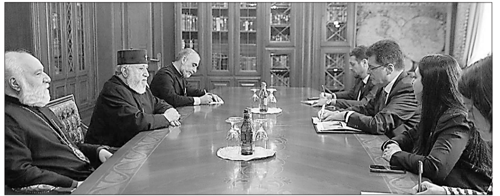
և թափանցիկ ընթացքի ապահովման, խության մթնոլորտի պահպանման անհանրային վստահության ու համերաշխությանը:

մարչիչին: Հանդիպման ընթացքում անդրադարձ կատարվեց Հայաստանում նախընտրական շրջանում առկա հասարակական-քաղաքական իրադրությանը, ընտրական գործընթացների խաղաղ