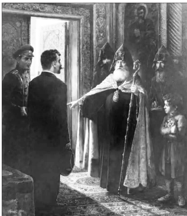
Ս. Հարությունյան, Վերջ Գողգոթային. Հաղթություն, 2018 թ.

Հուլիսի 6-ին Երևան ժամանեց հայոց նորաստեղծ Կառավարությունը, որին ողջունելու համար Գևորգ Ե-ն կազմեց Մայր Աթոռի պատվիրակություն՝ Հուսիկ արքեպիսկոպոս Մովսեսյանի գլխավորությամբ: Պաշտոնական ընդունելությունը տեղի ունեցավ հուլիսի 7-ին: Հուսիկ արքեպիսկոպոսը և խորեն