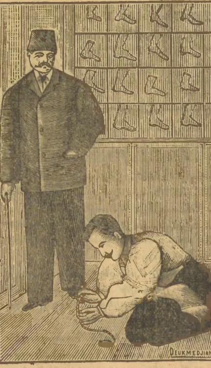
Կ. Պոլիս, Միքէէի, Համախէի փողոց, Ետտեղ ՕՔէլի կից, ԲՅՈՒՄԻՆԻ Կարին

Կ. Պոլիս, Միքէէի, Համախէի փողոց, Ետտեղ ՕՔէլի կից, ԲՅՈՒՄԻՆԻ Կա- ռին (Կախորդ Տուրուք Ուսումնարանի) դիմացը թիւ 12: