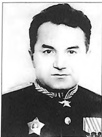
Сергей Худяков (Арменак Ханферянц) маршал авиации