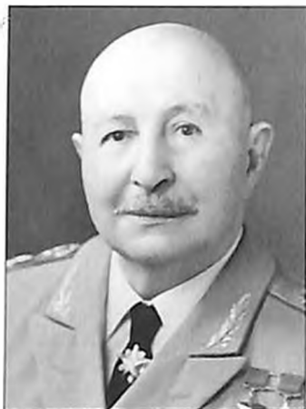
Иван Баграмян Маршал Советского Союза, дважды Герой Советского Союза,