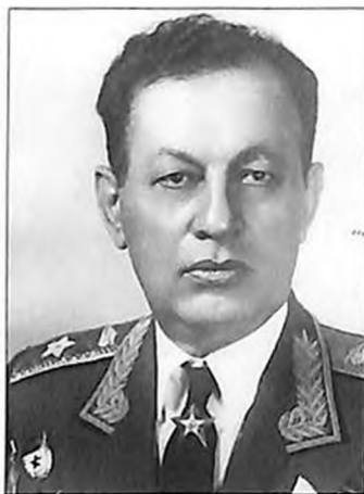
Амазасп Бабаджанян Главный маршал бронетанковых войск, Герой Советского Союза