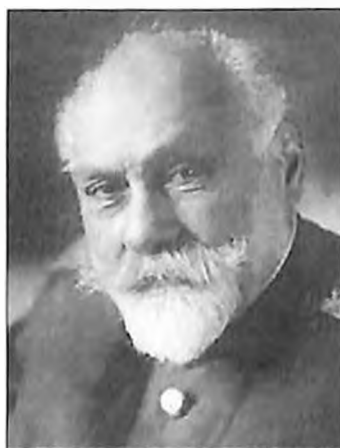
Левон Орбели (10.06.1945)