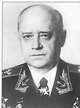
Иван Исаков (Тер-Исаакян) Адмирал флота Советского Союза, Герой Советского Союза