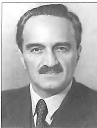
Анастас Микоян (30.09.1943)