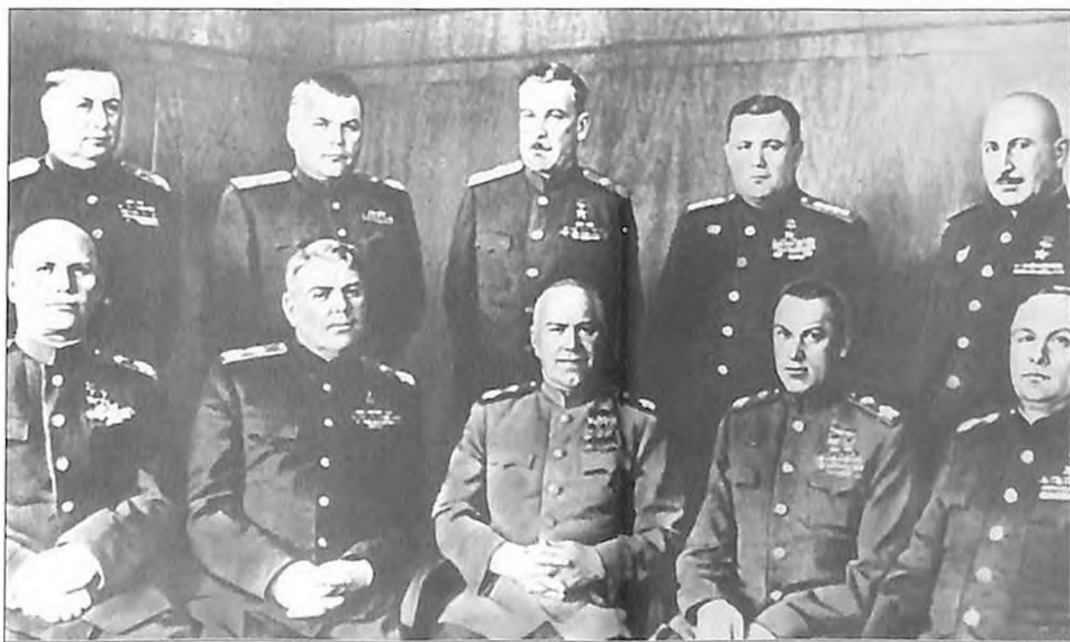
Маршалы Победы — командующие фронтами на завершающем этапе Великой Отечественной войны. Слева направо: И. С. Конев, А. М. Василевский, Г. К. Жуков, К. К. Рокоссовский, К. А. Мерецков. Стоят слева направо: Ф. И. Толбухин, Р. Я. Малиновский, Л. А. Говоров, А. И. Еременко, И. Х. Баграмян. Москва, июнь 1945.