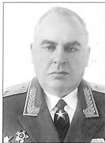
Сергей Аганов маршал инженерных войск