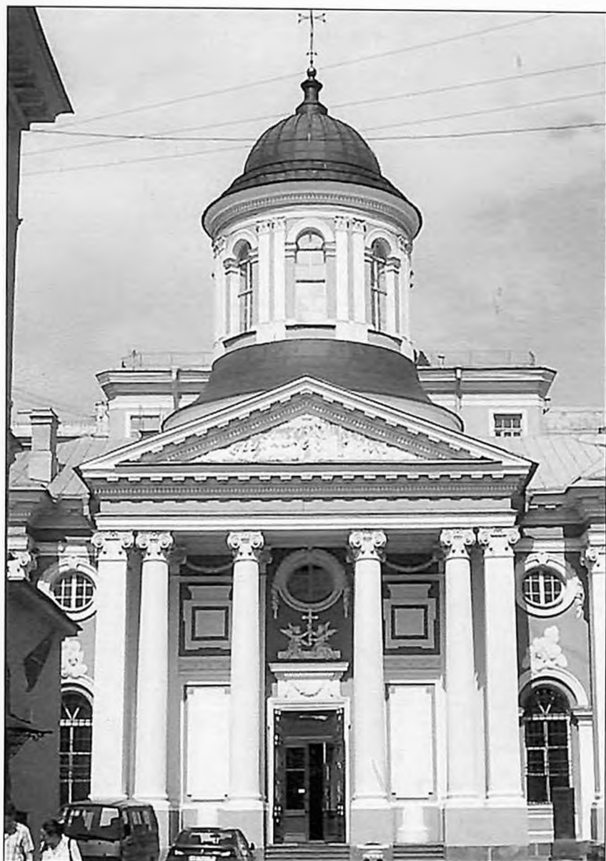
Армянская Апостольская церковь Св. Екатерины на Невском проспекте