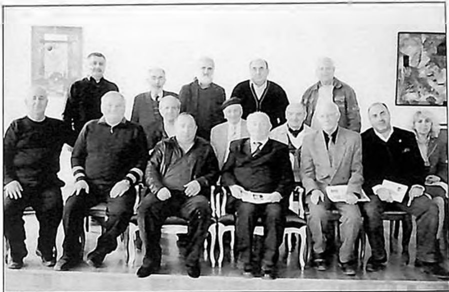
В армянской общине Санкт-Петербурга (25.11.2013 г.)