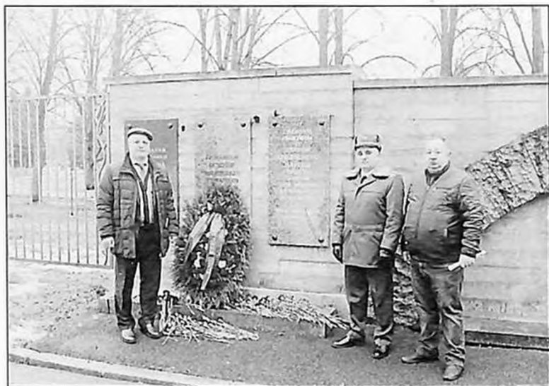
На Пискаревском кладбище. 27.01.2018 г.