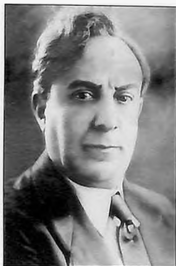
Ваграм Папазян, народный артист СССР