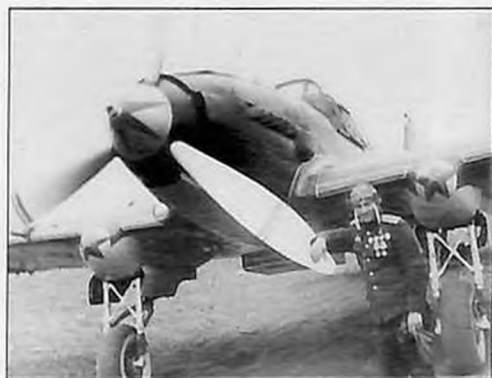
Штурмовик Ил-2 прославленного летчика