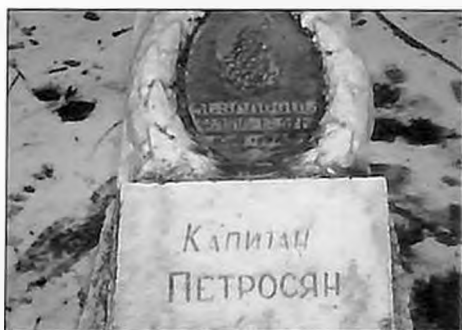
Могилa Г. Петросяна в Санкт-Петербурге