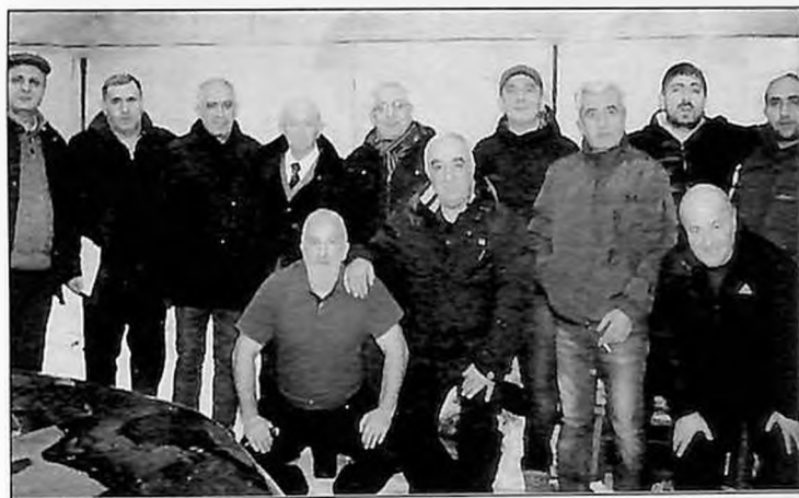
В Санкт-Петербурге (30.12.2018 г.)