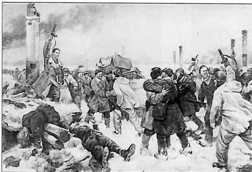
Прорыв блокады Ленинграда (18.01.1943)