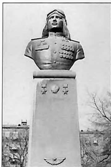
Бюст Нельсона Степаняна в Ереване