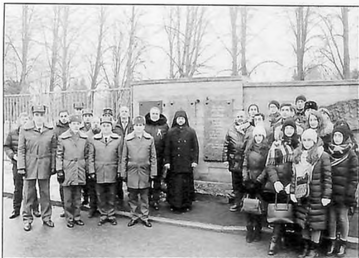
На Пискаревском кладбище. 27.01.2018 г.