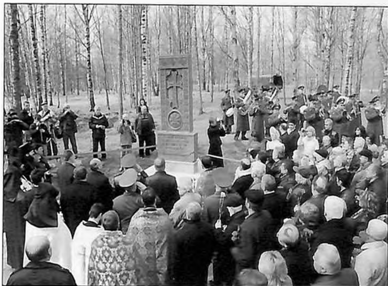
Крест-камень (хачкар) на Синявинских высотах (2010 г.)