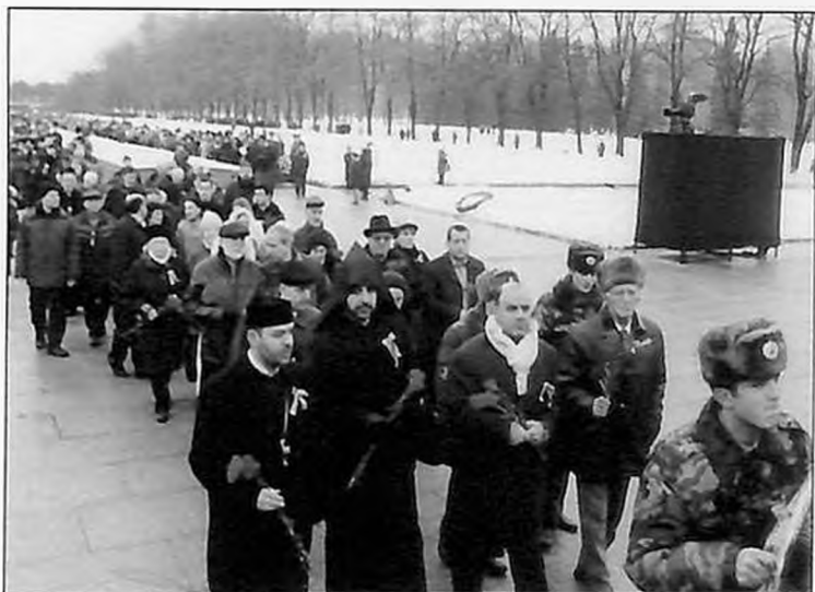
Возложение венков на Пискаревском кладбище (2010 г.)