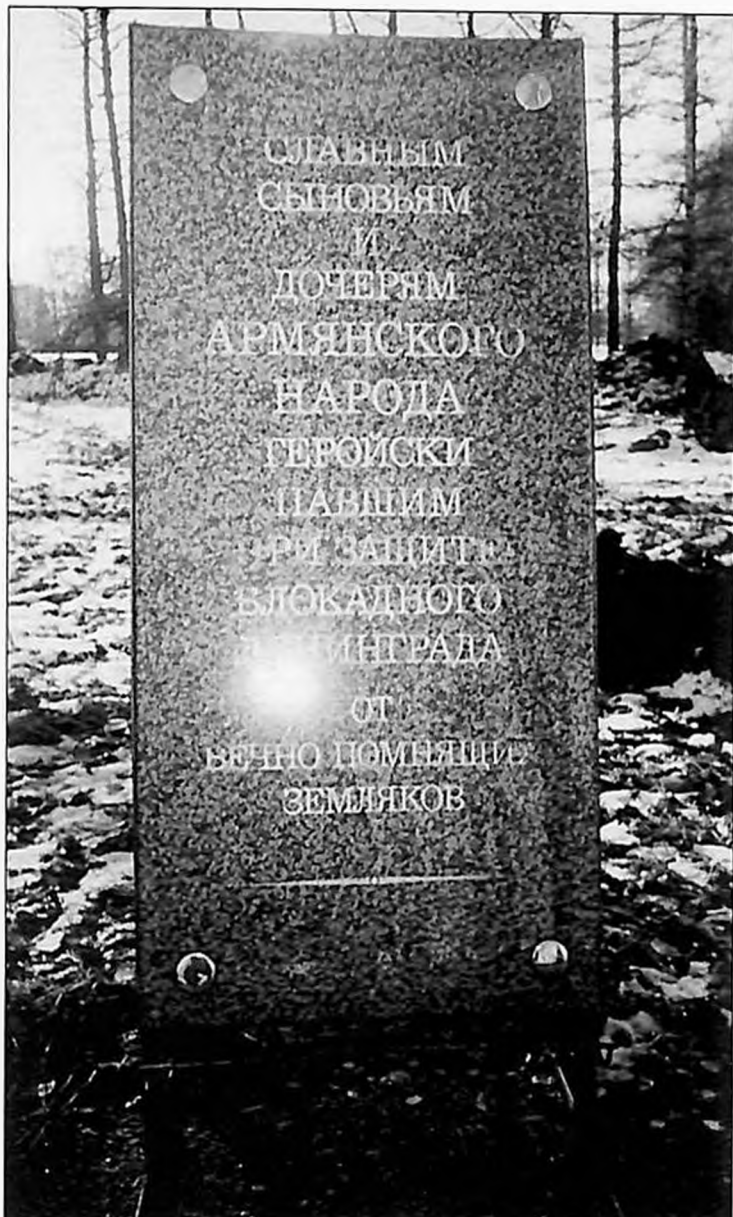
Мемориальная доска в память о героически павших армянах в Аллее Памяти на Пискаревском кладбище (2002 г.)