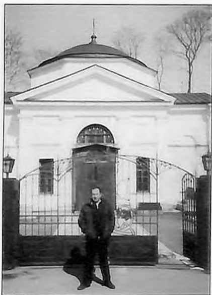
Армянская Апостольская церковь Св. Арутюн (Св. Воскресения) на Васильевском острове в С.-Петербурге