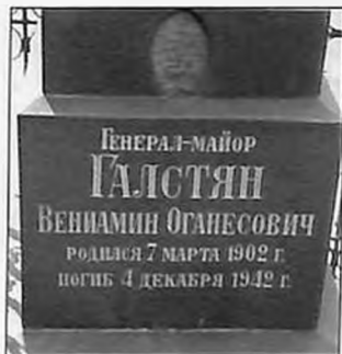
Могила Б. Галстяна (С.-Петербург, Александра Невского Лавра)