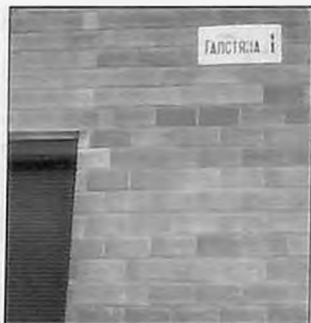
Улица Галстяна в Санкт-Петербурге