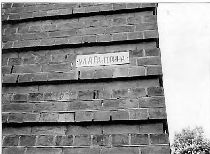
Улица Андрея Григорина (Григоряна) в Гатчине