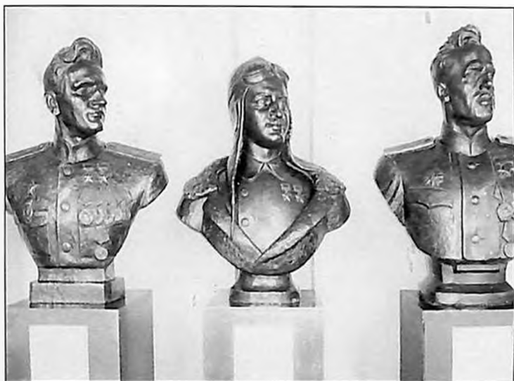
Бюст Н. Степаняна в ЦВММ (в центре)