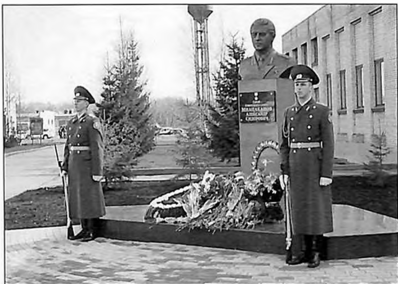
Почетный караул у бюста А. С. Мнацаканова в Гатчине (2010 г.)