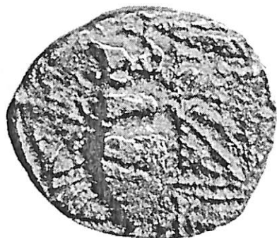
III.9 (3 x)