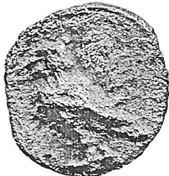
II.4 (3.5 x)