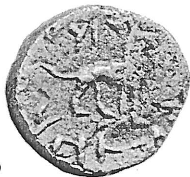
I.16 (3.5 x)