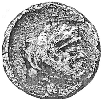
IV.18 (2.5 x)

Հայաստանում յայտնաբերուած արամեագիր ընթերցուած արձանագրութիւնների տառաձեւերի համեմատական աղիւսակ 1