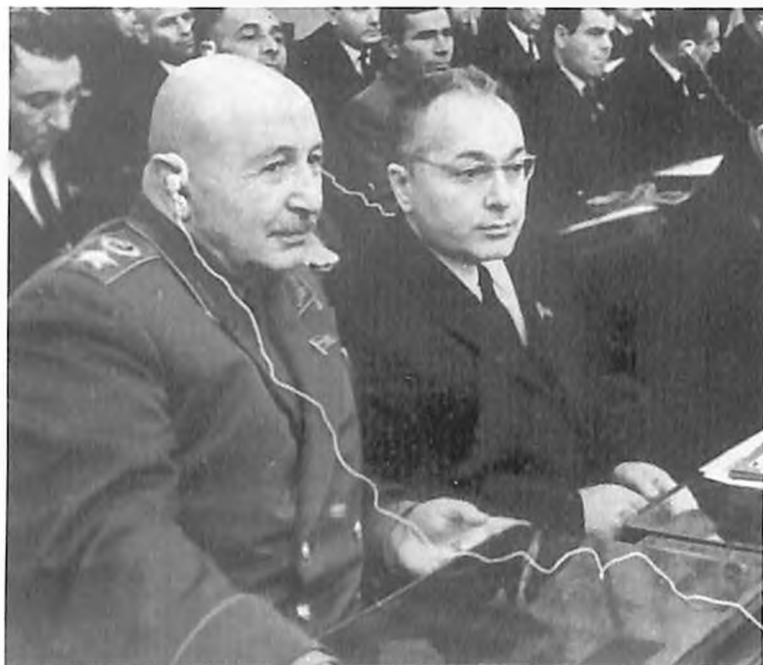
И. Х. Баграмян и академик Геворг Гарибджанян, 1968 год.