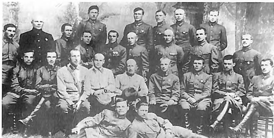
Слушатели кавалерийских курсов в Ленинграде. 1924-1925 годы. В первом ряду сидят: И. Х. Баграмян (первый справа), А. И. Еременко (третий справа), второй ряд: Г. К. Жуков (первый справа), К. К. Рокоссовский (пятый справа).