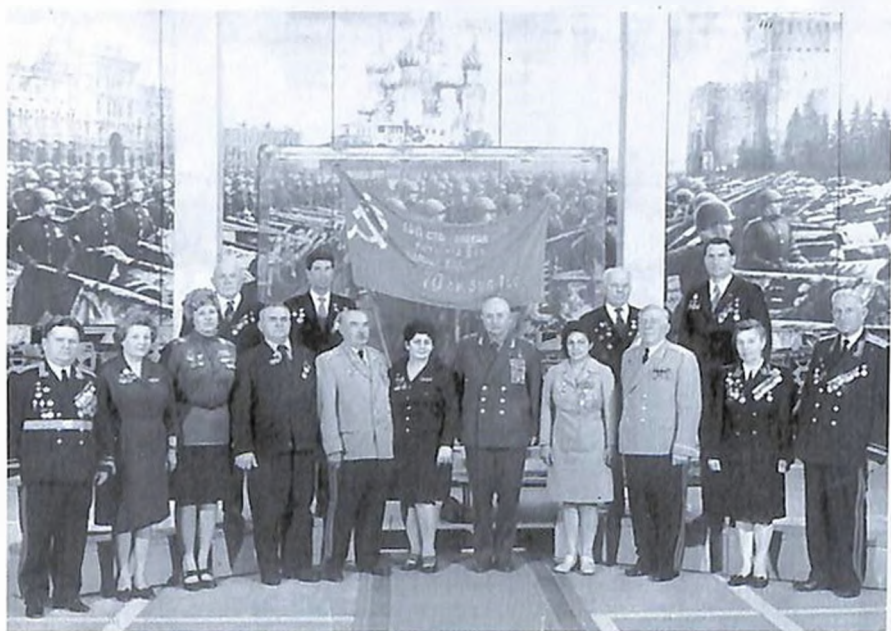
У Знамени Победы, Москва, Центральный музей Вооруженных Сил России.