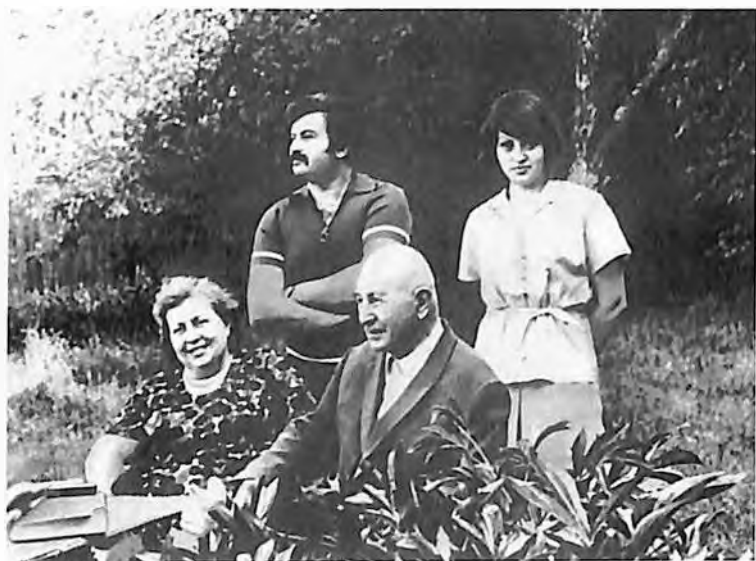
Вместе с семьей.