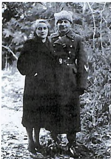
И. Х. Баграмян с женой Тamarой Амаяковной. Западный фронт. Осень, 1942 год.