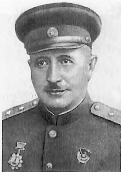
Генерал-лейтенант И. Х. Баграмян -- командующий 11-й гвардейской армией. Февраль, 1943 год.