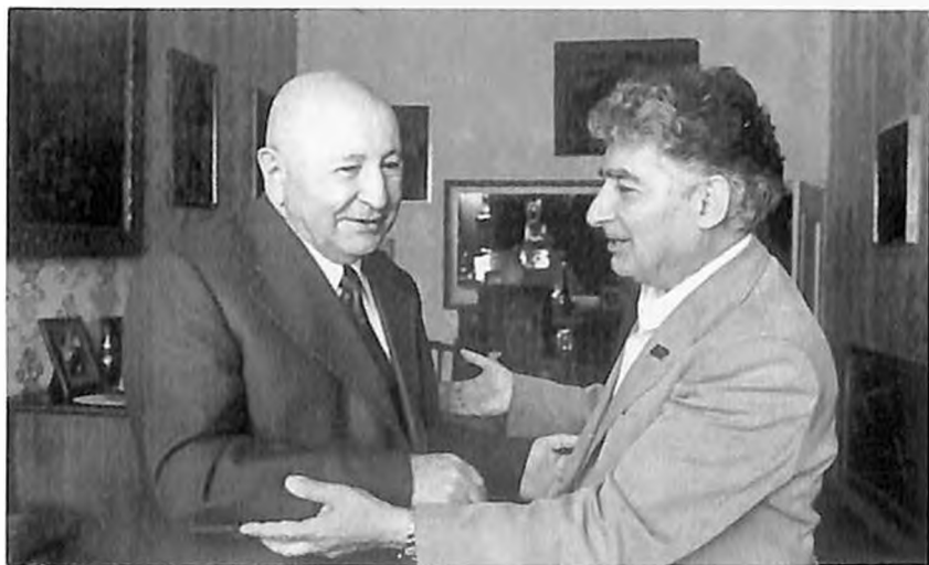
И. Х. Баграмян и народный артист СССР Эдуард Мирзоян. Ереван, сентябрь, 1979 год.