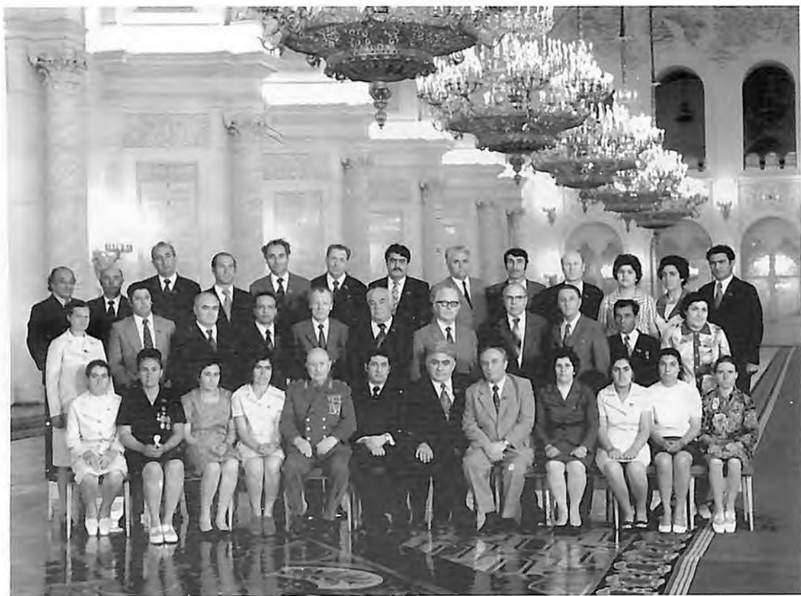
3-я Сессия Верховного Совета СССР 9-го созыва. Москва, Кремль, июль, 1975г.