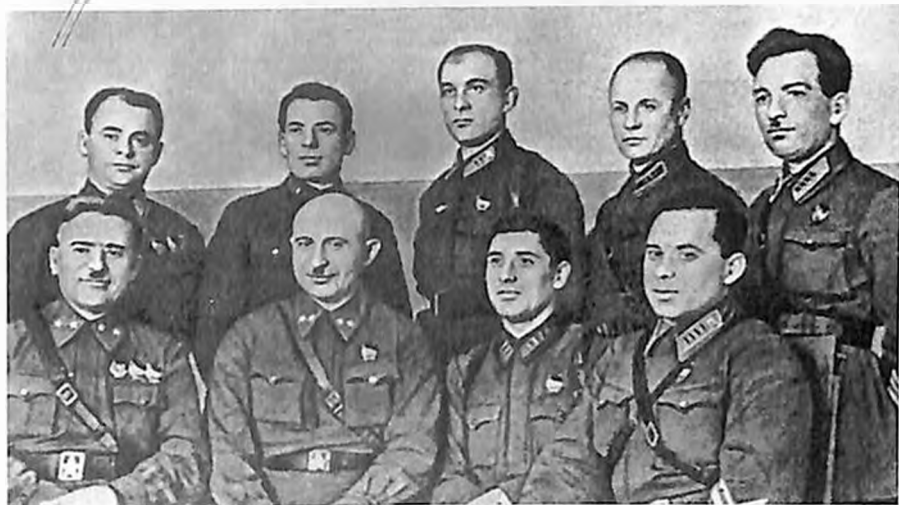
Группа работников штаба Юго-Западного фронта. 1941 год.