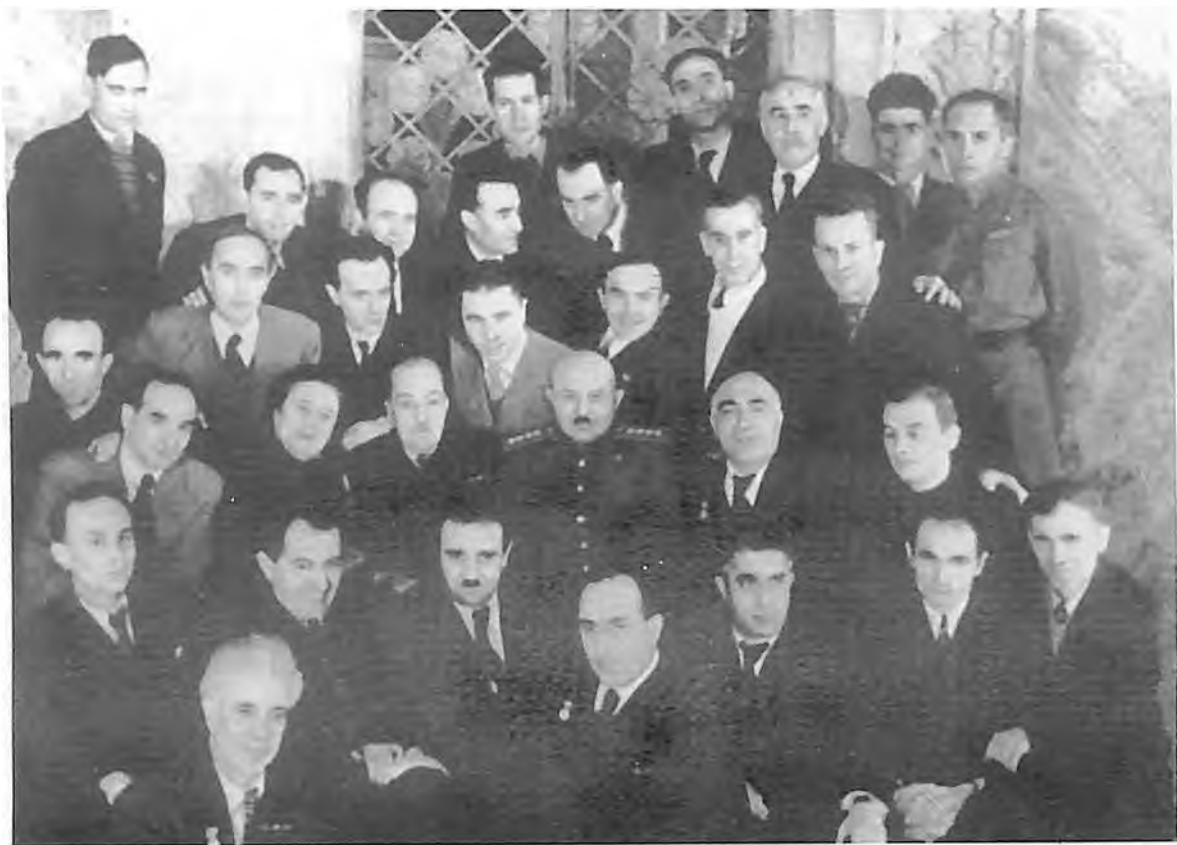
И. Х. Баграмян среди армянских деятелей культуры.