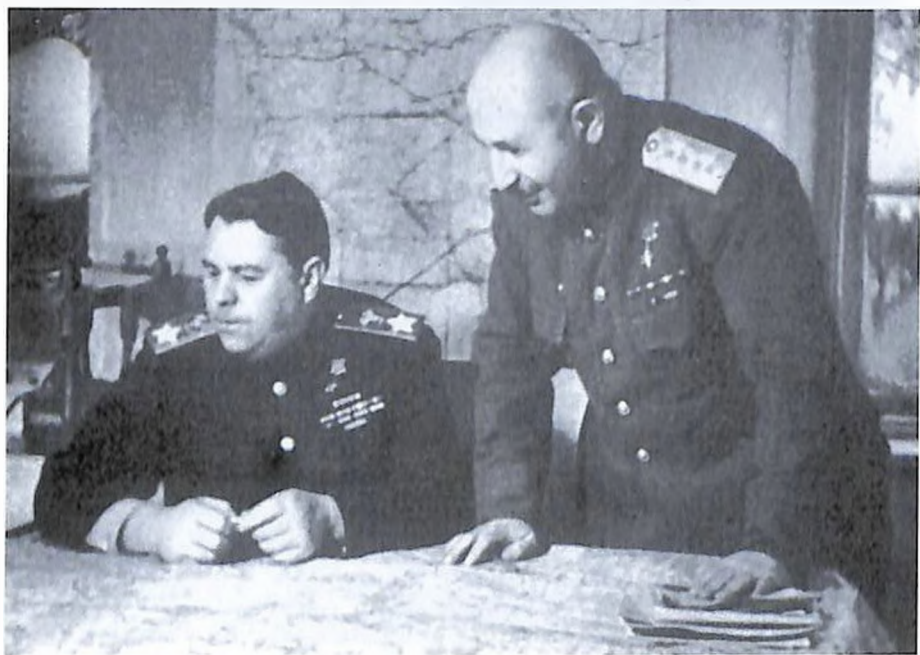
А.М.Василевский и И.Х.Баграмян.Восточная Пруссия. Апрель, 1945 год.