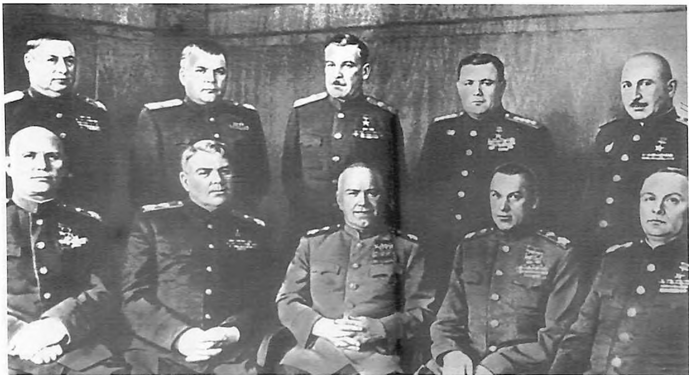
Маршалы Победы -- командующие фронтами на завершающем этапе Великой Отечественной войны. Слева направо: И. С. Конев, А. М. Василевский, Г. К. Жуков, К. К. Рокоссовский, К. А. Мерецков; Стоят слева направо: Ф. И. Толбухин, Р. Я. Малиновский, Л. А. Говоров, А. И. Еременко, И. Х. Баграмян. Москва, июнь, 1945 год.