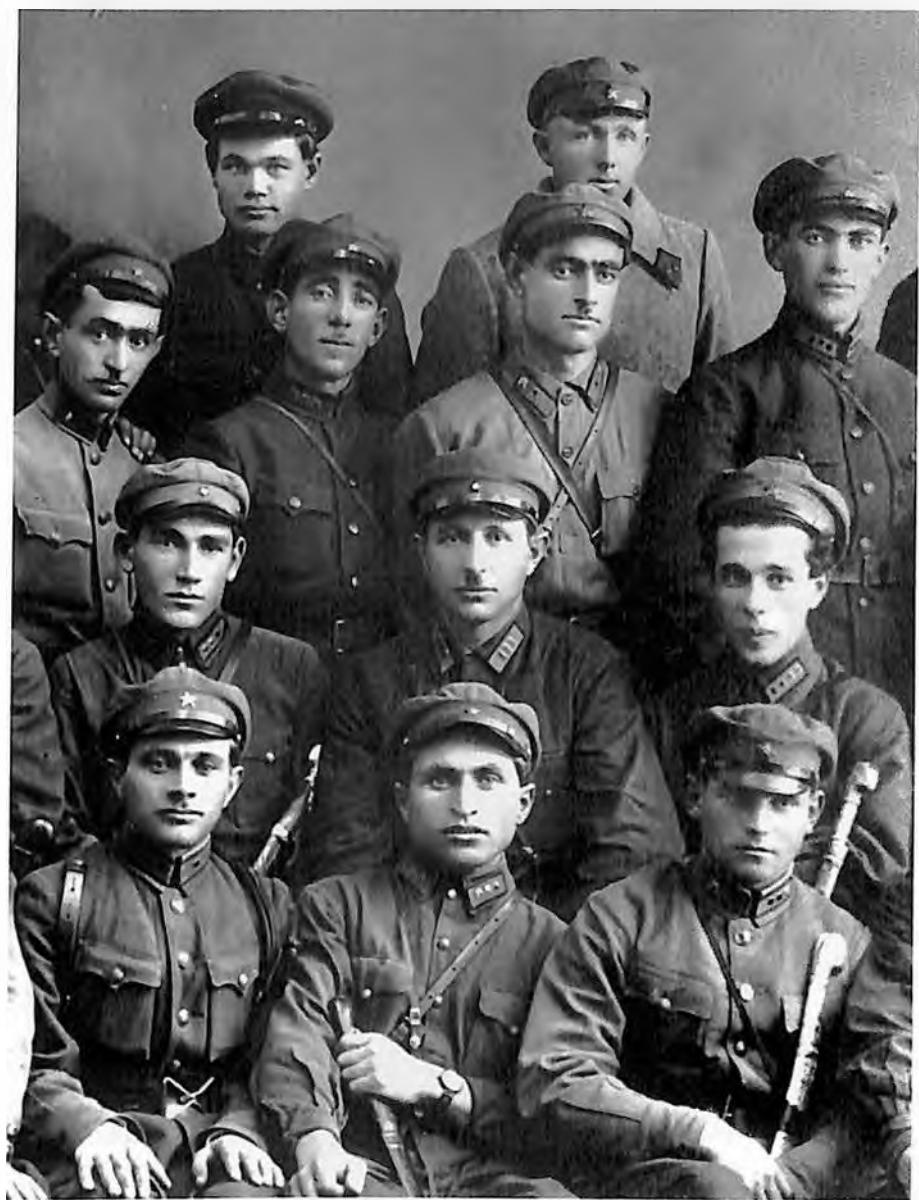
Командир кавалерийского полка Армянской стрелковой дивизии И. Х. Баграмян (в центре) с группой командиров и политработников полка. 1929 год, Армения.