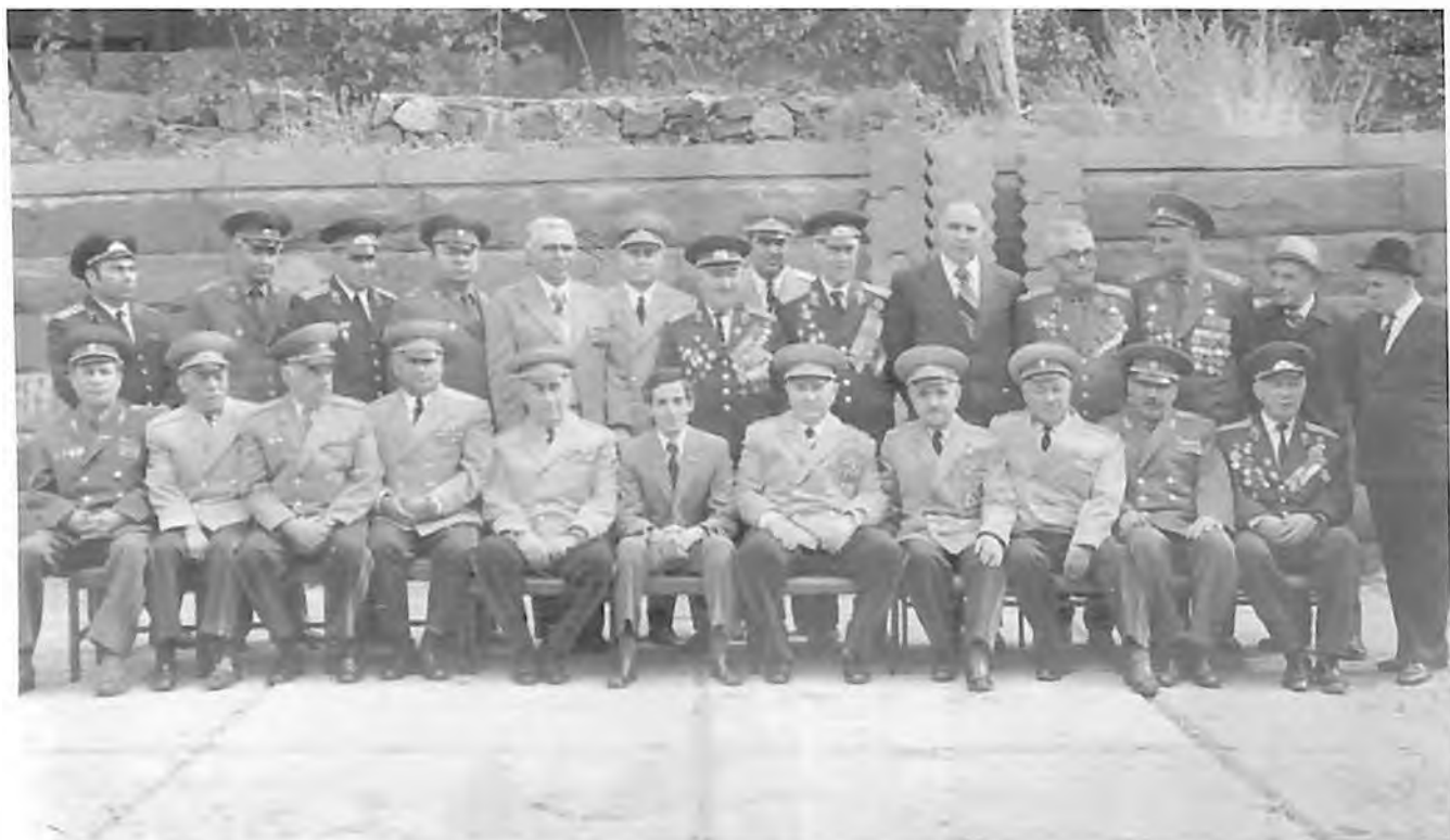
И. Х. Баграмян с группой ветеранов войны. Ереван, май, 1981 год.