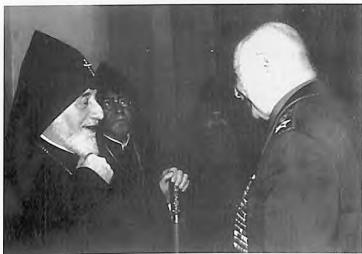
Католикос псех армян Вазген Первый и И. Х. Баграмян. Эчмиадзин, май, 1981 год.