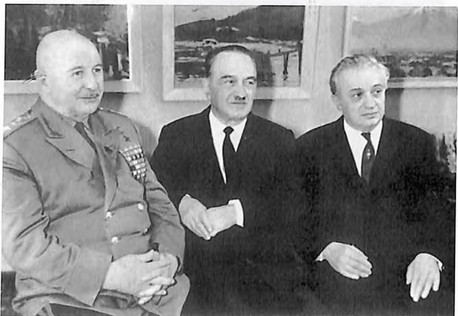
И. Х. Баграмян, братья Анастас и Артем Микояны.