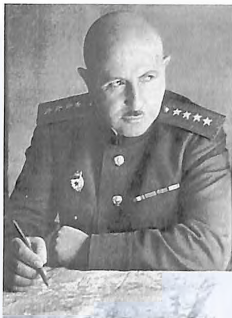
Готовится новая операция...