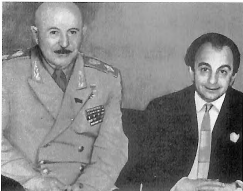
И. Х. Баграмян и народный артист СССР Рачия Каплянян.