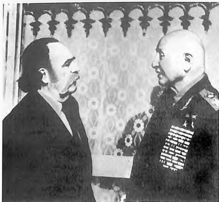
И. Х. Баграмян и Вильям (Уильям) Сароян.