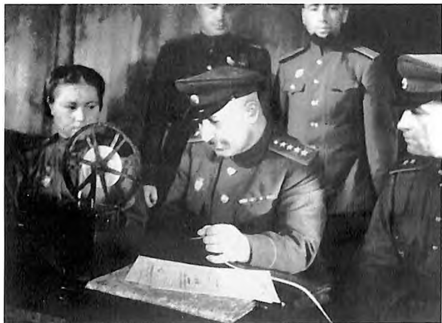
В штабе 1-го Прибалтийского фронта, у телетайпа. 1944 год.