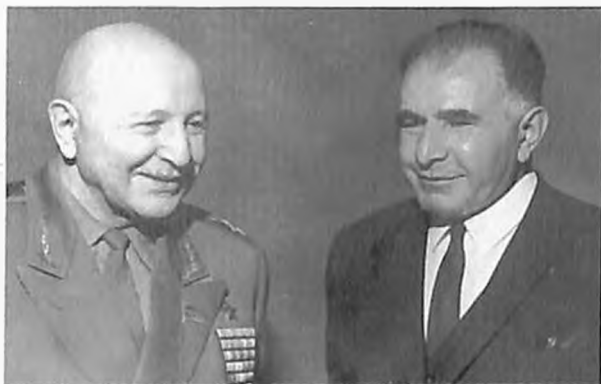
И. Х. Баграмян и гвардии полковник Ашот Арутюнян, Москва, 1973 год.