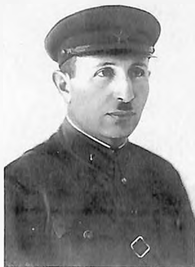
И. Х. Баграмян -- начальник штаба 5-й кавалерийской дивизии. Житомир, 1935 год.