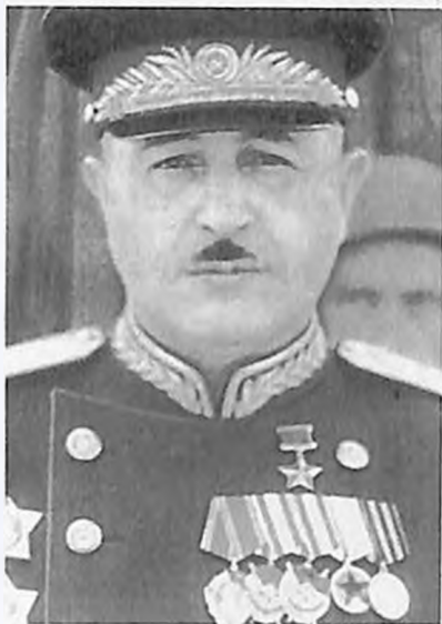
На Параде Победы. Москва, Красная площадь, 24 июня 1945 года.