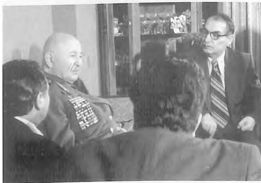
И. Х. Баграмян с киноработниками Армении.