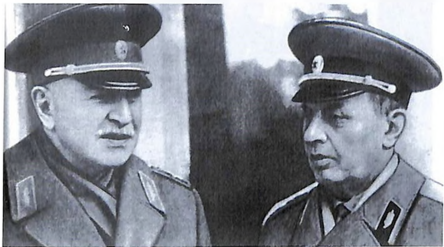
И. Х. Баграмян и Главный маршал бронетанковых войск, Герой Советского Союза Амазасп Бабаджанян.