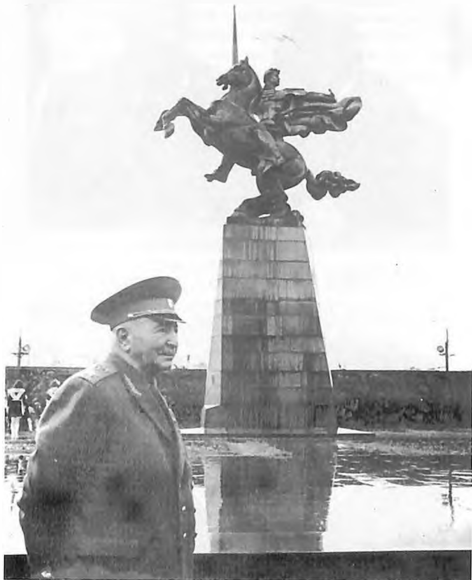
У памятника Гайка Бжишкяна -- Гая в Ереване.