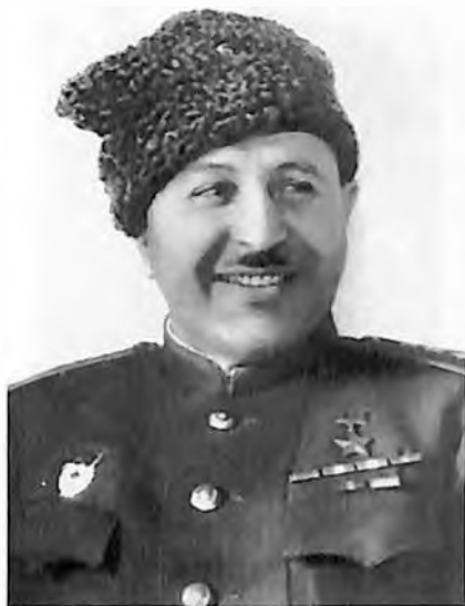
Командующий 1-м Прибалтийским фронтом генерал армии И. Х. Баграмян. Осень, 1944 год.