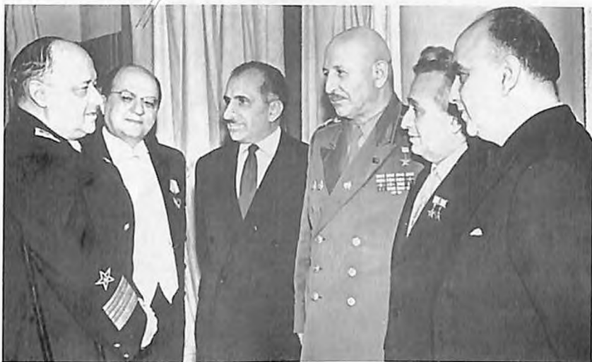
Слева направо: Адмирал Флота СССР И. С. Исаков, народный артист СССР, дирижер А. Ш. Мелик-Пашаев, Герой Социалистического Труда, профессор А. Я. Абраамян, И. Х. Баграмян, авиаконструктор Арт. И. Микоян, народный артист СССР П. Г. Лисициан.