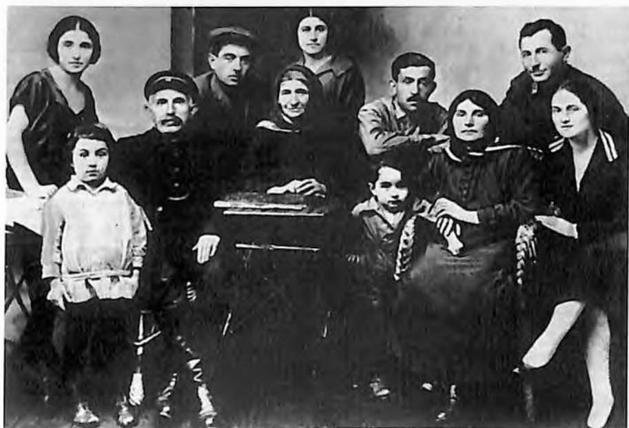
Семья И. Х. Баграмяна