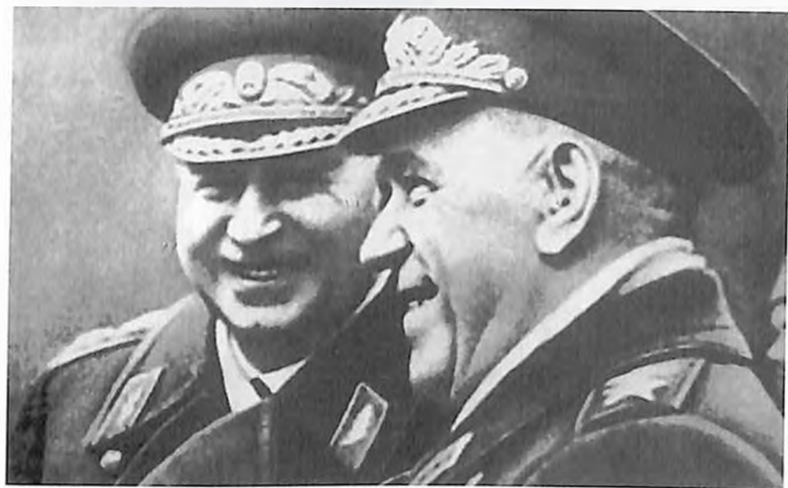
И. Х. Баграмян, Г. К. Жуков.