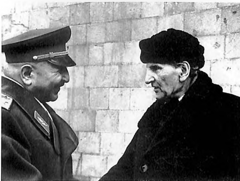
И. Х. Баграмян и народный художник СССР Мартирос Сарьян, Ереван, 10 ноября 1968 года.