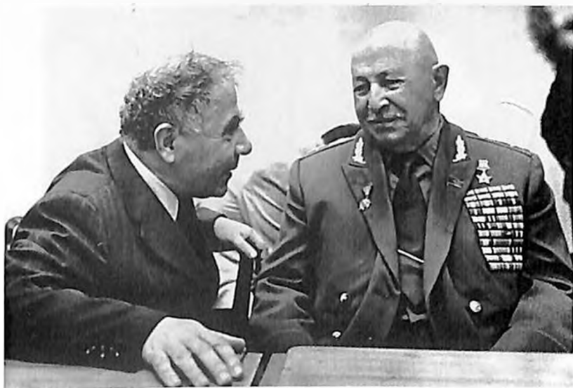
Президент АН Армении академик Виктор Амбарцумян и И. Х. Баграмян в Бюракане.