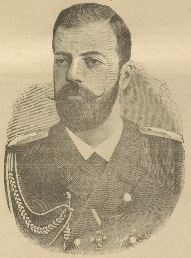
Ն. Կ. Բ. Մեծ Իշխան ԱԼԷՔՍԱՆԴՐ ՄԻԽԱՅԵԼՈՎԻՉ

1892ին պատուակալ նախագահ ընտրուած է Ռուսիոյ գեղարուեստական ընկերութեան, որուն աշխատութեանց ինք մեծ եռանդով մասնակցած է, նաև Մեծ Իշխան Միխայելովիչ մեծ սէր ու համակրութիւն ցոյց տուած է գէպի բնապատմական և ցեղագրական գիտութիւնները : զորս է երկու