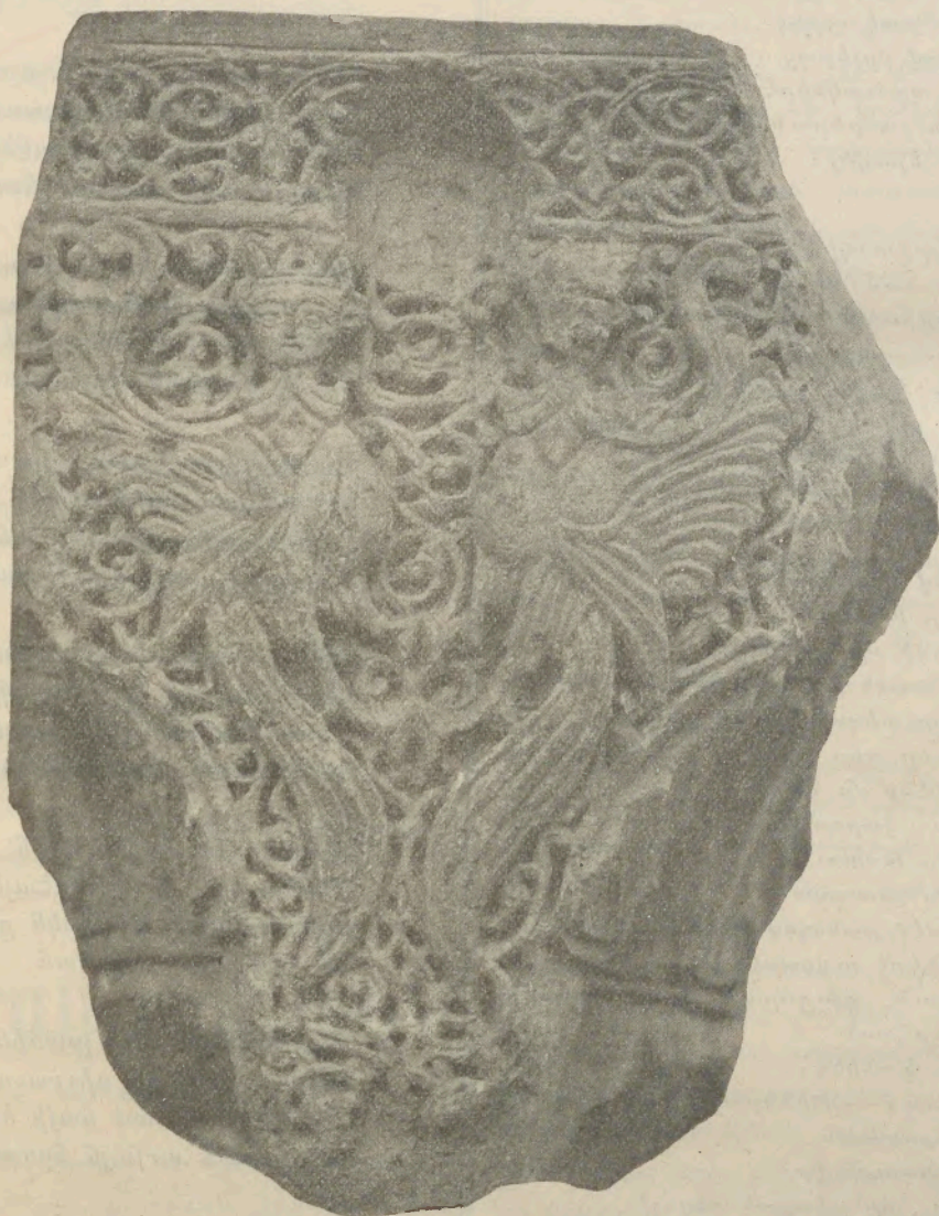
Քանդակագործական հասակոսոր. Բագարանէն քերուած (Եջմաշույ Բանդարու)