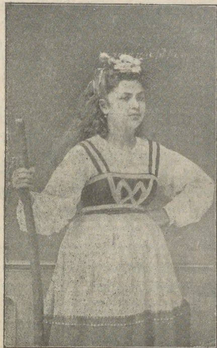
ՀՐԱՉԵԱՅ՝ ՀՈՎԻՌՆԻ (« Հովիւ-Հովուհի » Երգին մէջ).

Գարեգին Ռշտունին միջահասակ, նիհար, թխագոյն, կուրծքի սկարուձեւամբ սառապող երիտասարդ մըն էր: Այս պարոնը ճշմարիտ