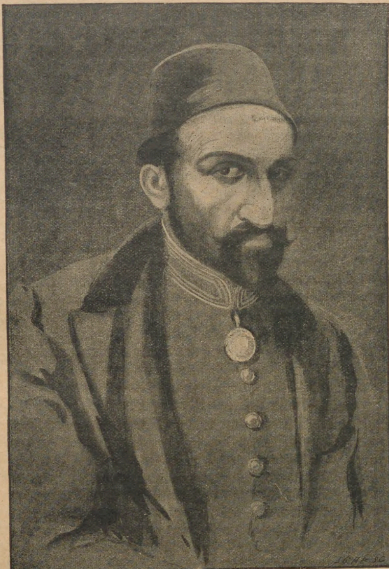
ԱՊՏԻԿ ԶԱՄԻՏ Բ, (Monde illustré ւաշուած)

Սուլթանը շատ ուշիմ է բայց բռնակալու- թիւնն ու մշտական սարսափը որուն մէջ կ'ապրի, բնական է որ զինքը պիտի ստիպէին իր բոլոր խելքը իր անձնական պահպանու- մին յատկացնել, եւ անոր այն կարողութիւնը միայն դոր- ժածել որ այս նպատակին կրնան ծառայ- յել, ինչպէս կասկածաւոր թիւնը, խոր- ամանկութիւ- նը, ինքնա- պաշտպանող- ականութիւ- նը. այդ կա- րողութիւն- ները, որոնք իր ունեցած- ներէն միմի- ակ դորժա- ծածներն են, հրէշային կեր- պով դարդա- ցած են, այն- պէս որ խել- դած են միւս- ները, եւ ջը- լախտէն յոգ- նած այդ ու- զեղին մէջ, բռնաւորական կիրքեր դար- ձած են: Այս- պէսով է որ Ապտիւլ-Հա- միտ, ժամա- նակ անց- նելով, կատա- րեալ մեհա- մով մը եղած