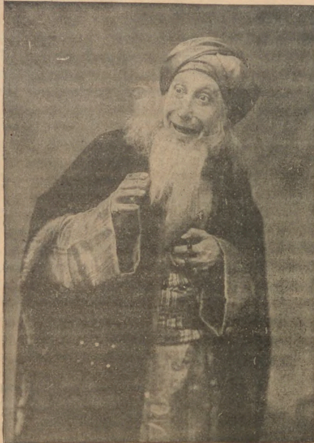
ՆՈՎԵԼԼԻ ՇԱՅՈՒՔԻ ԴԵՐԻՆ ՄԷՋ

Անահիտի Գ. Թուով խօսած էինք Նովելլի մասին եւ իր խաղացած դերերուն մէջէն նշանակած էինք Շալոքի դերն իբրեւ իր ամէնէն կատարեալ ստեղծագործութիւնը: Այս Թուով կը հրատարակենք իտալացի մեծ արուեստագէտին լուսանկարը այդ դերին մէջ: Պատկերը հրաշակերտ մըն է ինքնին, Բամպրանտի Հրէաներուն նշանաւոր շարքին մէջ մտնելու արժանի: Նովելլի յաջողած է իր դէմքին տալ նոյն ինքն դիմակը Հրէութեան, հակասական խառնուրդովը անպատկառ հեղնութեան, յամառ հաւատքի, վիթխարի գծովութեան ու դիւտոյին