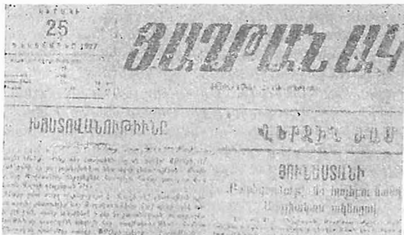
«Յաւրանակ» դեմոկրատական րեբրի 1927 թ. դեկտեմբերի 25-ի համարը

Խորհրդակցական ժողովը, գտնելով որ հակադաշնակ ժողովրդական ճակատի կազմակերպման հարցը հունահայ աշխատավորության ամենահրատապ խնդիրն է, որոշում ընդունեց բազմակողմանի նախադատարատական աշխատանք կատարել մոտ ապագայում դեմոկրատական մասսայական օրաթերթի հրատարակումն ապահովելու ուղղությամբ, օրաթերթ, որը կանդնելով Սովետական Միության և Սովետական Հայաստանի անվերապահ պաշտպանության դիրքերում, պետք է լիներ գաղութի բոլոր հակադաշնակ առաջավոր ուժերի պայքարի ընդհանուր օրգանը: