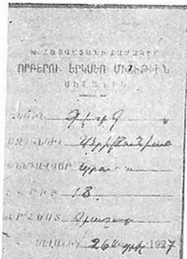
Սելանիկի Խորհրդային Հայաստանի Խամակիր որբերի միության անդամատուր

Որբերի միութչան բոլոր հիմնական մասնաճյուղերը պանկալոսյան դիկտատուրայի տարիներին զլխավորում էին