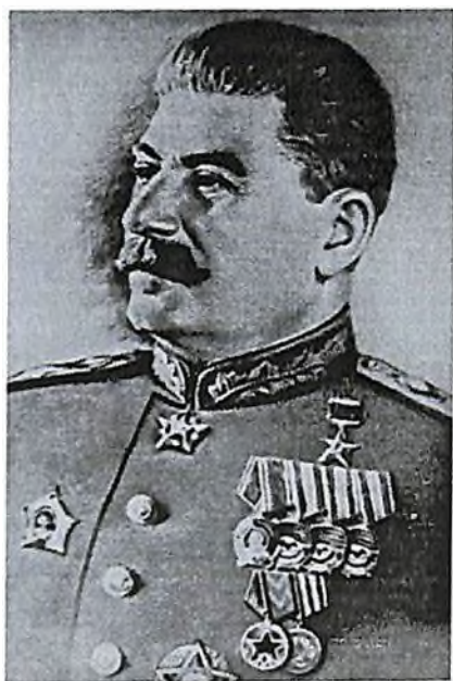
Сталин Иосиф Виссарионович