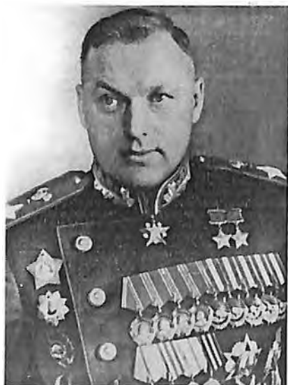
Рухоссовский Константин Константинович