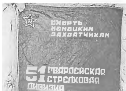
Гвардейское знамя 51-й дивизии