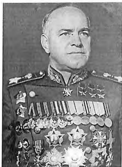
Жуков Георгий Константинович