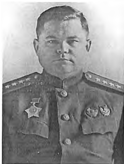
Ватутин Николай Федорович