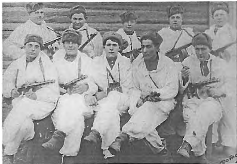
Группа разведчиков 51 Гв СД, отправляющиеся на задание