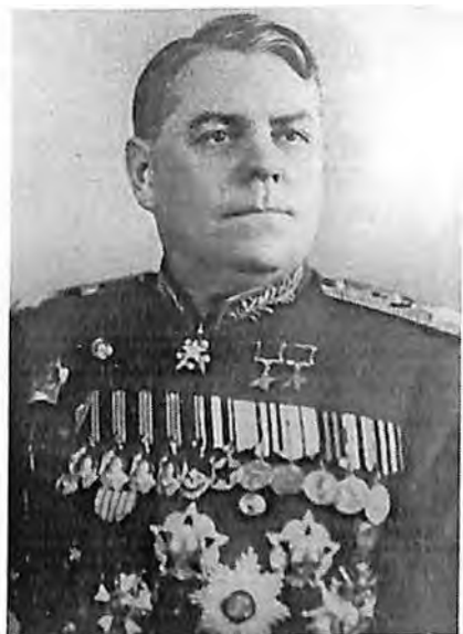
Василевский Александр Михайлович