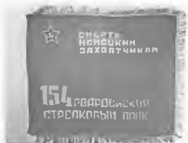
Гвардейское знамя 154-го Лорийского полка