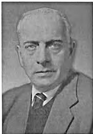
Алабян Каро Семёнович