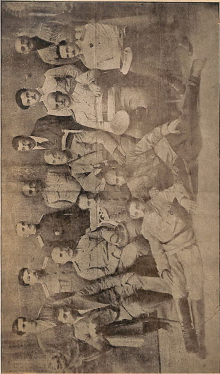
Չախեն ազ (նստած) -- 1. ԴԲՕ, Բաշ Աբարանի զորաբանի հրամանատար. 2. Զորավար Միլիտենկո, Մարտիրոսյանի գաղափարի ֆակտաներու ընդհ. հրամանատար. 3. Զորավար ՆԱԶԱՐԲԵԿԵՆԿՈՎ, սպարապետ հայկական բանակի, ընդհ. զինված զորաբանի ֆակտաներու. 4. Զորավար ԴԱՆԵՆԿ, ՌԵԿ ԳԻՐՈՒՄԵՆԿՈՎ, Մարտիրոսյանի զորաբանի հրամանատար :