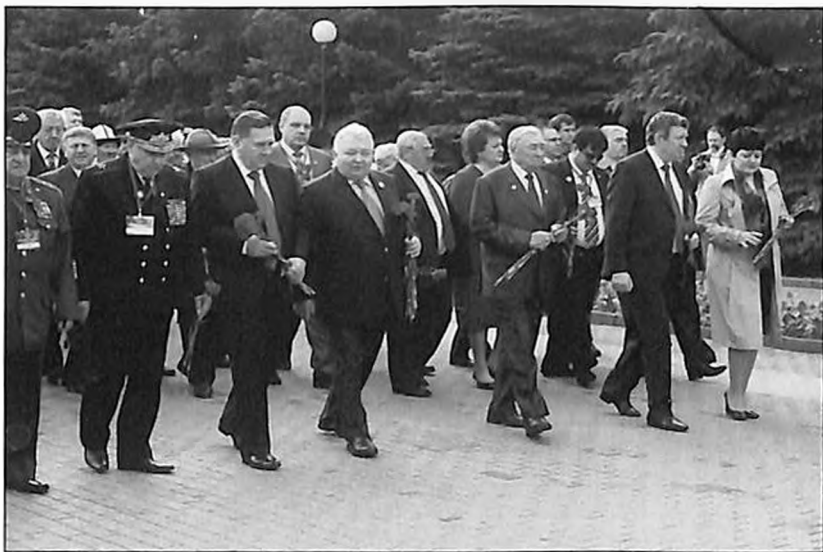
Члены президиума форума возлагают цветы к памятнику воинам, погибшим в Великой Отечественной войне.