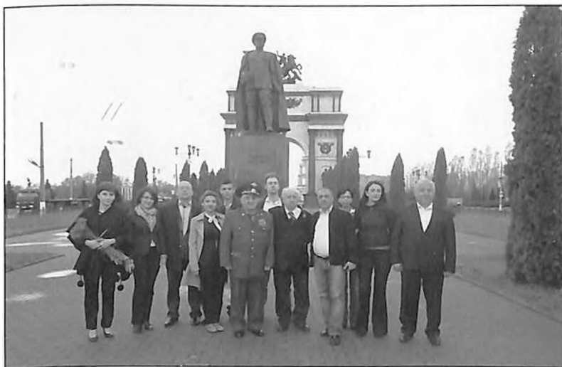
Участники армянской делегации с представителями армянской общины Курска у памятника маршалу Советского Союза Г.К. Жукову.