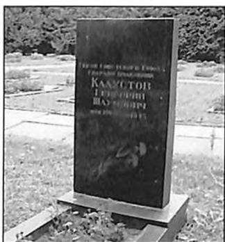
Могила Г. Калустова в г. Курск (Никитское кладбище).