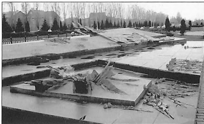
Памятник воинам, погибшим в Великой Отечественной войне.