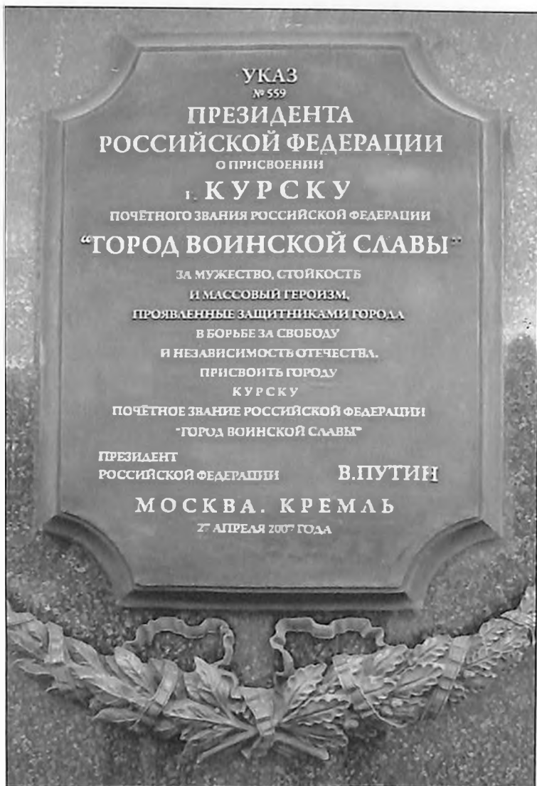
Указ Президента РФ В.В. Путина о присвоении г. Курску почетного звания «Город воинской славы».