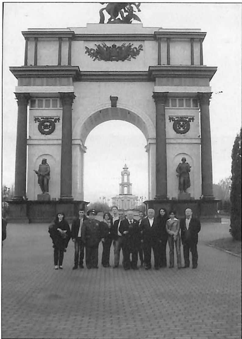
Армянская делегация у мемориального комплекса "Курская дуга – Триумфальная арка".