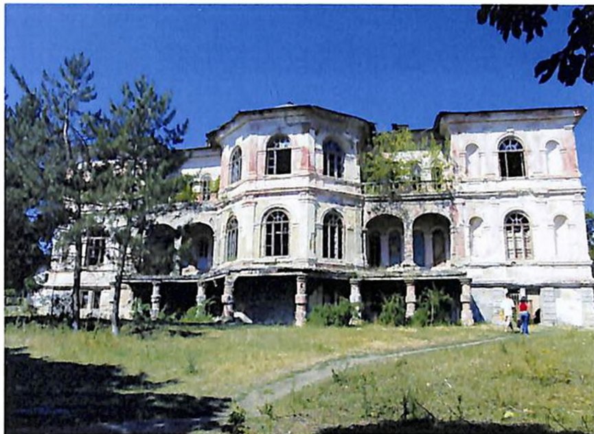
Дворец Манук Бей в Ганчештах (ныне Хынчешт)