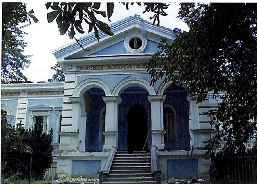
Дворец в бывшей усадьбе Ивана (Оганеза) Балиоза в селе Иванча