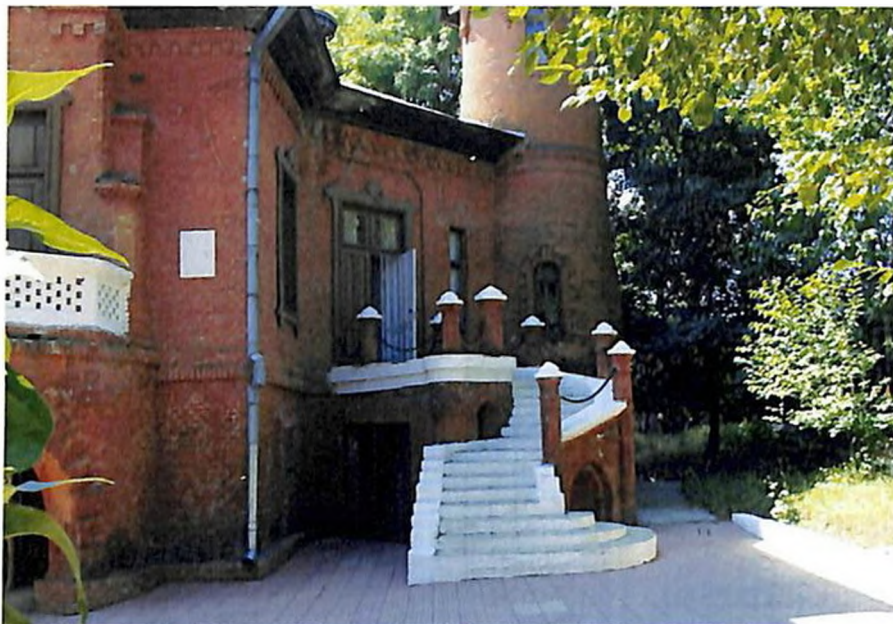
Охотничий замок в бывшей усадьбе Манук Бея (Ныне историко-краеведческий музей)