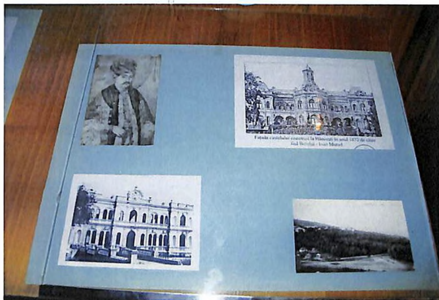
Стенд с портретом Манук Бей и фотографиями дворца