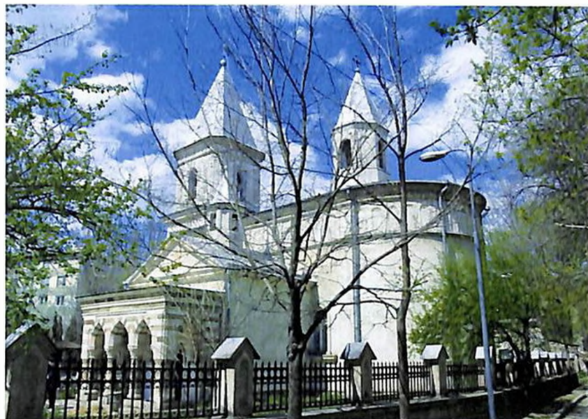
Армянская Апостольская церковь Св. Богородицы в Кишиневе