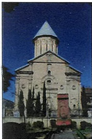
Թբիլիսիի Էջմիածնեցոց եկեղեցին