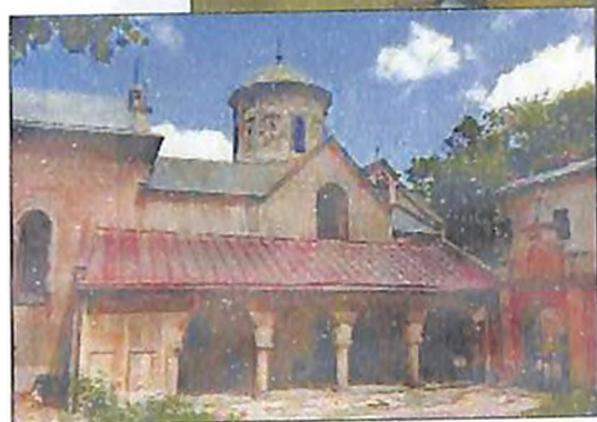
Լվովի Սբ. Աստվածածին Եկեղեցին