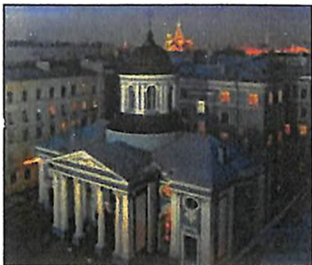
Սանկտ Պետերբուրգի Սբ. Կատարինն եկեղեցին