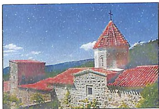
Ղրիմի Սուրբ Խաչ վանքը