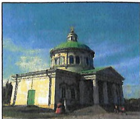
Դոնի Ռոստովի Սուրբ Խաչ եկեղեցին