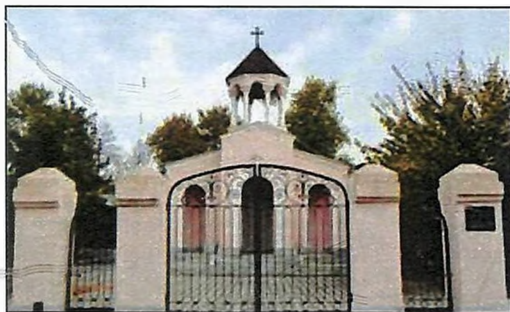
Սամարղանդի Սբ. Աստվածածին եկեղեցին