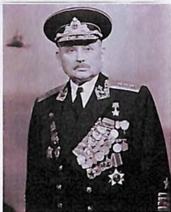
Ф. С. ОКТЯБРЬСКИЙ