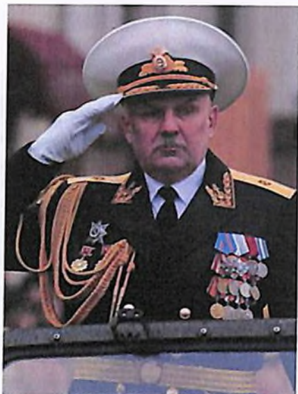
АДМИРАЛ СЕРГЕЙ АВАКЯНЦ