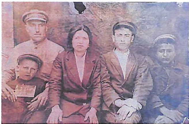
Ընտանեկան լուսանկար, 1940թ.