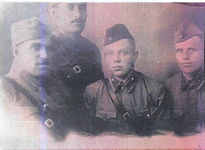
Մաստոպոյ, 1942թ. նոյեմբեր