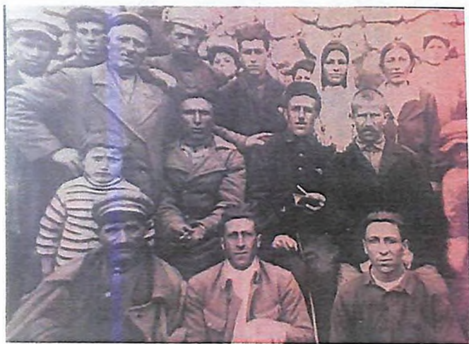
Իրինդի (Թալինի շրջան) կոլտնտասականների հետ, 1936թ.