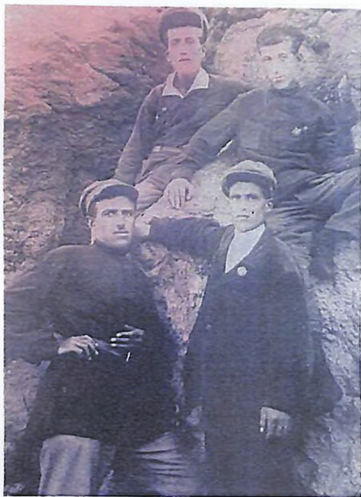
Իրինդի (Թալինի շրջան) կոլտնտեսականների հետ, 1936թ.