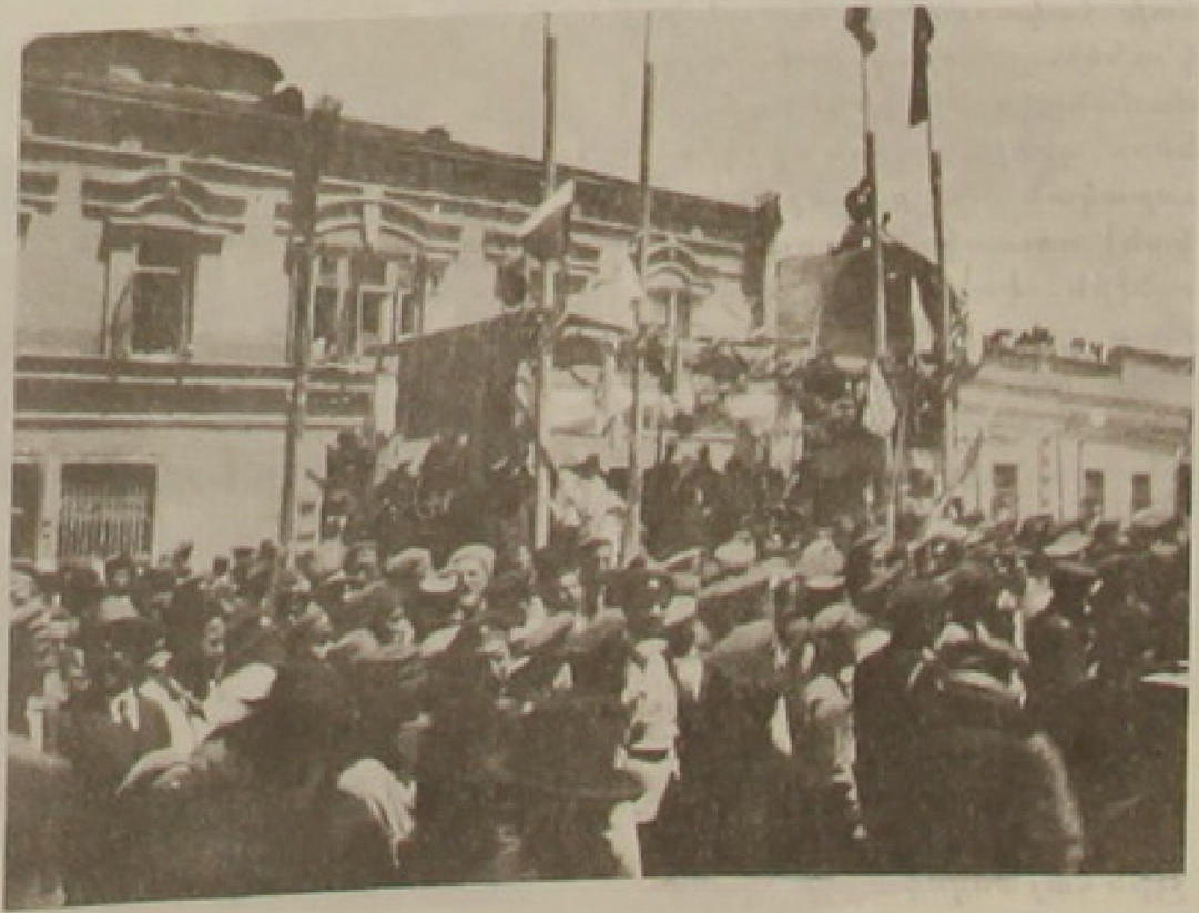
28 Մայիս 1919

Ֆինանսական նախարարութեան գործունէութիւնը, օրինակ, կապուած է ապահովութեան ու խաղաղութեան. երբ կը տիրէր խաղաղ մթնոլորտ՝ գործը կ'ընթանար շատ ակելի արագ ու արդիւնաւէտ: Հակառակ կ'ըլլար, երբ անապահովութիւնը ըլլար գերիշխողը: Այս նախարարութեան հանդէպ ուղղուած քննադատութիւնները սխալ չէին, բայց անոնք կ'ուղղուէին սխալ հաս-