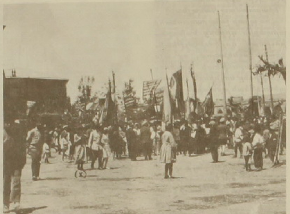
28 Մայիս 1919

Դժգոհութիւն կ'առաջանար նաեւ շարքերուն մէջ, երբ կա- ռավարութիւնը (մա'նաւանդ՝ Քաջագնունիի վարչապետու- թեան օրով) կը փորձէր ունե- նալ բոլորովին անկախ գոր- ծունէութիւն եւ ջանք կը թա- փէր չէզոքացնելու Դաշնակ- ցութեան ազդեցութիւնը՝ կա- ռավարութեան գործունէու-