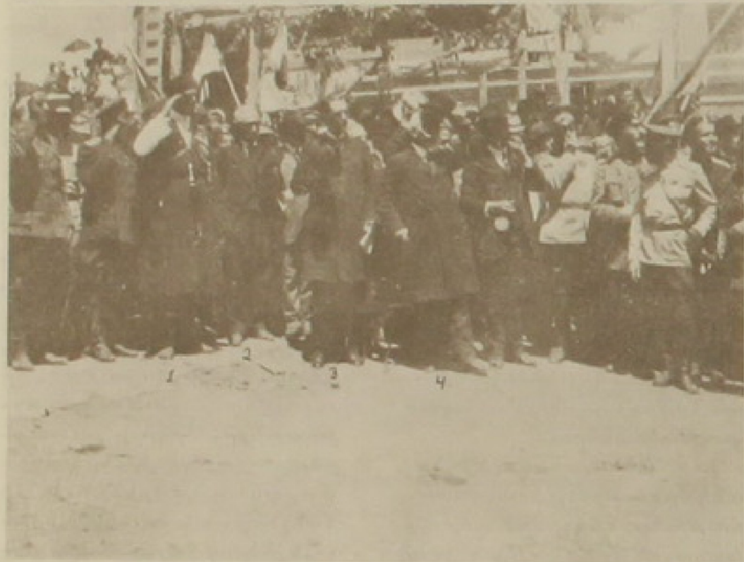
28 Մայիս 1919. 1) Ծախիսաթումի, 2) Հ. Կոստյեան, 3) Համօ Օհանջանեան, 4) Հայր Արրահամ

րոպական շափուած-ձեւուած յառաջադէմ սահմանադրու- թեանց օրէնքներուն վրայ, յիշեալ բնութագրումին յարիր չէին, մա'նաւանդ՝ խիստ վը- տանգաւոր կացութիւններու ու պարագաներու ընթացքին: