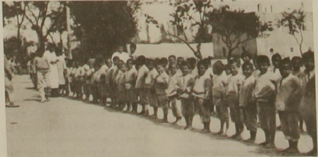
Հայ որբեր էջմիածնի մէջ

Հաղորդակցութեան նախարարութիւնը պիտի հիմնուէր 1920ի սկիզբները: Այս նախարարութիւնը ունէր երկու բաժանմունք՝ երկաթուղիներու եւ խճուղիներու: Առաջինի պարագային, գլխաւոր աշխատանքներն էին՝ կայարաններու նորոգութիւն կամ նոր կայարաններու հիմնում, շոգեկառքերու եւ վագոններու նորոգութիւն, մայրաքաղաքի եւ այլ քաղաքներու միջեւ կապերու հաստատում եւ այլ աշխատանքներ: Խճուղիներու բաժանմունքը կը զբաղէր ճամբա-