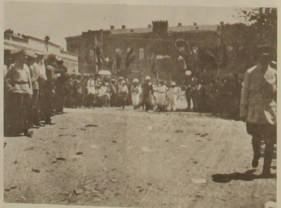
28 Մայիս 1919

Հոս նաեւ պէտք է անպայ- ման շեշտել, որ ընկերվարա- կան աշխարհահայեացքը ա- ռաջին անգամ ըլլալով կենդա- նի կեանք կը դառնար թէ՛ տնտեսականօրէն՝ հողաբաշ- խումի, բնական հարստու- թեան պետականացման ու աշ- խատաւոր եւ գիւղացի դասե- րու քաջալերման միջոցներով եւ թէ՛ ազատութեանց յարգու-