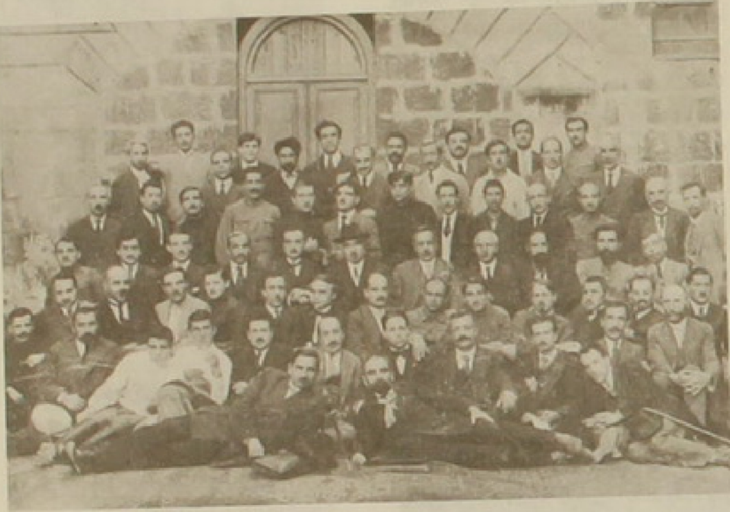
Հ. Յ. Դաշնակցութեան 3րդ Ընդհանուր ժողովի մասնակիցները, Սեպտեմբեր-Նոյեմբեր 1919

Այս պայմաններուն տակ, զինուորական նախարարութիւնը, նոյնինքն այս պայմանները յաղթահարելու համայնականէն մեկնած՝ կը ստիպուի հոգ տանիլ զօրքի կազմակերպումին, անոր զօրացման ու ընդլայնումին: Հակառակ բոլոր դժուարութիւններուն, կարելի կ'ըլլայ ընդլայնել հրետանիի կազմը, կը կազմակերպուի հեծելազօրքը, կը սկսին մասնաւոր