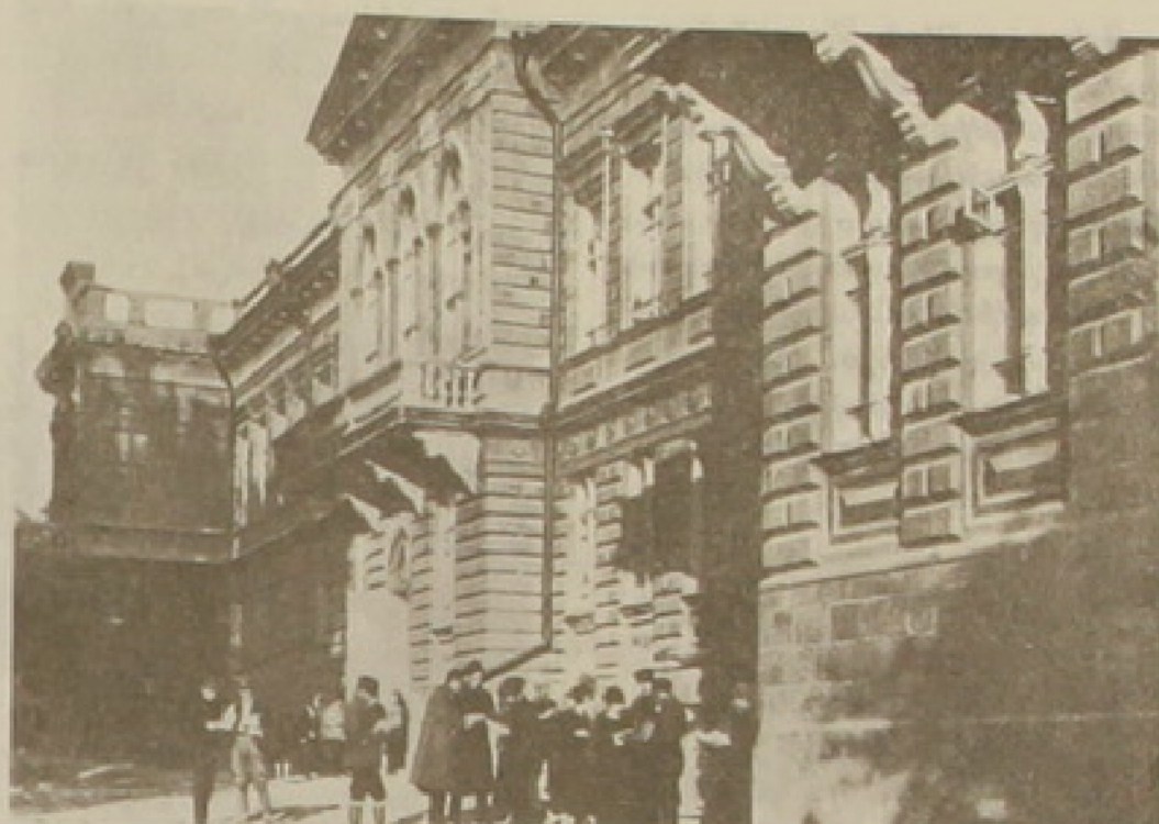
Հայաստանի համալսարանը, Երեւանի մէջ

Նախարարութեանց գործունէութեան ընկալումը եթէ մէկ կողմէ կը դիմադրուէր գոհունակութեամբ, միւս կողմէ՝