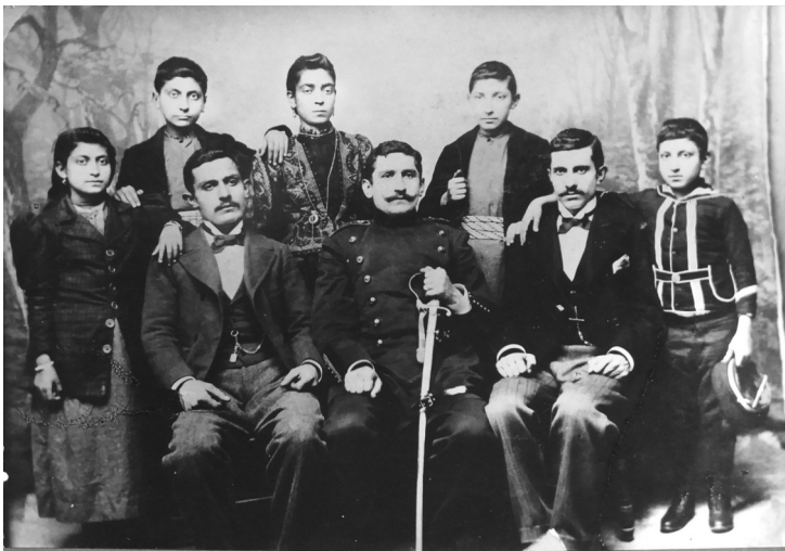
Թօփճեան 6 եղբայրք եւ 2 քոյրեր

Անոր պատմութիւնը այլ խորք եւ տարածք ունի: Յետոյ կը պատմեմ: