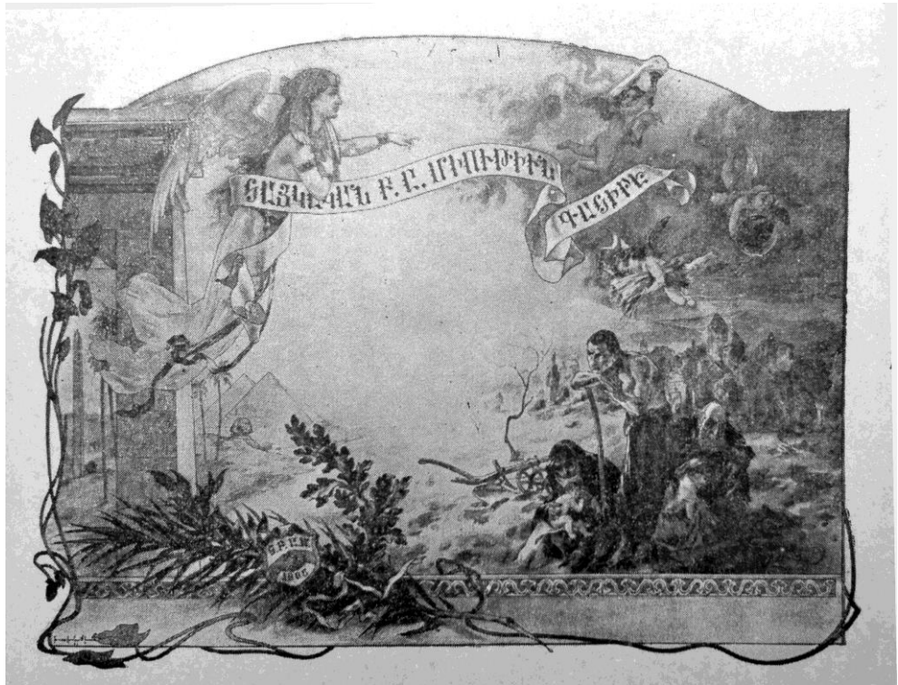
Հ.Բ.Ը.Միութեան առաջին խորհրդապատկերը

Այս ոսկեմատեանին վաճառումէն մնացած շահը պիտի յատկացուի Բարեգործականի որբերուն: