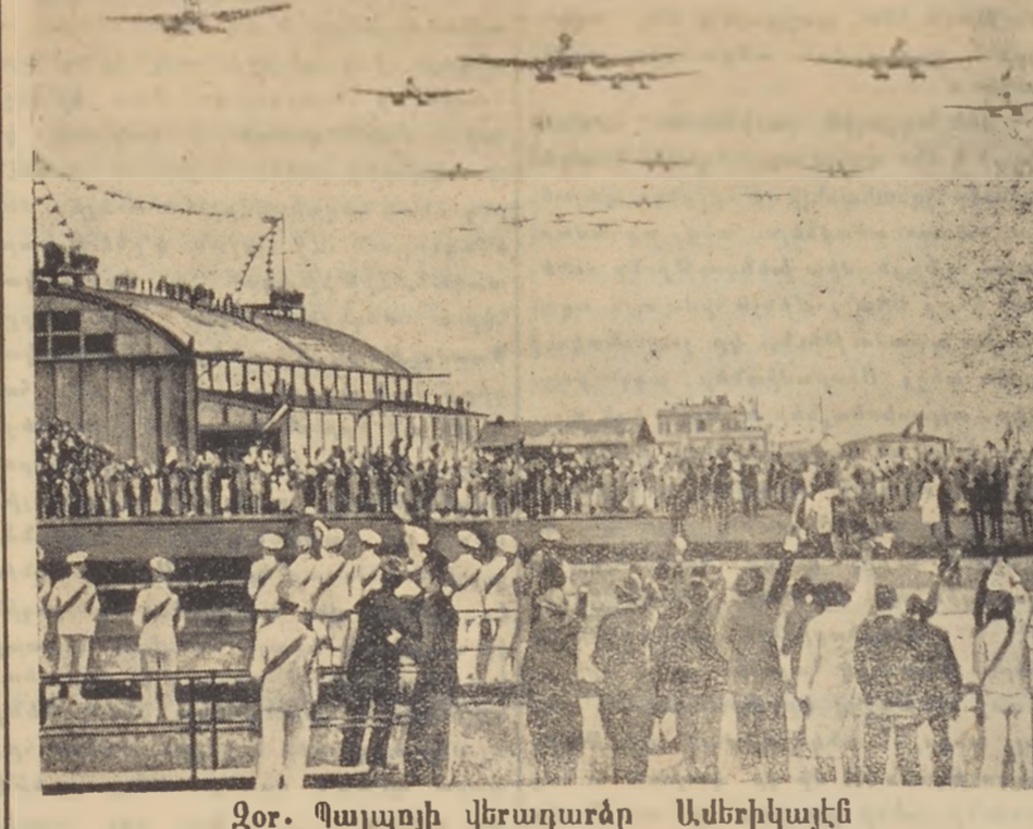
Զօր. Պալալոյի վերագործարար Ամերիկայէն

Ո՛չ, բոլոր անոնք, որ խոյս կուտան Հայաստանէն, կը նշանակէ թէ քաղաքացիական պարտականութիւններուն ամենատարրական ի մասուն անգամ չեն ըմբռնել: Անոնք, մեր սեփական հողն ու լուրը երկինքն ու երկիրը լքելով, կը հասկնան մեզի, որ իրենք դեռ շատ հեռու են ճշմարտ, գիտակցից հայրի ըլլալէ: Մենք, խորունկ գիտակցութիւնը ունենալով, Հայաստանի բոլոր բացասական կողմերուն ու դրոշմներուն հետեւ, որ անհատական, քաղաքական և ընկերային ազատութեան մէջ միայն անհատներն ու ազգերը կը ծին, կը ծաղկին, առոյգ և կենսունակօրէն հասակ կը նստեն: Այդ բոլորը գիտնալով հանդերձ, մենք դէ՛մ ենք, որ Հայաստանի մէջ ապրողները, իրենց դժգոհութիւնները պատրուակ բռնելով անցնին սամուանը: Առանց հարազատ ցաւի, տառապանքի՝ երջանկութիւն և գեղեցիկ ու ազատ կեանք գոյութիւն չունենար: Ինչքէ, Հայաստանէն բոլոր տեսակի փախստականները, ապրելով մեր երկրին մէջ, տառապելով անոր չարքայ ժողովուրդին հետ, պիտի մտածէք, թէ՛ մեր վաղը, մեր ապագա՛ն է որ կը կենդանի: Պիտի իմանաք, որ ձեր այսօրուայ դժգոհութիւններէն ու վիշտերէն՝ Արմէնիան հին հինուրեք փառքերն ու զօրութիւններն է որ պիտի վերահաստատուին: Պէտք է ըմբռնէք, որ ձեր անհատական կամ հասարակական դժնդակ ցուեւրէն պիտի ծնի աւելի՛ մեծ Արշալոյսը Ազատութեան, վաղուան Հայաստան աշխարհի: Պիտի գոնէ ք, զոհարելէ՛ք, չարչարուելէ՛ք և մեռնի՛ք՝ որպէսզի ձեր աճիւններէն ու տառապանքներէն ի վերջոյ հայութեան մշտնջենական ոգին թե՛ առնէ, թուի Արազածէն մինչև Մասիս ու Հայկական Պարս: Պէտք չէ, գործ ունենալ Ռէժիմին, կառավարութեան հետ: Կառավարութիւններն ու ընտրութիւնները աստուածային չեն, սեւական չեն: Ինչ որ կայ ու կը մնայ, ժողովուրդն է ու հայրենիքը: