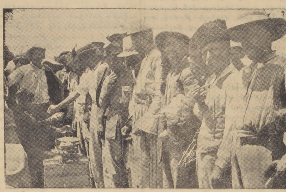
Ապսամբ Աստիներէն խումբ մը