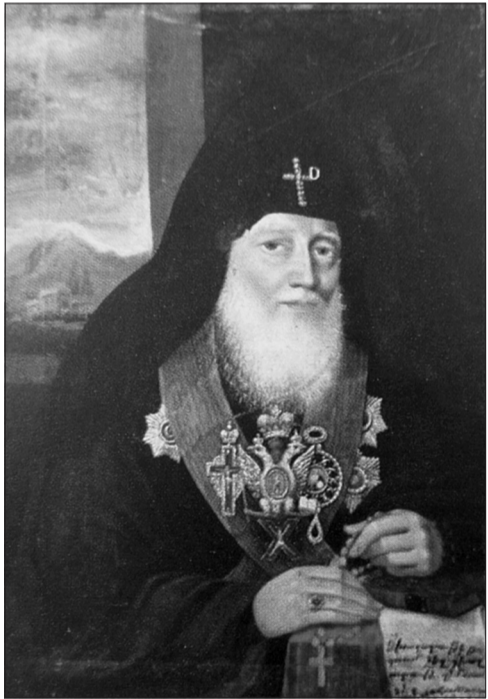
Հակոբ Հովնաթանյան. Եփրեմ Ա Կաթողիկոս, 1831 թ.

Սողոմոն Իմաստունն իր «Ժողովող» գրքում փորձում է երջանկություն գտնել արեգակի ներքո, այսինքն՝ երկրային սահմաններում. «Ինչ որ աչքս ուզեց, ինձ չգրկեցի դրանից, և ոչ մի ուրախության համար սրտիս վրա արգելեց չդրի» (ժող. 2. 11): Բայց իզուր, քանզի ամեն վայելքից հետո մարդու բերանում մնում է միայն մոխրի համը՝ դատարկության դառը զգացումը. ահա այն եզրակացությունը, որին նա հասնում է իր որոնումների և փորձառության ավարտին: Ադամական մեղքով պայմանավորված անխուսափելի մահը, անվերջանալի տառապանքները՝ ծննդյան օրից սկսյալ, ծերությունն ու հիվանդությունները, ամենայն վայելքն ու ուրախությունը, հարստությունն ու մինչև իսկ իմաստությունը, որը բացահայտում է գեղեցկությամբ սքողված կյանքի այլանդակությունը, ուր ամեն ինչ, մարդու կամքից անկախ, ունի իր ժամանակը՝ «ծնվելու և մեռնելու, լալու և ուրախանալու, սիրելու և ատելու, պատերազմի և խաղաղության» (3. 1—9), փխրուն, դյուրաբեկ, հեղհեղուկ են դարձնում մարդու երկրային երջանկությունը: Հետևաբար, ըստ աստվածաշունչի հեղինակի, «ունայնություն ունայնությանց» է այս աշխարհում բացարձակ երջանկության որոնումը, որը և գալիք սերունդներին ավանդված մի խորհուրդ է՝ կյանքի իմաստի փնտրության անդադանալու իրական ճշմարտության ուղին գտնելու: Եվ միայն Աստծո կամքի կատարումն է՝ անխուսափելի հատուցման հեռանկարով, որ, ըստ հեղինակի, կարող է մարդուն այս աշխարհում, թեկուզև սահմանափակ, երջանկություն պարգևել, թեև Հին Կտակարանում դեռևս հետմահու երկնային բերկրալի կյանքը սուկ մարգարեության ձևով գոյություն ուներ: ➔ էջ 6