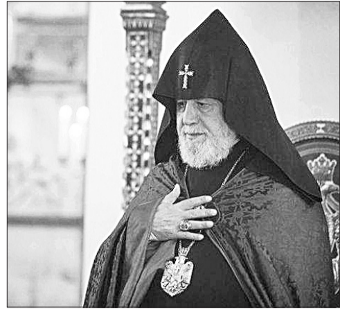
Լրատվական նյութերը՝ Մայր Աթոռ Սուրբ Էջմիածնի տեղեկատվական համակարգի

Վեհափառ Հայրապետն Ամենակալ Տիրոջ մխիթարությունն է հայցել Վրաց Ուղղափառ Եկեղեցու հոգևորականությանն ու վրաց սգակիր բարեկամ ժողովրդին՝ մաղթելով, որ Նորին Սրբության հիշատակը միշտ վառ մնա հավատավոր իր զավակների սրտերում և ներշնչման աղբյուր դառնա գալիք սերունդների համար: