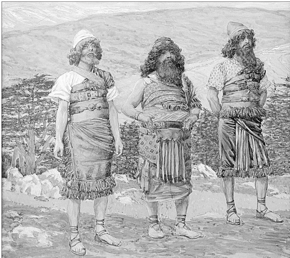
Ջեյմս Տիտ, Սեմը, Քամը, Հաբեթը, 1896–1902 թթ.

Ջրհեղեղից հետո Հաբեթը հիշատակվում է Նոյի արքեպիսկոպոսի պատմության մեջ: Քամը տեսնում է Նոյին հարբած ու մերկ իր վրանում և պատմում է իր եղբայրներին,