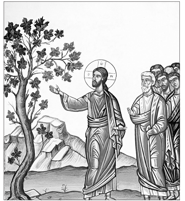
Անպտուղ թզնու անհծումը

Հայ ազգն էլ այսուրև ունի մարտահրավեր: Եթե մենք՝ որպես Բ ծրագիր, որ դարձավ Ա ծրագիր, սկսենք ապրել առանց Աստծո, եթե մեր քրիստոնեությունը դառնա միայն թանգարանային մուշկ կամ լոկ պատմություն, ապա մենք նույնպես կանգնած ենք սայթաքելու վտանգի առաջ: Աստված սահմանափակված չէ Հայաստանով կամ որևէ այլ ազգով: Եթե մենք դադարեցնենք լինել Լույսի կրողը, նա ունի և՛ Գ ծրագիր, և՛ Դ ծրագիր՝ այնքան, որքան հարկավոր է Լույսի կրողին գտնելու համար, և, այո, նա կարող է քարերից որդիներ հանել Աբրահամի համար: «Եվ մի կարծեք, թե ձեր մտքում կասեք՝ «Մենք