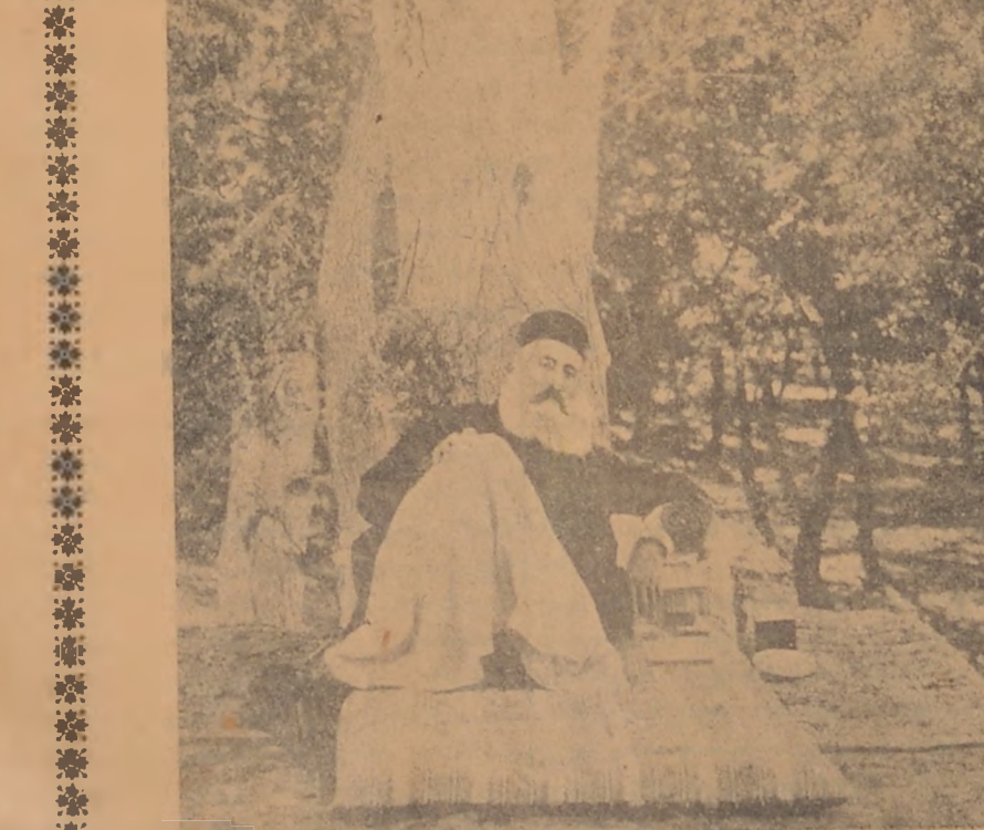
ԵՐԿՈՒ ԳՐԱՄԱՌՈՐ ԿԱՆՆԻՆԵՐ ԿՌԵԱԿ ԿՌԵԱԿԻ

Անխնայ մորեւնեգ, այլես պիտի մարութի, այս աշխարհի օրեք, կարգ ու խղճանք այնպէս է, մարդիկ որ սեր են եւ կ'իջեն անասնոց, ոչ- խարի նման՝ մարդիկներէն պիտի մարութի, երբ չունին խեղիչ եղբիւր, որ ցոյլի նման դարձի իրենց կտրելու գեմ: