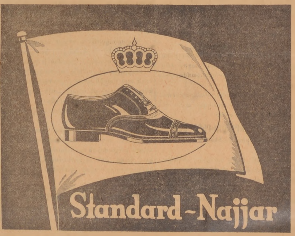
ԿԵԳՐՈՆԵՏԵՂԻ ՆԱՃԱՐ ԵՂՐԱՍԵՐՆԵՐՈՒ ՎԱՃԱՌԱՏՈՒՆ

ՍՄՍԱՆՍԱՐՍ Կոշիկները միշտ ամենաբար, ամենադիւստրակուն, ամենալուստիւն եւ ամենազեղչիկներն են.