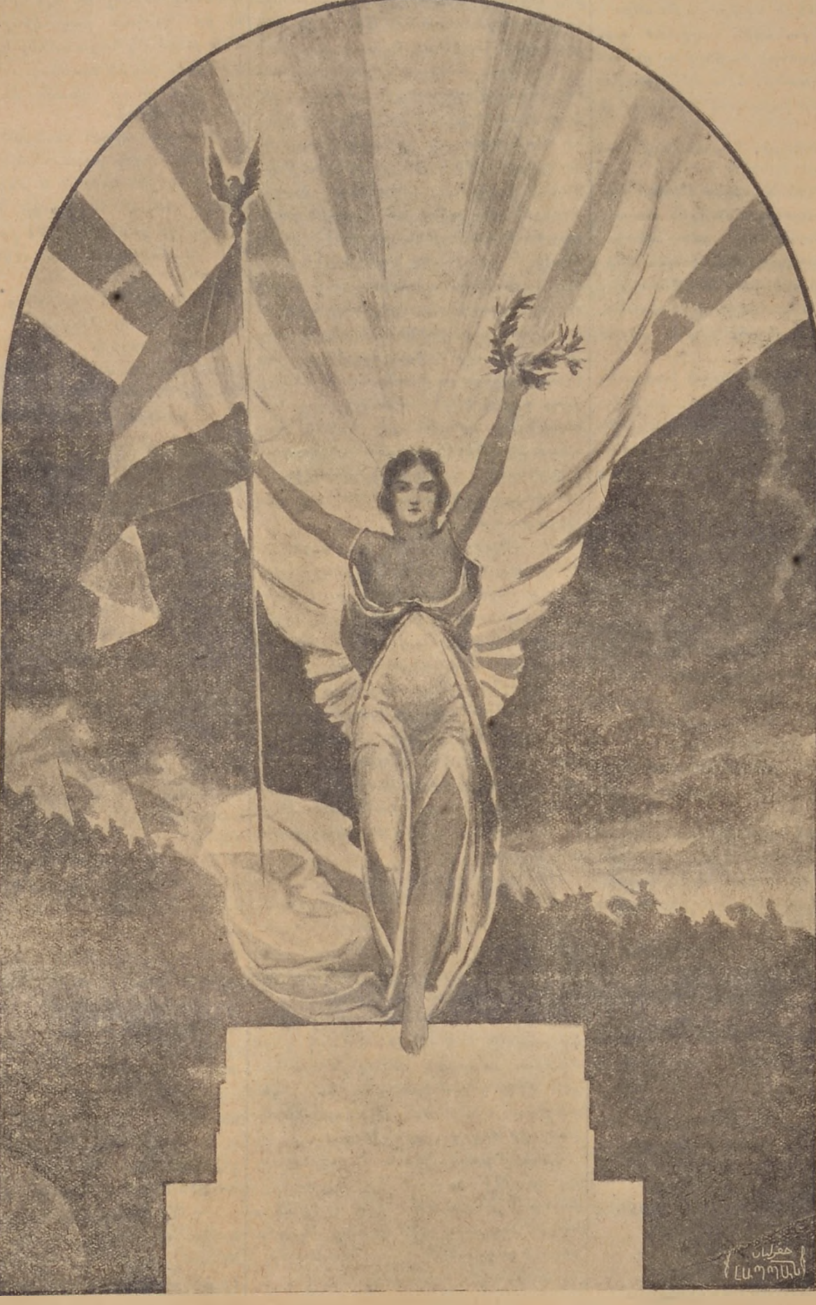
Նկարում օգտագործուեց Երկաշխի Պ. Մ. Ալթունեանի կողմից մատուցած արվեստը:

Ազգերը կրանիթեայ կամք կուենան: Իսկ Հայ ժողովուրդի կամքը անխորտակելի է: Ա՛հ այդ երանելի օրը...!