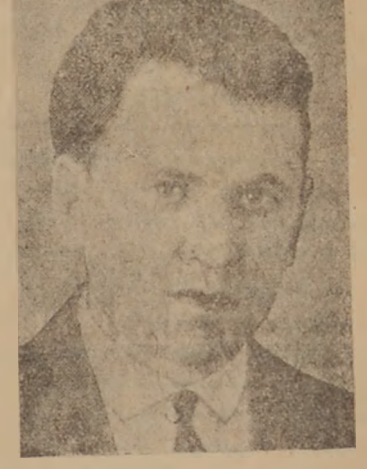
Պ ՏՈՒՄԻՍԻՍ ՍՊԱՆԻՅԻՆ ԿՈՐԿՈՒՍՈՒԹՅԱՆ ԿԵՐՎԱՐԻՆ

Միւս կողմէ, խաղախ ցնդապետ Հիլիգեյն, ինչ որ փարիզի խմբագրին յայտնել վերջ թէ ճիշտեալի մէջ խաղախներու երեք բնկերակցութիւններ միայն կան, ըսած է Կորկուսի մասին: Անոր անունը խաղախ անունն է: Ան ծնած է Լապիւնքայա, բայց հայկական արտաստիքով է: