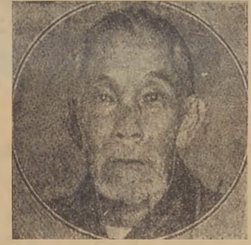
Վ.Ա.ՐԱՊԵՏ Գ. ԻՆՈՒ-ԲԱՅ

Թոքիոյ. — Վարչապէս պ. Ինուայ սպաննուեցաւ զինուորական համազգեստ հագուած անձի մը կողմէ, որը աքնորոշի երկու հարուած արձակեց անոր վրայ: Գնդակին մէկը անցաւ ֆուքսի եւ միւսը իրէն: Մամափորձը սեղի ունեցաւ վարչապետին պատճառով: Վարչապետը վրէժալի մը արդարեալ կը շարունակէ իր գործը: Վարչապետը վրէժալի մը արդարեալ կը շարունակէ իր գործը: