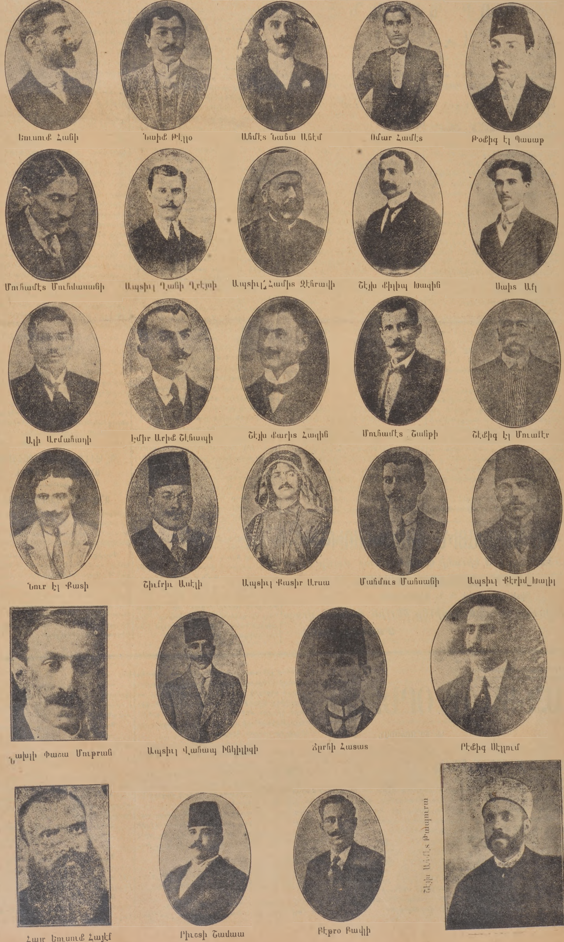
Հայր Եւուսի Հայէ, Բիւսի Շամաա, Բէքո Բակի, Շէյխ Ա. Մ. Քոստանտին