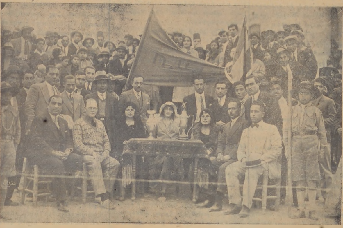
Հ. Մ. Ը. Մ. Միջմասնաճիւղային մրցումներու միջոցին օրուայ թագուհին եւ պատուոյ օրհորհները Երզրայուսուած Երջ. Վարչութեան եւ Հալէպի Տեղական Վարչութեան անդամներէ