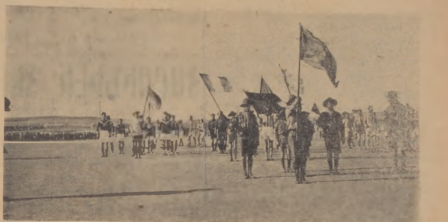
Յոյս ԱՐԱԿԱՍ Հ. Մ. Ը. Մ. ի Սիբիրիոյ և Լիբանանի Բայցային խումբերը տղաքը: Վերջ Հայկական խորհրդարանին վրայ

Ցոյց տալու համար որ մենք չ'ստեղծուեցանք ենք ու յաճախ մեր քիթ տակը չենք տեսներ: Եւ այս ճանապարհով պէտք է վերագրել Փարիզին կապուած եւ ի վերջոյ հաւատարմ ուժ ստացած յոյսը: Տարբերութեան բաւական եղաւ ապացուցանելու որ «Հայկական Փարիզը» զգուշութիւն չունի և եթէ կ'ուզէ գոյութեան իրաւունք այլ չունի: